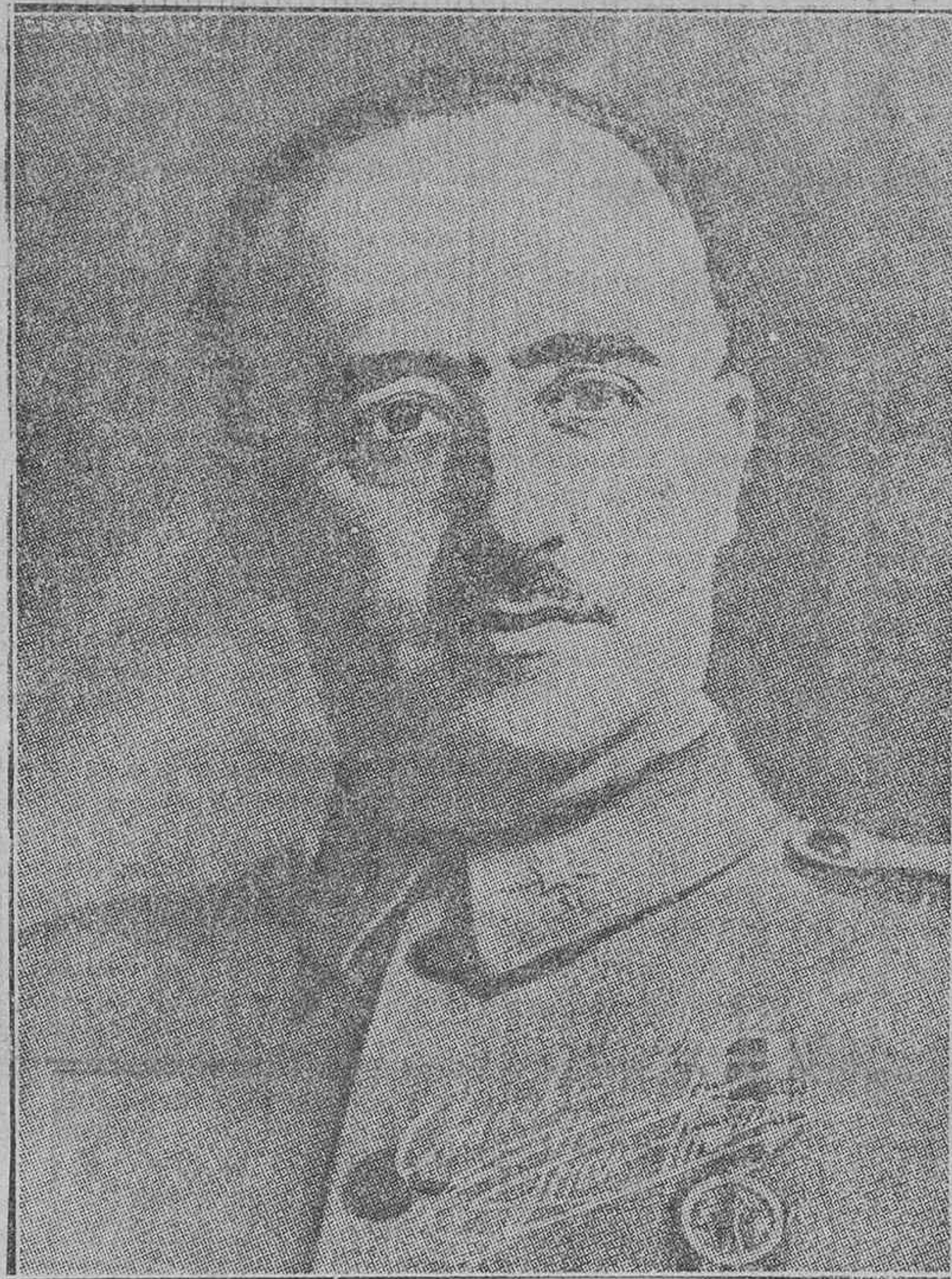
Parte oficial de guerra del Cuartel General del Generalísimo, correspondiente al día 11 de marzo de 1938:

En el frente de Aragón ha proseguido en el día de hoy el victorioso avance de nuestras tropas. Las fuerzas de la derecha han ocupado La Hoz de la Vieja, el Vértice Coronillas, el Vértice sobre El Alcaine, el San Miguel sobre Obón, los pueblos de Josa, Alcaine, Obón, cota 1.157 al Sureste del Collado de la Virgen, pueblo de Martín del Río, donde hubo que vencer tenaz resistencia del enemigo, los vértices Cerrado y cota 1.439.