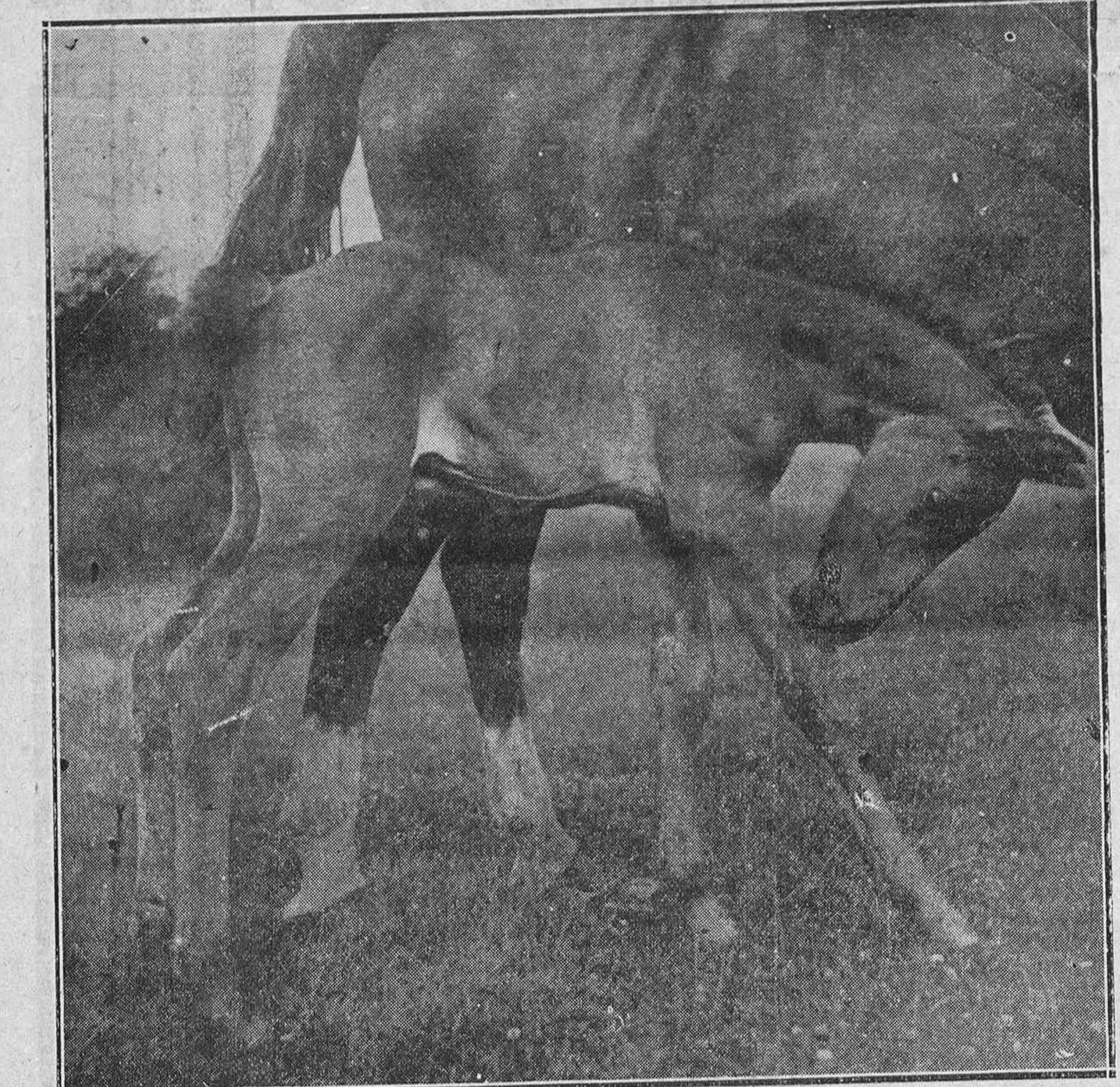
Trisca ya, por nuestros prados y otros alaveses, la cría caballar, pingüe riqueza de nuestros agricultores, aunque cada vez más esasa por la extensión de la maquinaria, supliendo a la tracción animal, y por la carestía de los pastizales convertidos en campos de labor cada vez más avaramente.

CUBIERTOS MESA resultado de toda garantía, 12 piezas por pesetas 10'50. Observe usted que sale a menos de 0'95 cada pieza. CUCHARITAS CAFE, 6 piezas, por 4'75. Tenedores merienda o pasteles, media DOCENA por 4'75. Llevando el juego de 12 piezas, NUEVE PESETAS. CUCHARON DE SERVIR COCIDOS a 6'50. Cazo sopa, 7'50 y en alpaca contrastada, 4 pesetas y 4'75. Calidad primera contrastada aun los de 4 y 4'75. SORTIJAS SELLO, calidad reforzada oro. Es un chapado que no puede perder nada, SELLO tamaño para niños, a 4'50. Tamaños para señoritas, a 6'50. Tamaños para caballero, a 8 pesetas. ALIANZAS reforzadas de oro, gran resultado, a 6'50. Estas alianzas se venden en esta casa hace muchísimos años, sin haber tenido queja alguna sobre su resultado. ALIANZAS MACIZAS, 16 pesetas según su peso. ORO LEY, desde 22'50. Con su contraste. Variado surtido en objetos propios para regalos. Vasos plata y alpaca contrastada, desde 3'75. ISASIA = TOYERIA = VITORIA = DATO, 24