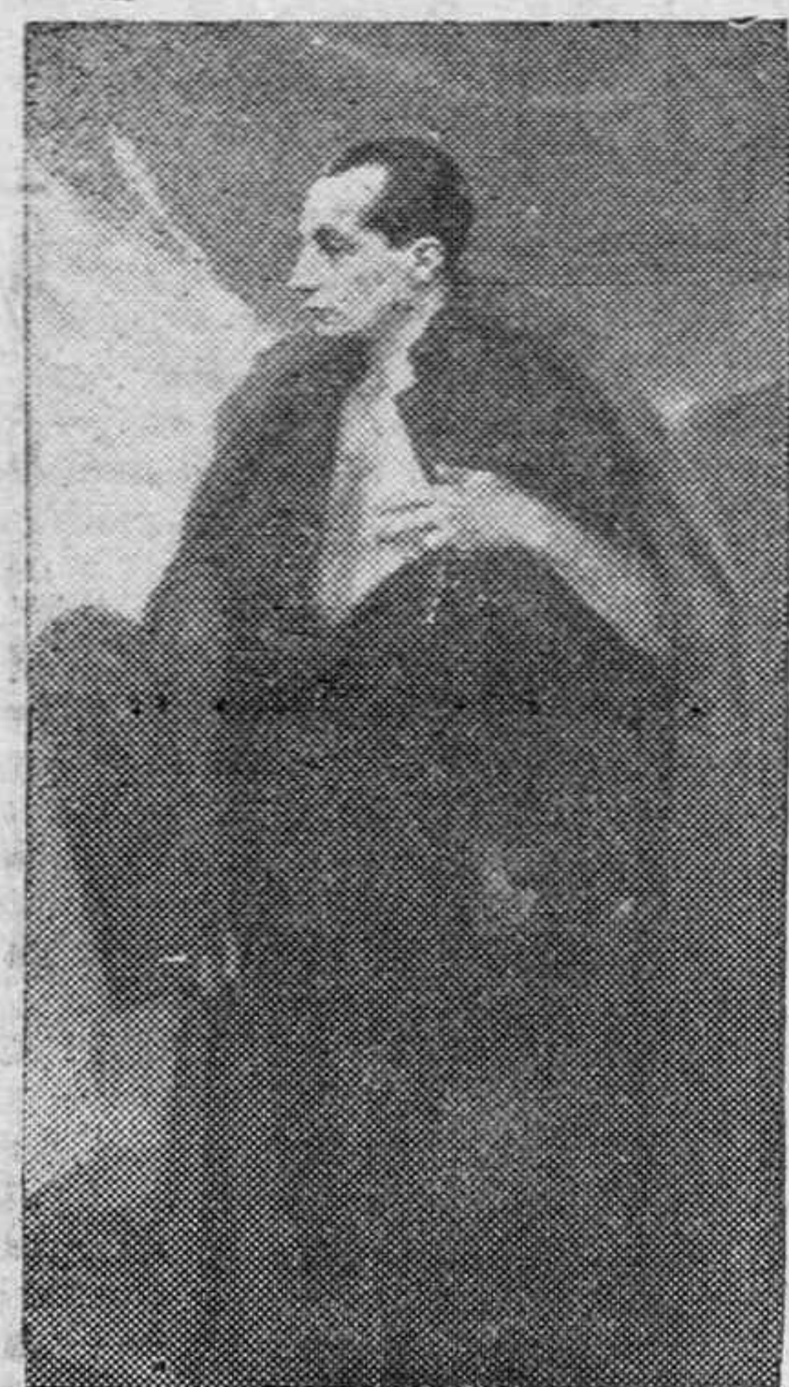
Como de un fondo de entre nubes, José Antonio aparece, portador de las tabas, abriendo su pecho del que pende la Cruz.