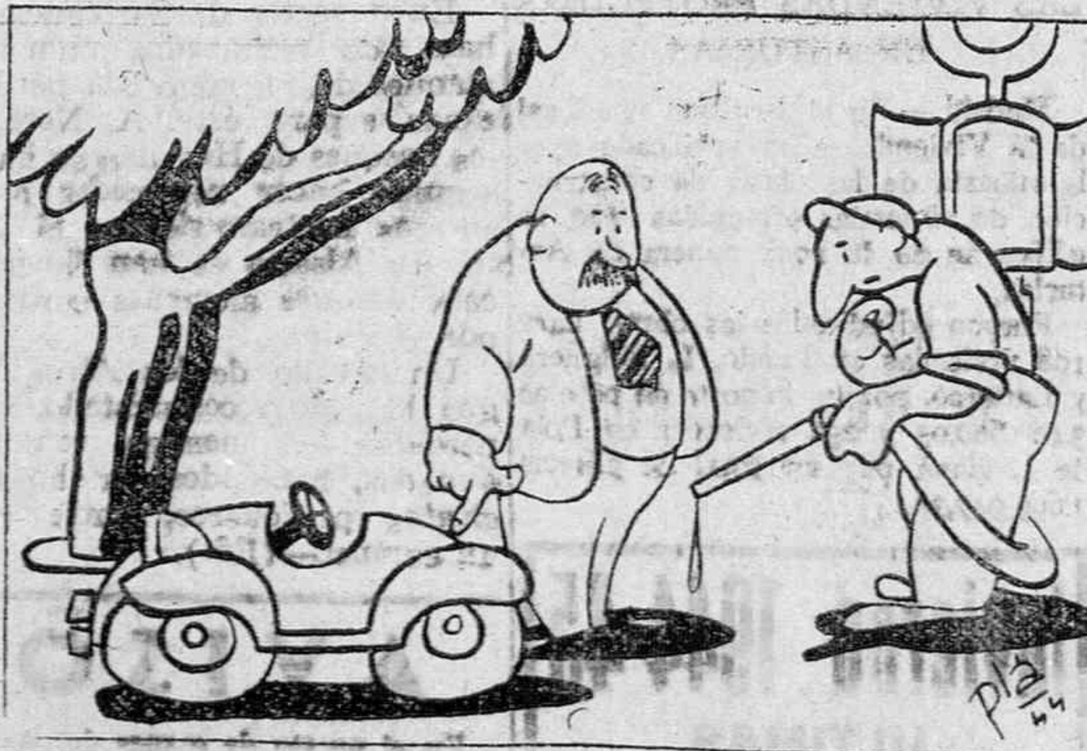
—Echeme un real de gasolina. —¿No será mucha?

EL TIEMPO PASA, PERO EL RELOJ "RECORD" QUEDA DE MODA. Cubiertos mesa, desde 19 pesetas las 12 piezas. Cubiertos mesa gran plateado, calidad de toda garantía, 12 piezas, 52 pesetas. Surtido en objetos para regalo. Vasos y cubiertos para colación.