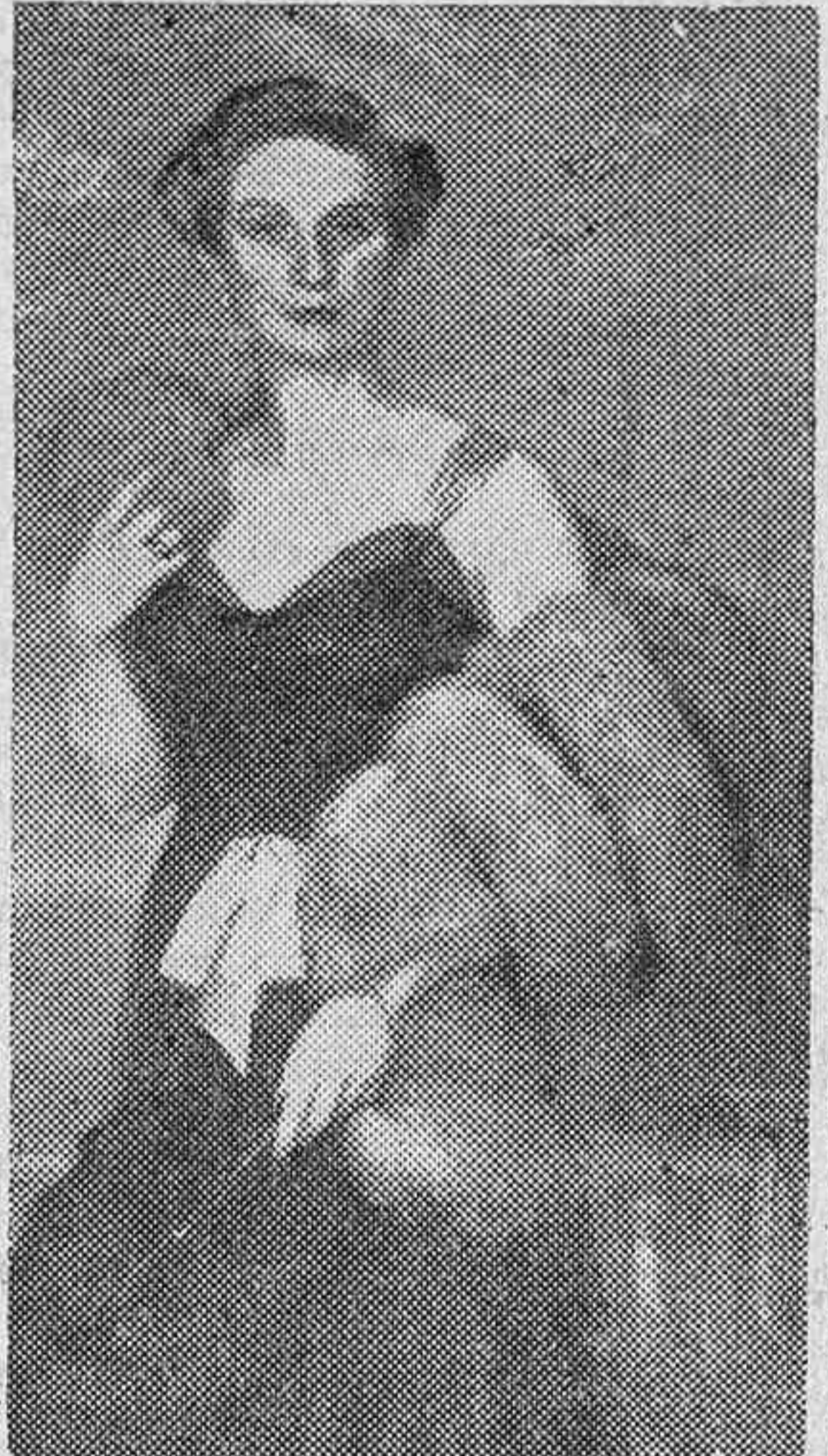
Retrato de mujer española, aristocrática y belleza, que el pincel de Espinosa ha plasmado con firmeza.

En París continuó su labor pictórica dedicado siempre al retrato, al igual que en Londres. En 1935 regresó a la Península presentándose con una exposición en el museo de San Telmo, de San Sebastián, uno de cuyos cuadros fue adquirido por el propio Museo. La exposición abierta ahora en Madrid tiene el interés de ser la primera que hace en la capital de España.