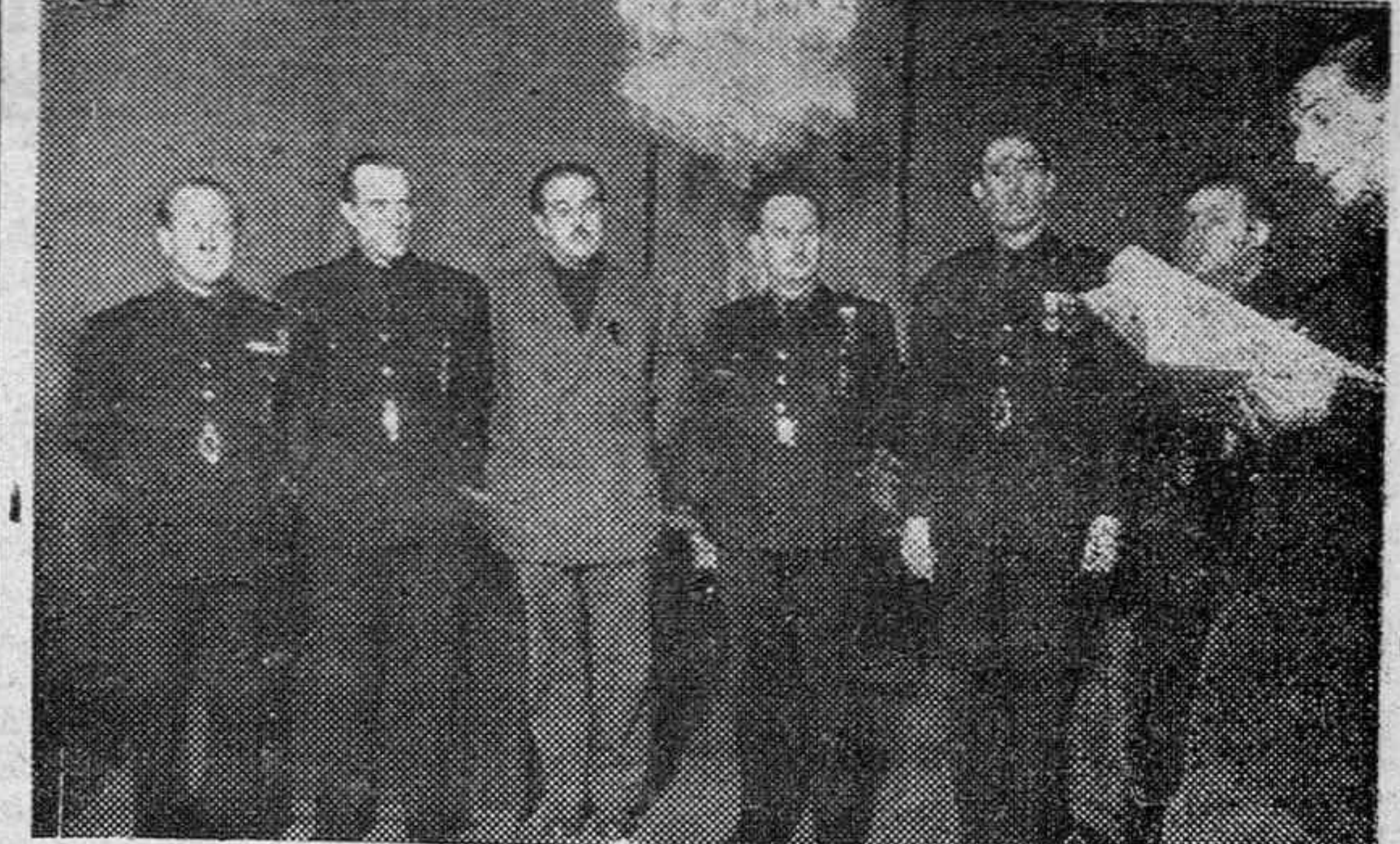
El Ministro Secretario General del Movimiento en presencia del Ministro de Trabajo, da posesión de su cargo a los nuevos Viceministros Generales del Movimiento y de Secciones.

Con un desvío ejemplar Franco ha alentado esta política de Bellas Artes, que ha culminado en salvar de la ruina a monumentos de una inapreciable calidad artística. Esta es la razón de que el Ministerio, con su declaración de monumento histórico-artístico haya salvaguardado su destrucción irremediable la Abadía de beneditino, de Samos; las ruinas del Castillo, del palacio y de la ermita de Muñatones, en Vizcaya; la iglesia y la torre de San Andrés del Castillo de la Tota, en Cataluña; la iglesia parroquial de Santa María de Azoque, en Betanzos, y la iglesia en ruinas de Nuestra Señora de la Merced, en Santa Coloma, de Queralt. En resumen, y como usted ve, en el triple ámbito de la investigación, la docencia y el arte, el celo del Estado español, no sólo no decreta, sino que se acrecienta, estimulado por el ideal de un porvenir que bajo el signo de Franco devuelva a España su destino glorioso.—Cifra.