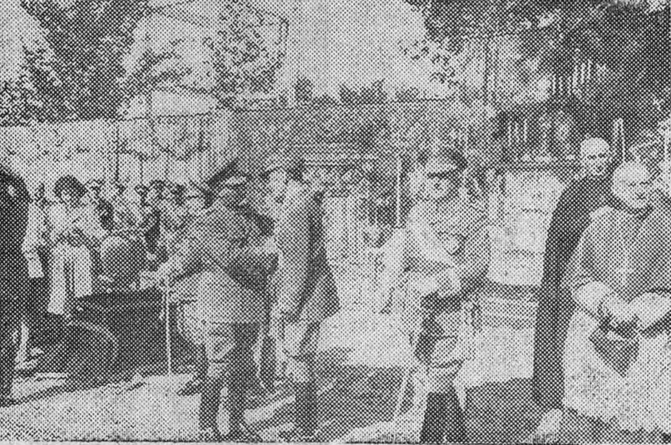
El General Millán Astray felicitando al Caudillo en el día de su fiesta onomástica.