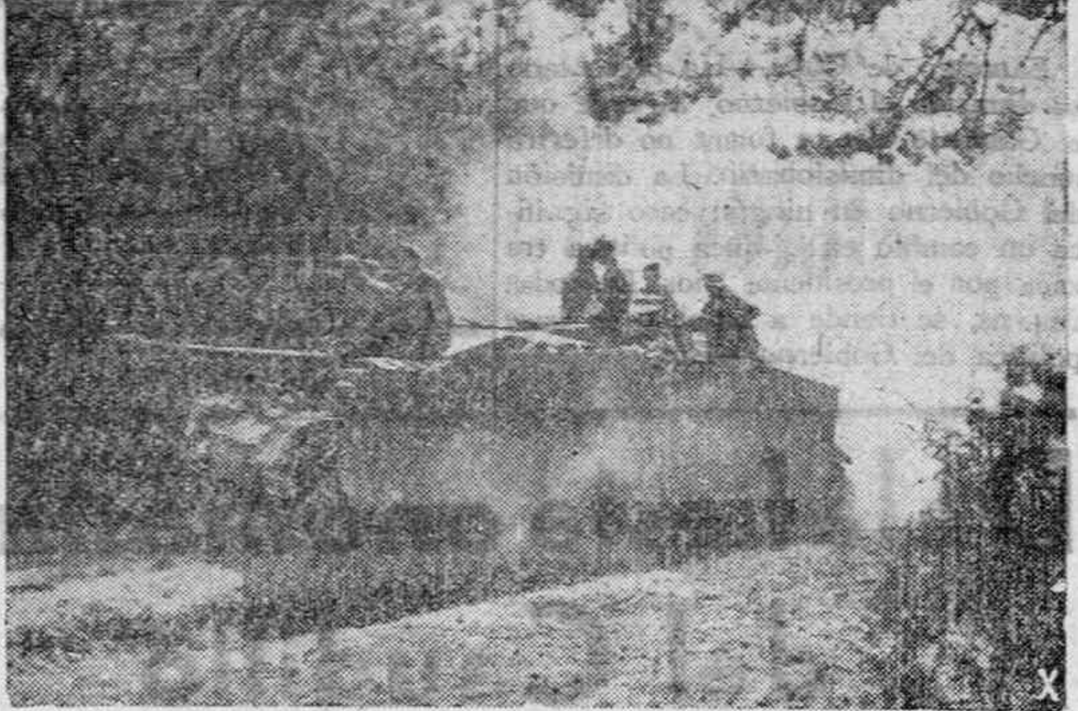
Un carro de asalto alemán avanza hacia las líneas enemigas. A pocos metros de distancia los infantes esperan el momento de entrar en acción para asaltar una importante posición soviética.

Viajes de boda, comerciales, recreo, etc., "forfait" o todo comprendido. CAFRANGA, Ortiz de Zárate, 4. — Teléfono 2334.