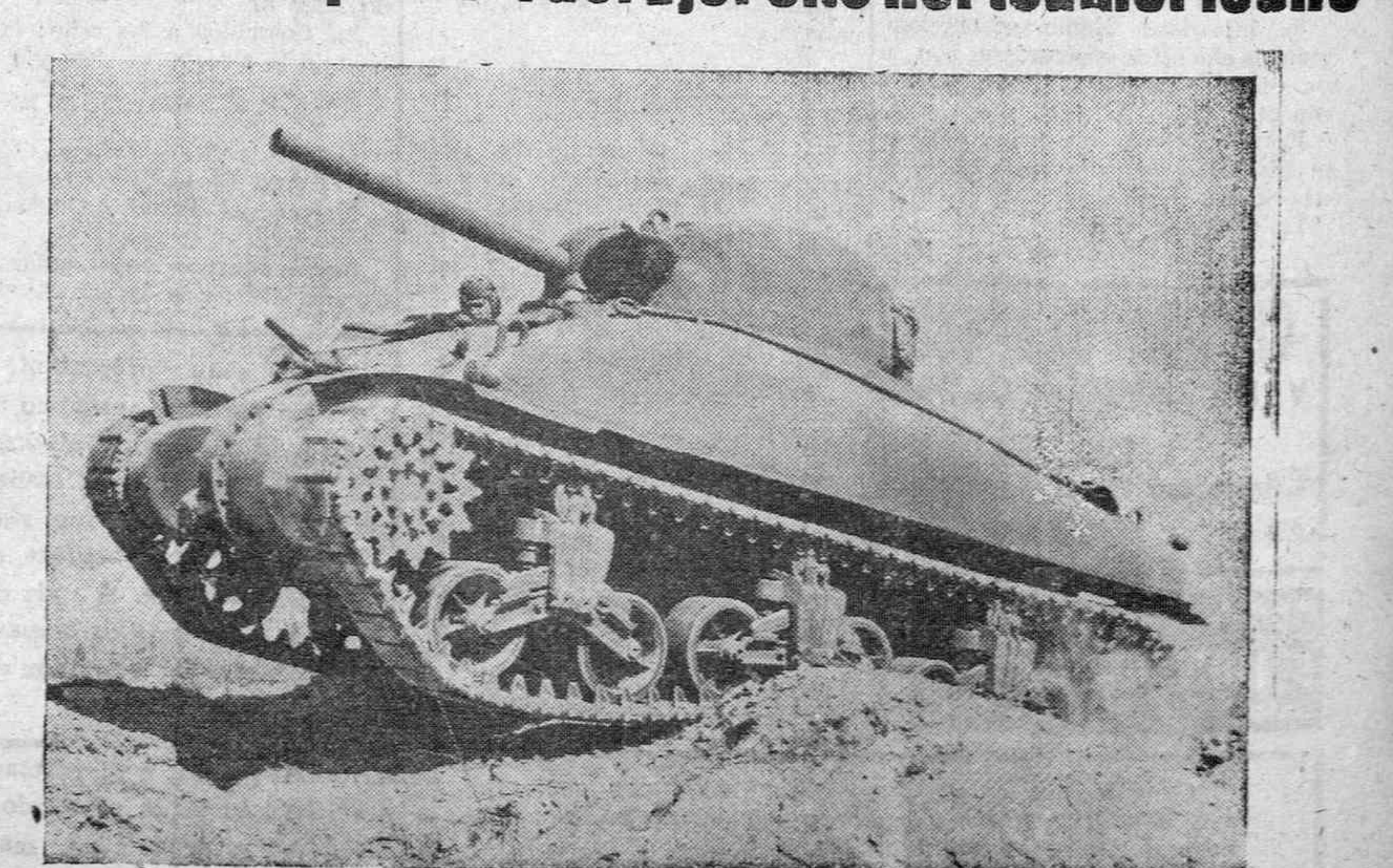
El M-4, tanque norteamericano de 30 toneladas, tiene muchas características nuevas y mejoradas que no pueden hallarse en ninguna máquina similar. De capital importancia es su silueta aplastada, sin ángulos bruscos, que le convierten en un blanco difícil para el enemigo.