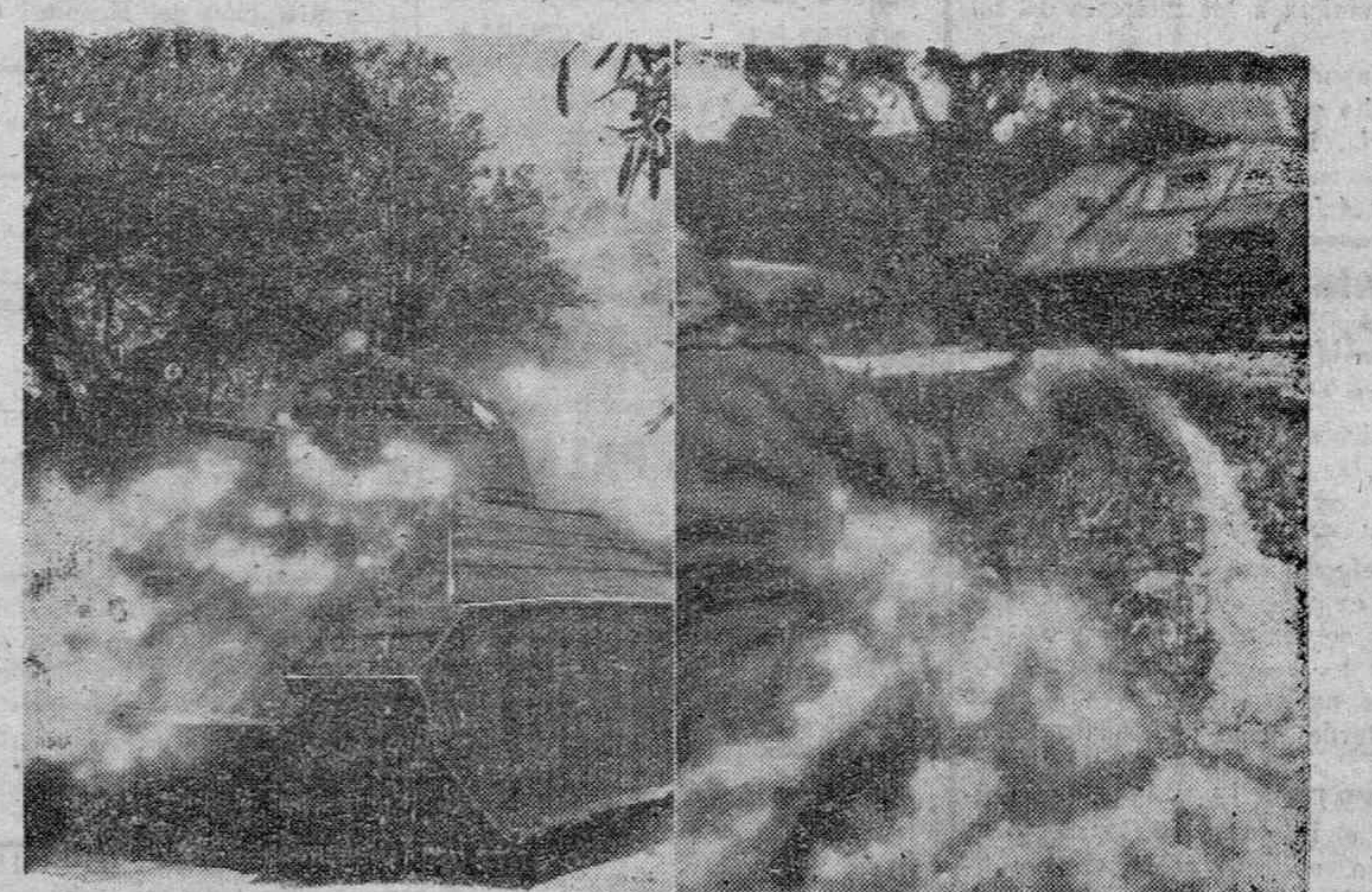
Un tanque para poder actuar sin ser visto o para protegerse de un ataque del enemigo, procede al empleo de la niebla artificial para su mejor camuflaje.