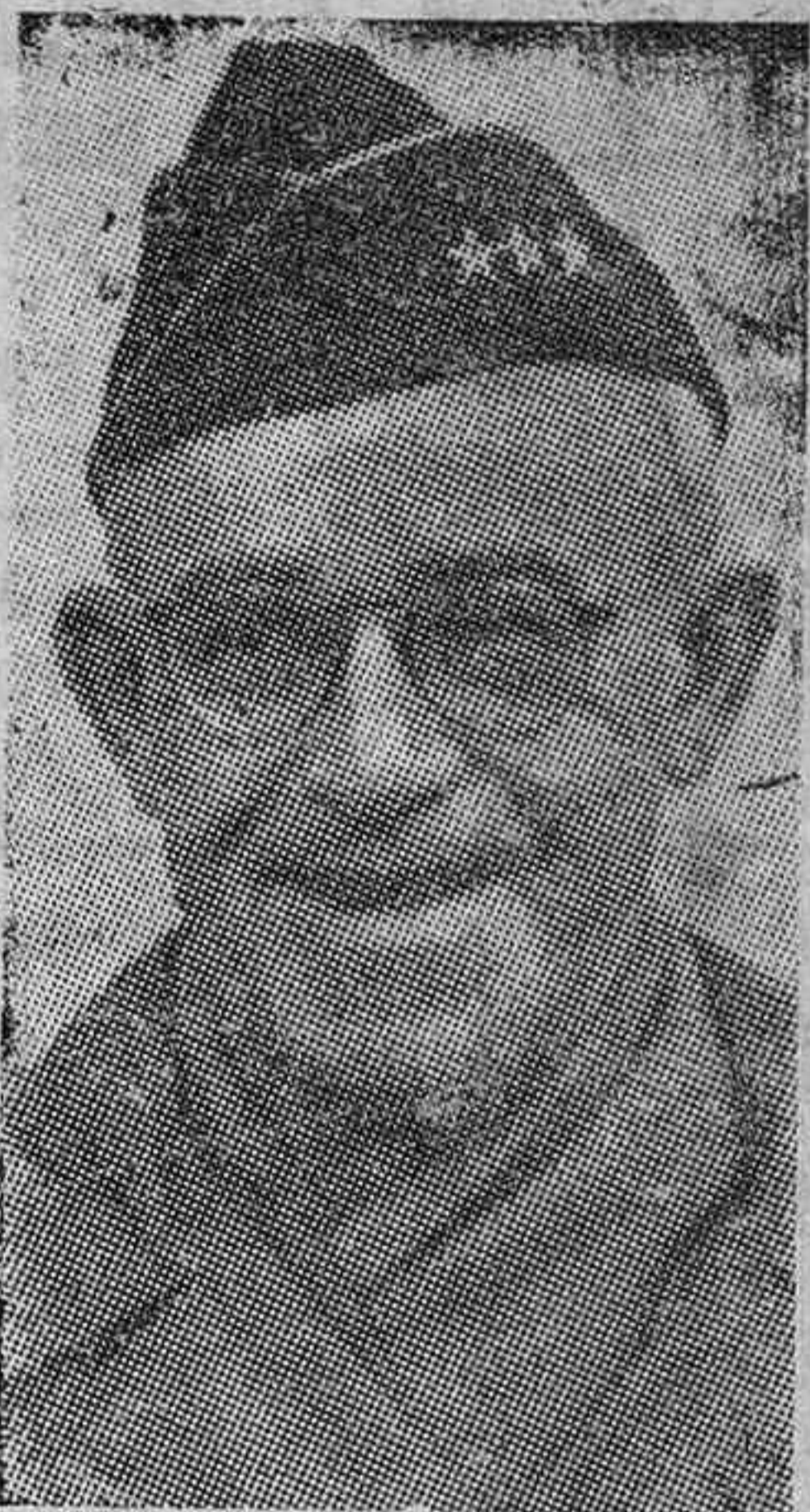
El General Bradley, jefe de los ejércitos norteamericanos en Francia.