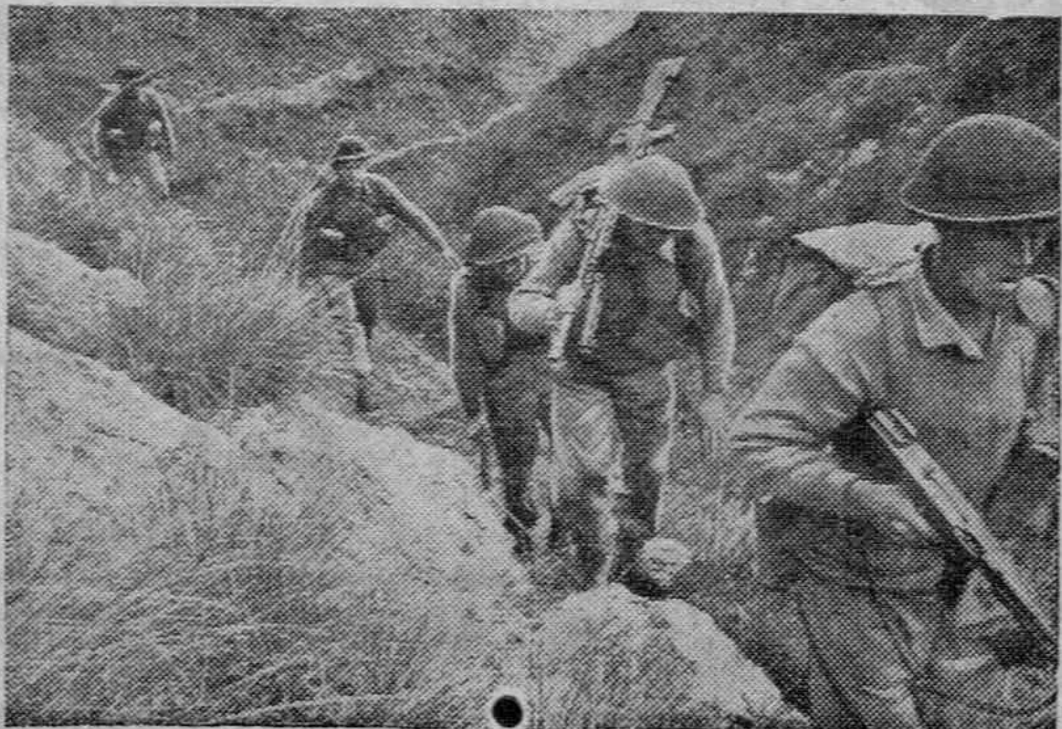
Tropas británicas en el avance por un lugar difícil y montañoso del frente italiano.