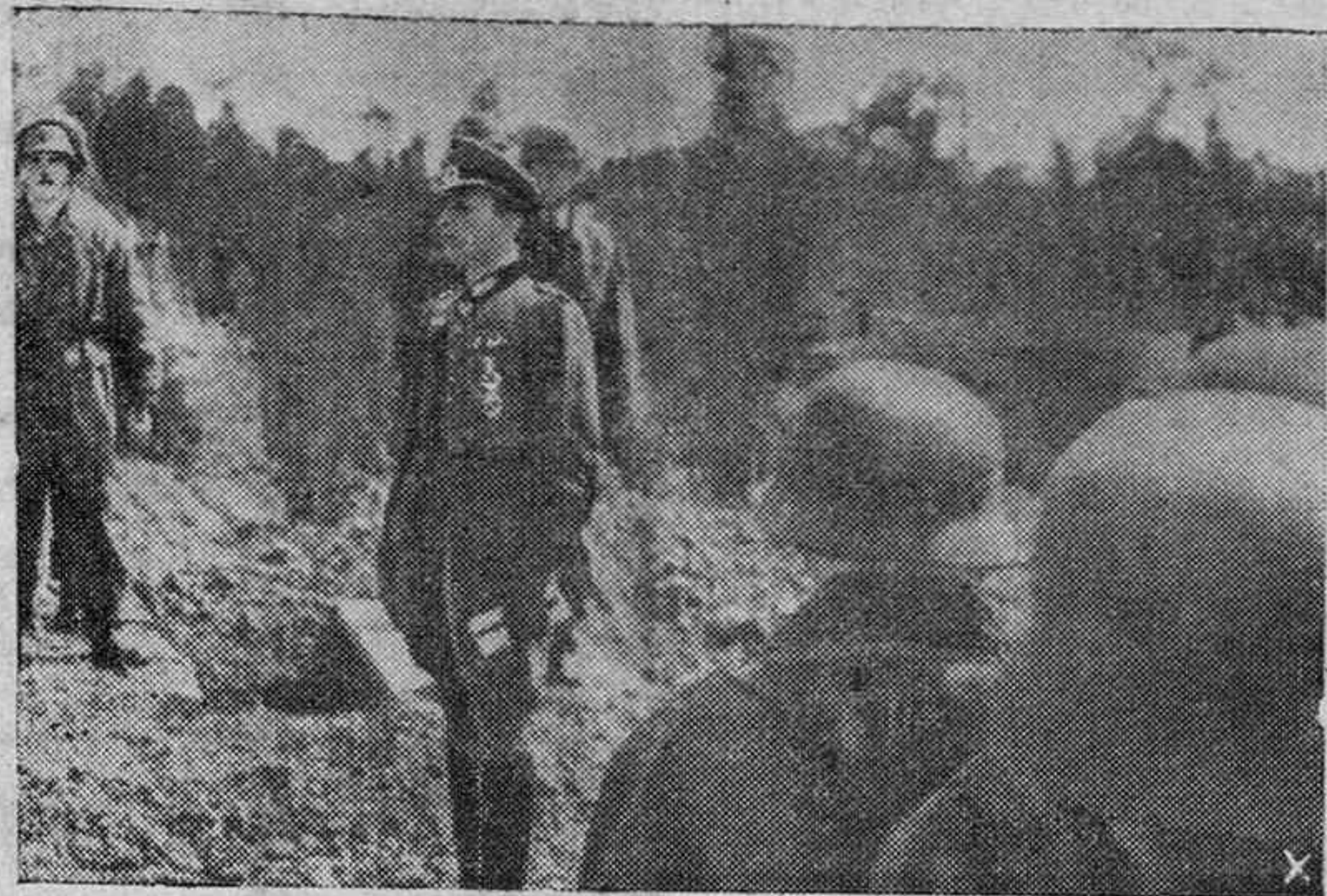
El Coronel von Aulock, el heroico defensor de Saint Malo, en el acto de serle impuestas las Hojas de Roble para la Cruz de Caballero de la Cruz de Hierro.