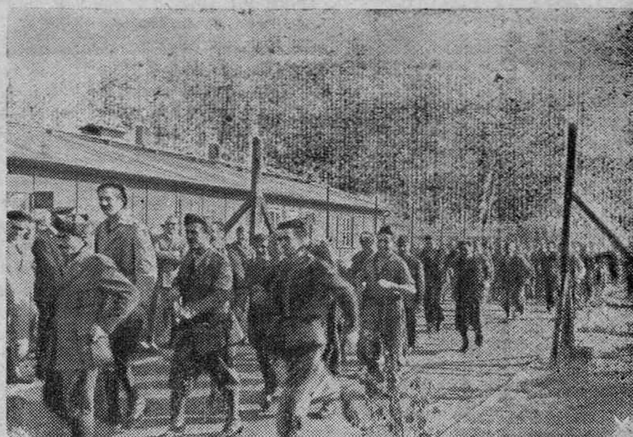
Cumpliendo la promesa dada por el Führer al Duce, todos los internados militares italianos han pasado a trabajar como civiles en las industrias del Reich. En nuestra fotografía vemos el momento en que son abiertas las puertas de uno de los campamentos.