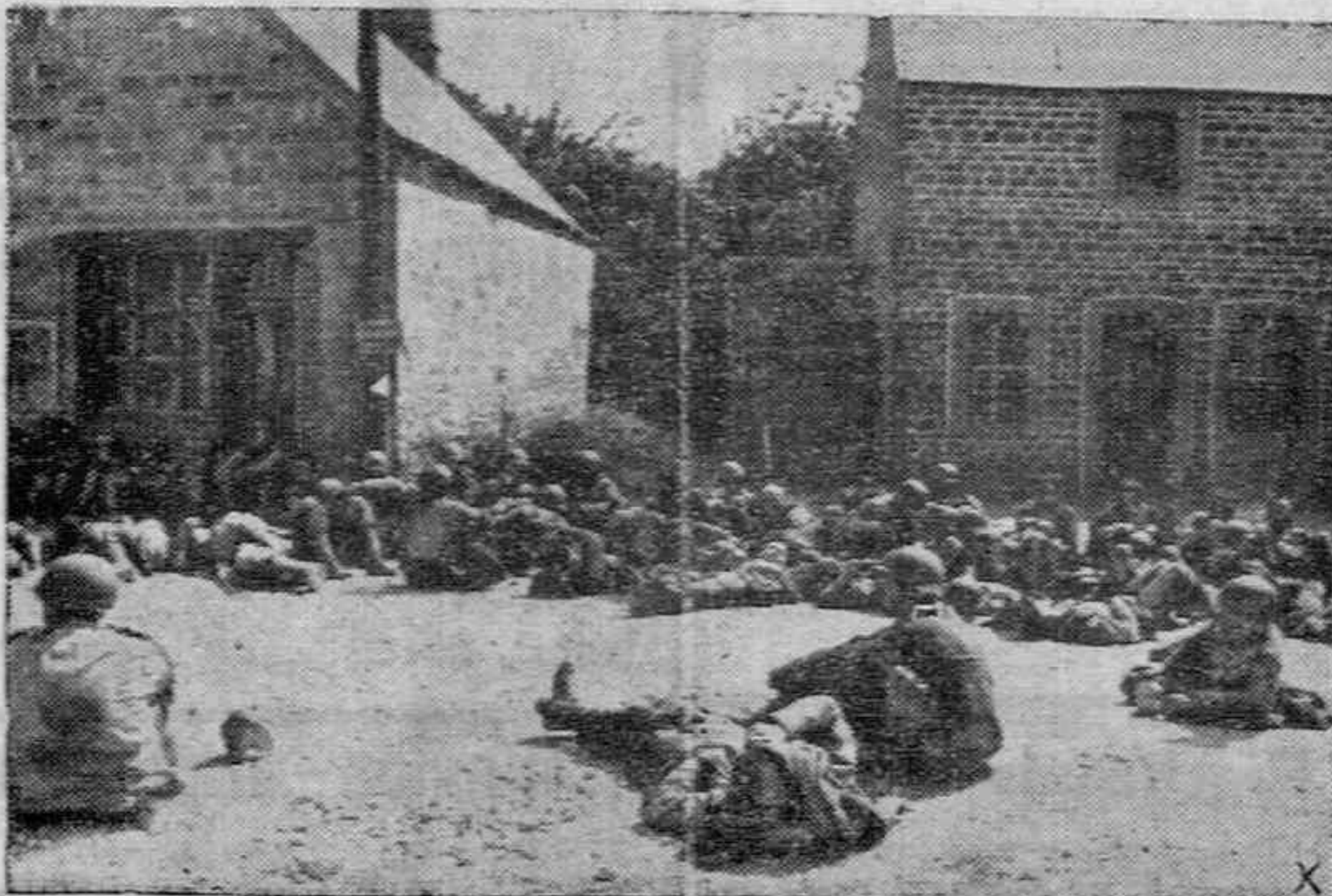
Prisioneros norteamericanos capturados por los alemanes en la península de Cotentin.