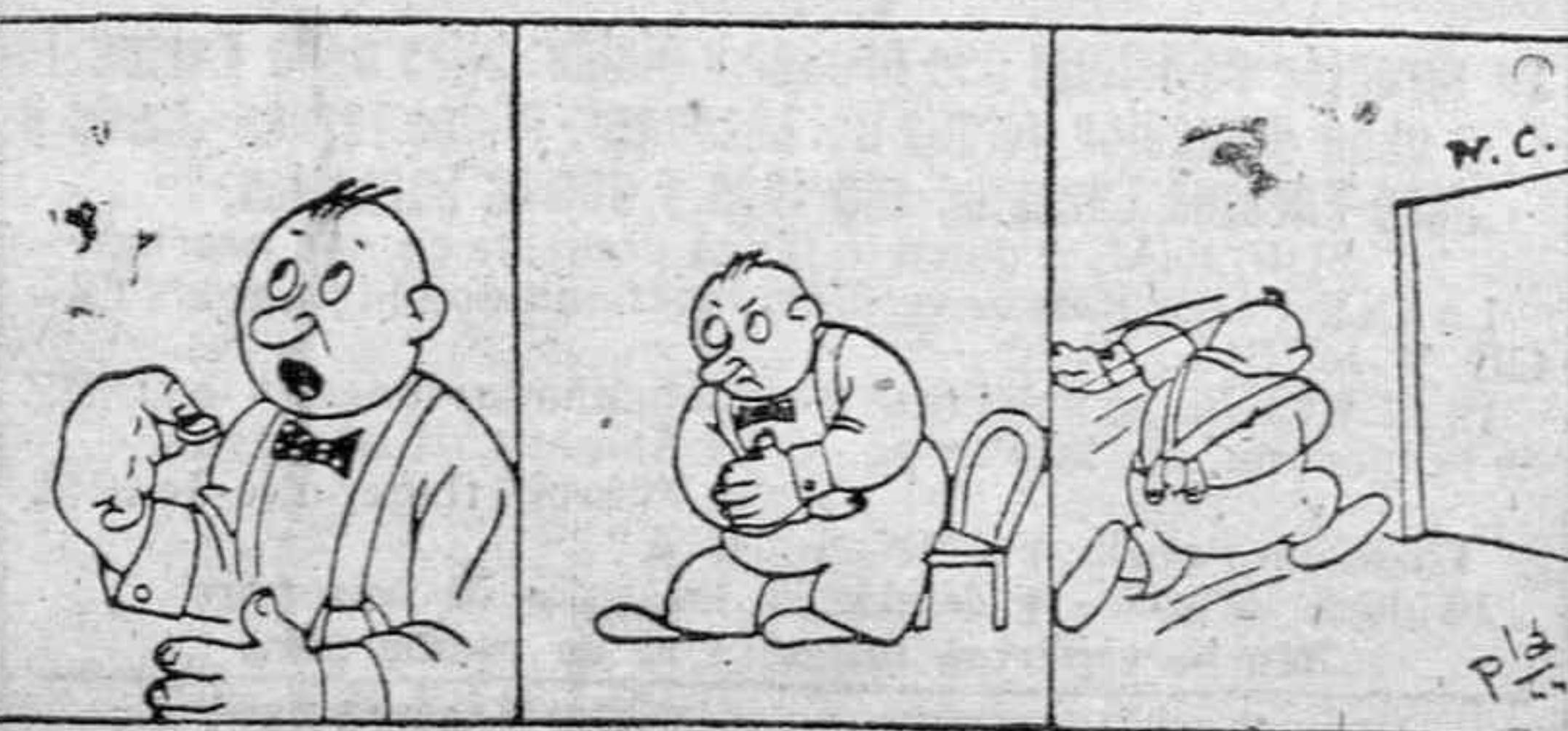
El sello de urgencia.

"18 de julio".--Nuevo Teatro, acto de afirmación Nacional-Sindicalista. El Seguro de Enfermedad será tratado ampliamente por los oradores.