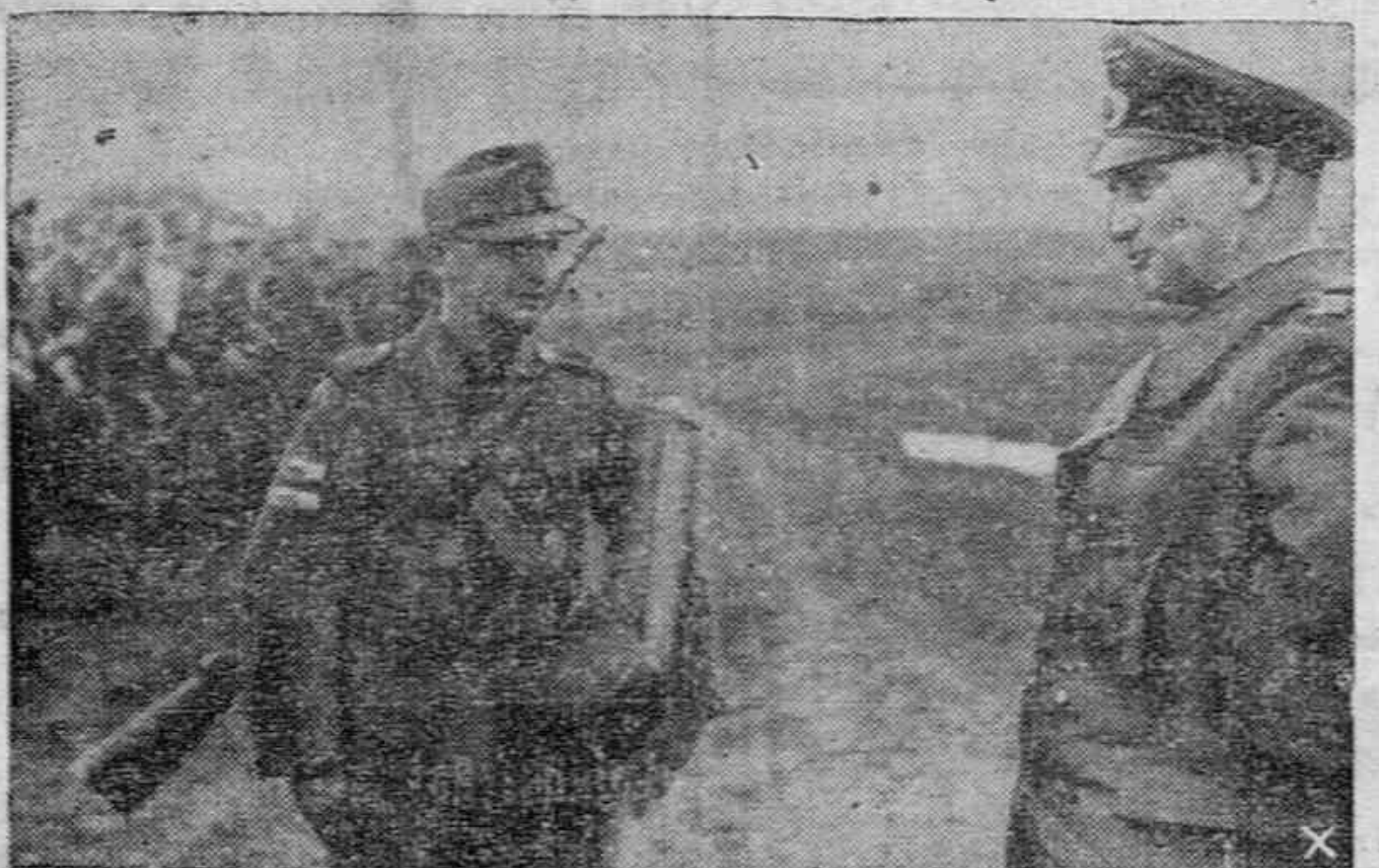
He aquí a un especialista del arma antitanque explotando al Mariscal Model los éxitos obtenidos contra el enemigo.