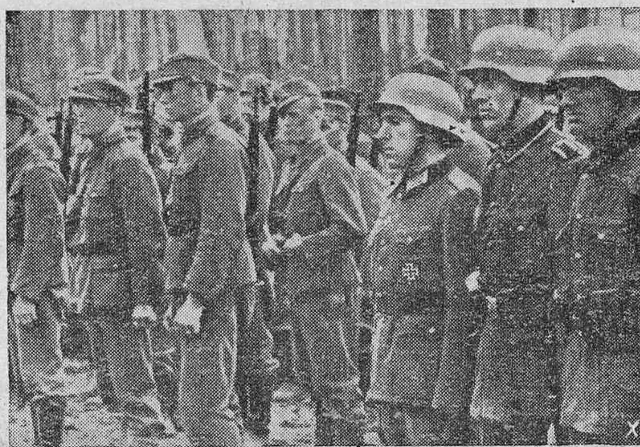
Soldados alemanes y finlandeses confraternizan en camaradería del armas en un lugar del frente.