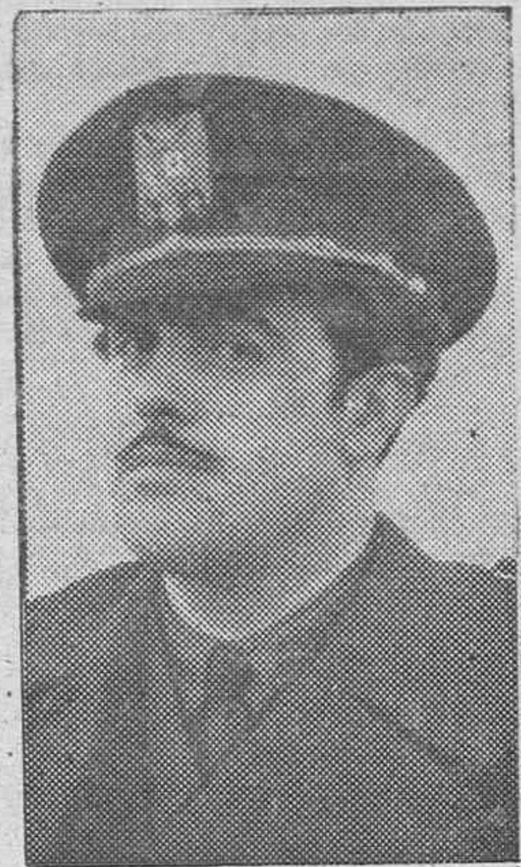
EL MINISTRO DE TRABAJO SEÑOR GIRÓN

Castellón de la Plana.—Bajo la presidencia del ministro de Trabajo, camara Girón, se han celebrado solemnes actos de inauguración y entrega del poblado construido para sus obreros por una fábrica de calzado allí establecida, al amparo de la Obra del Hogar. En primer lugar se procedió a la bendición e inauguración de una iglesia, colocada bajo la advocación de la Virgen de los Desamparados.