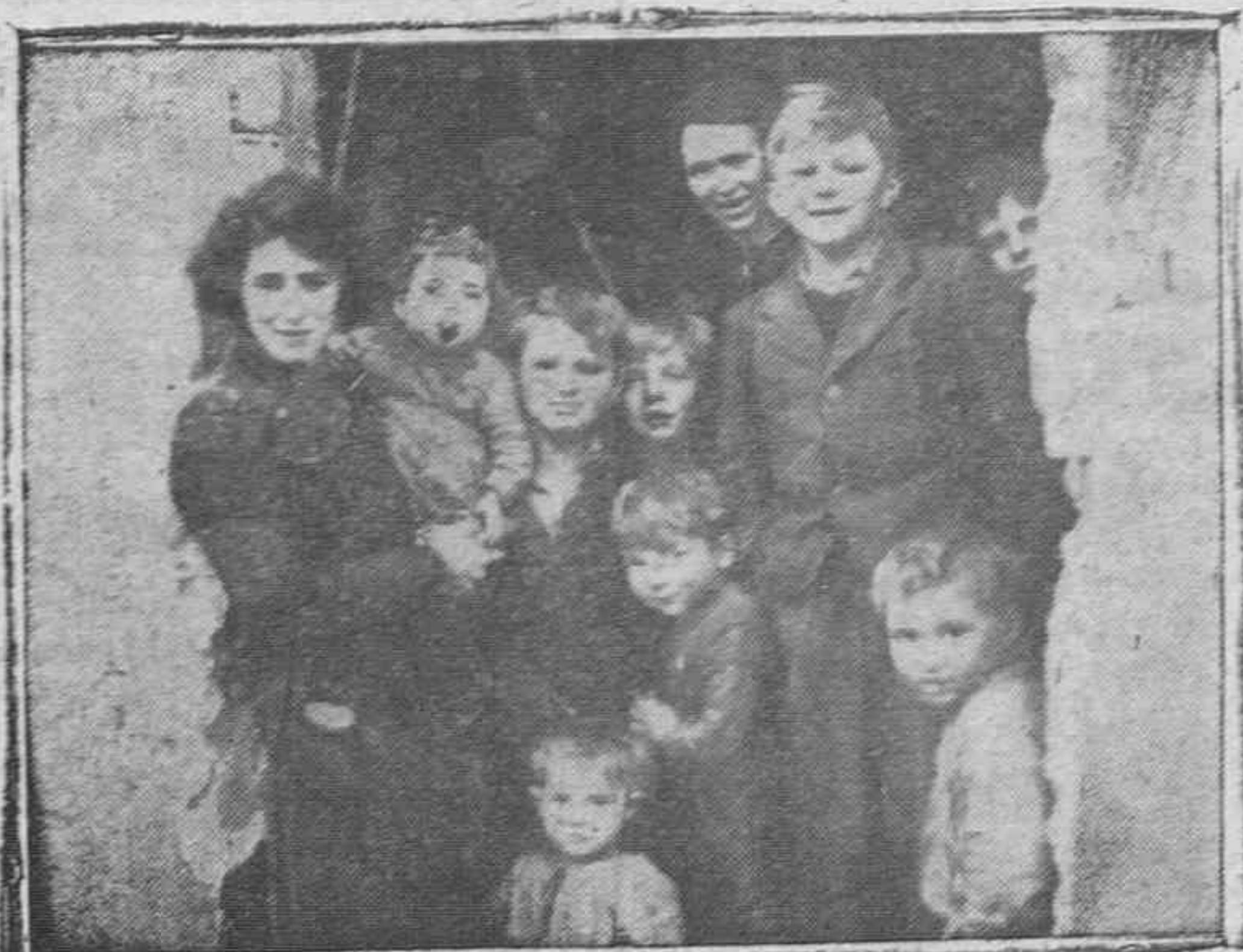
De las zonas de ocupación rusa llegan continuamente a territorio alemán ocupado por los aliados mujeres y niños evacuados y en lamentable estado sanitario.