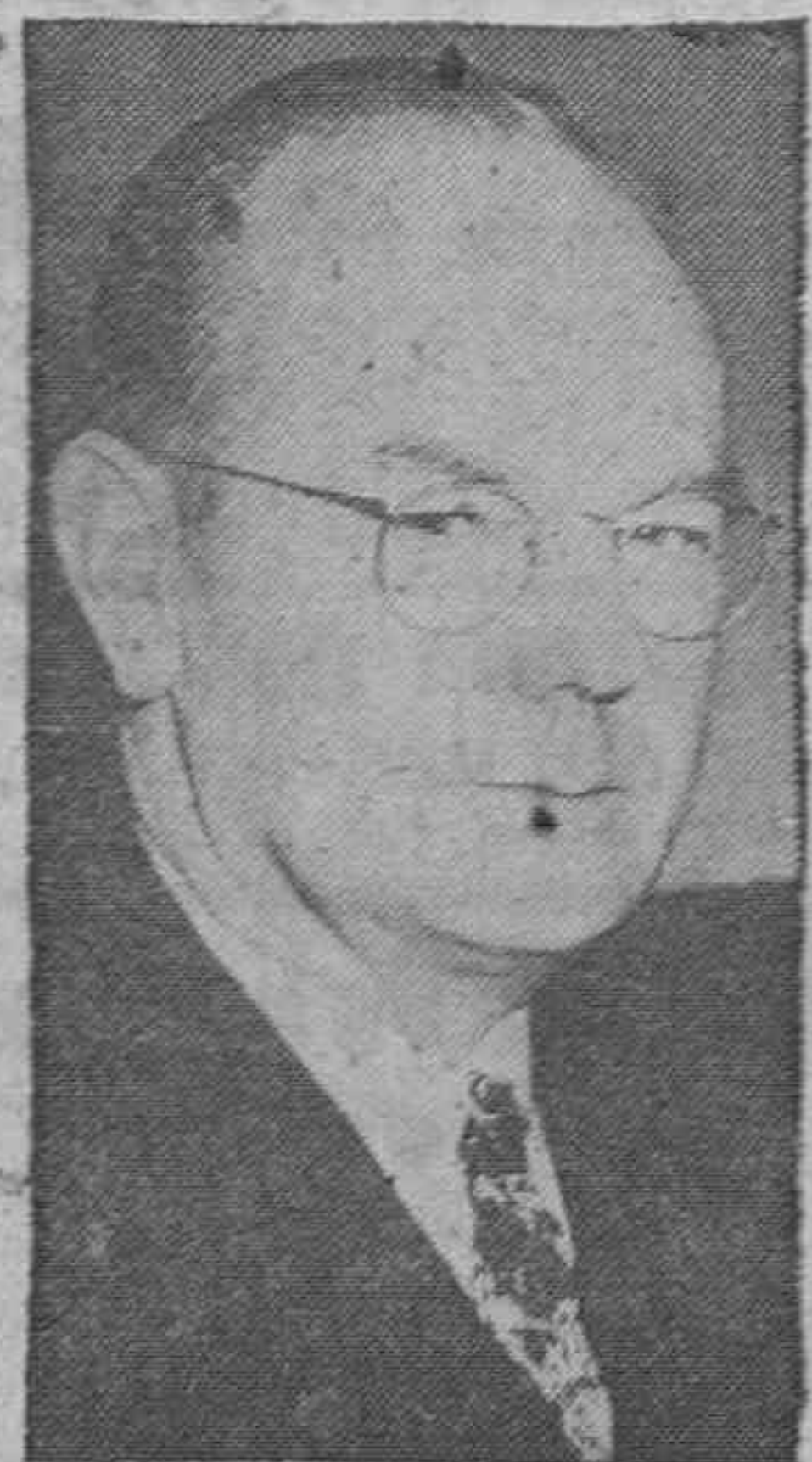
John W. Snyder, que ha sido nombrado Director de Reconstrucción de Guerra por el Presidente Truman.

tarea principal de la Conferencia de Ministros de Asuntos Exteriores celebrada en Londres había sido la de consolidar la victoria y asegurar para el porvenir una paz duradera para todo el mundo.