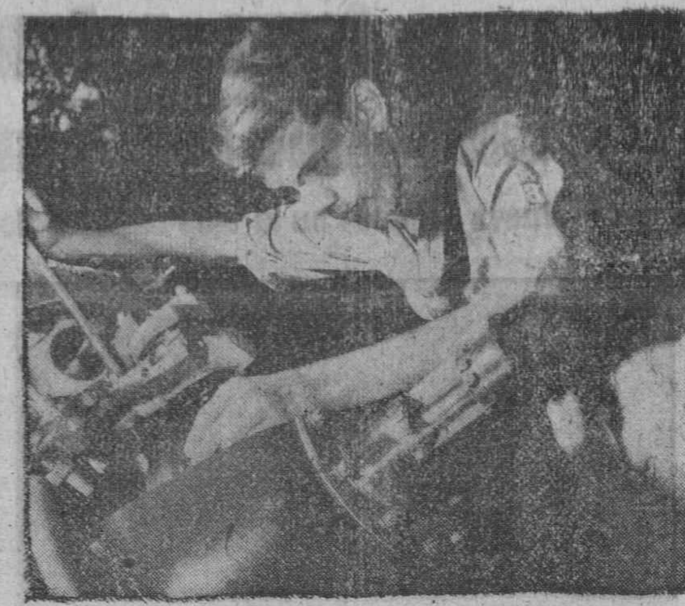
Un explorador estudia el motor.