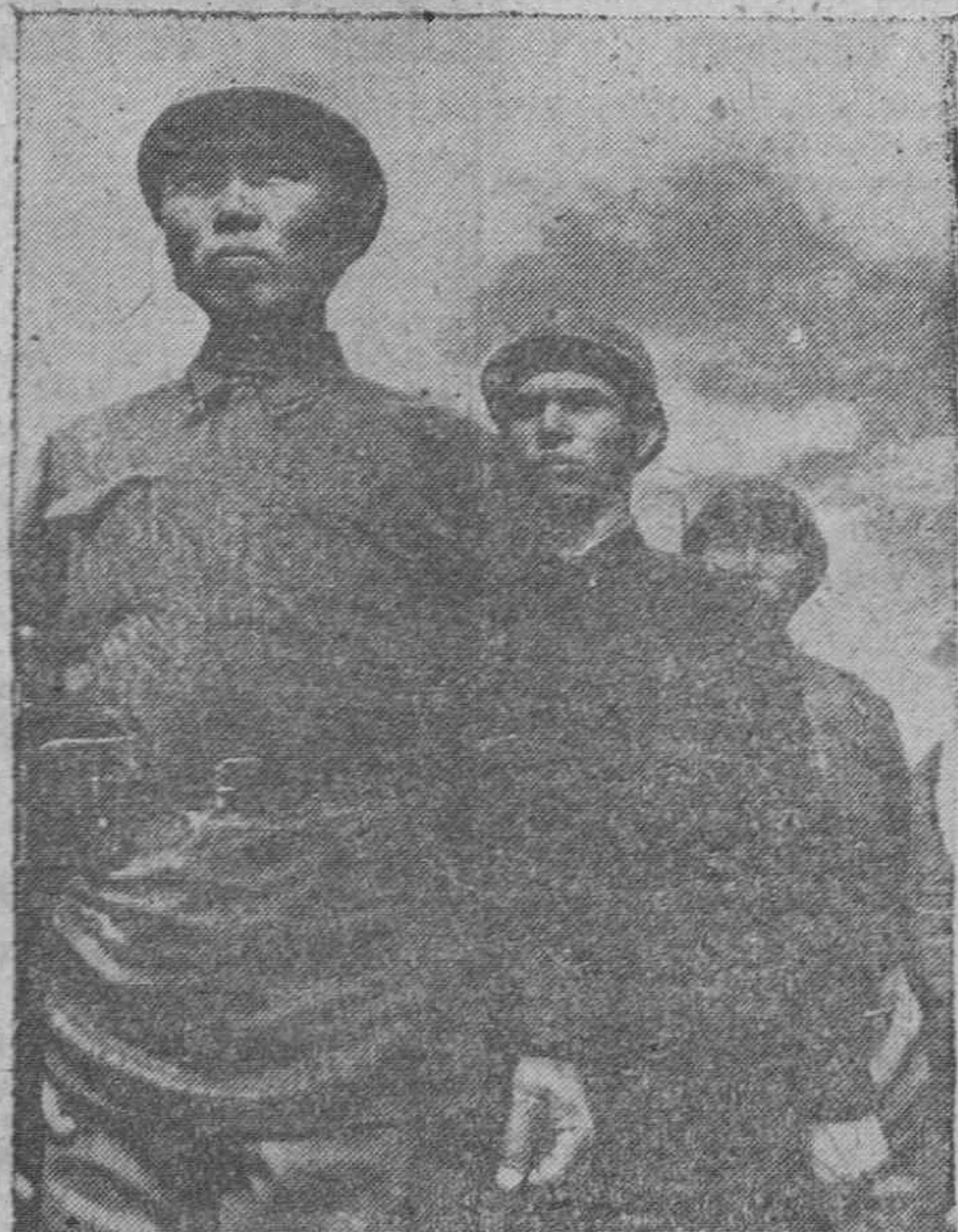
Soldados rusos patrullando en la frontera de Manchuria y la Unión Soviética.