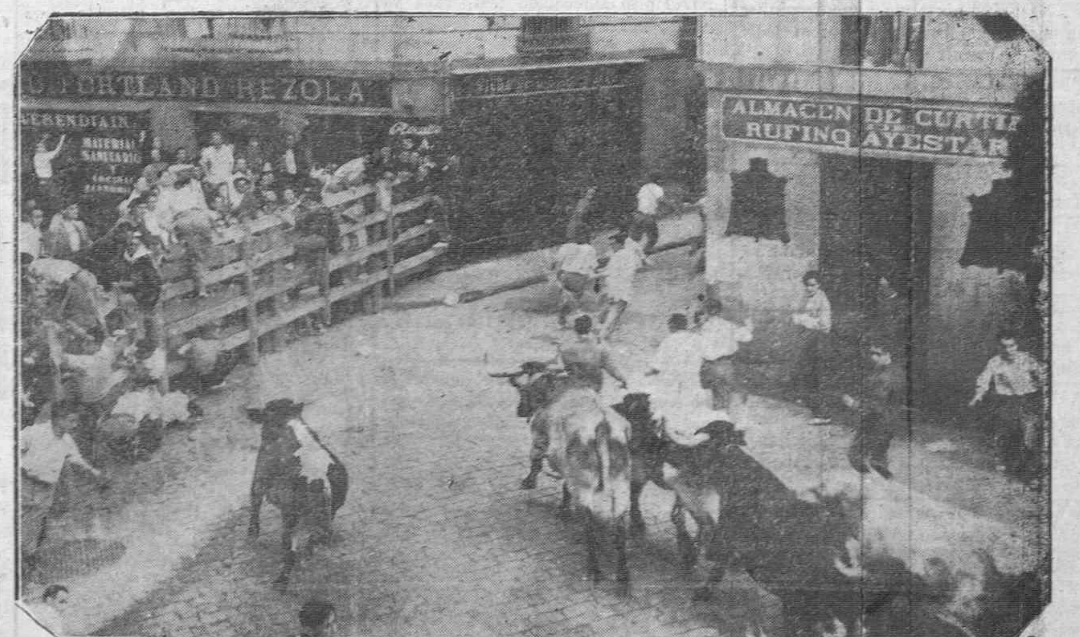
Uno de los detalles del clásico encierro de los toros que se lidian en las corridas de San Fermín en la ciudad de Pamplona, en espectáculo lleno de alegría y de humor.