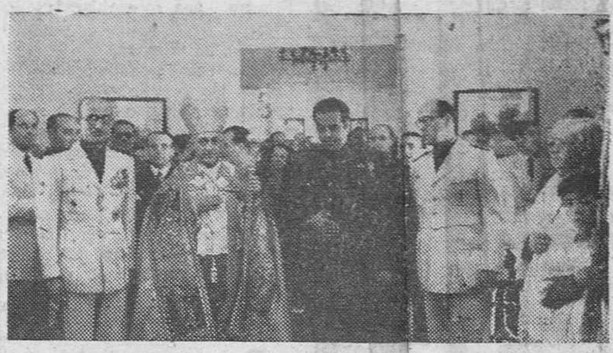
El Ministro de Trabajo camarada Girón inaugura los locales de un nuevo establecimiento del Instituto Nacional de Previsión que fueron bendecidos por el Obispo de Madrid-Alcalá, Doctor Elio y Garay.