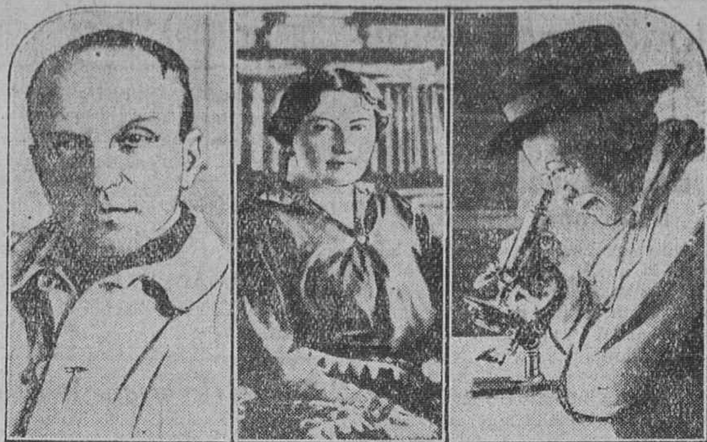
EL PREMIO NOBEL DE 1929

De izquierda a derecha: el profesor Heinrich Wieland, de Munich, premio de física. Mms. Sigrid Undet, por la literatura y el profesor Charles Nicolle, por la medicina.