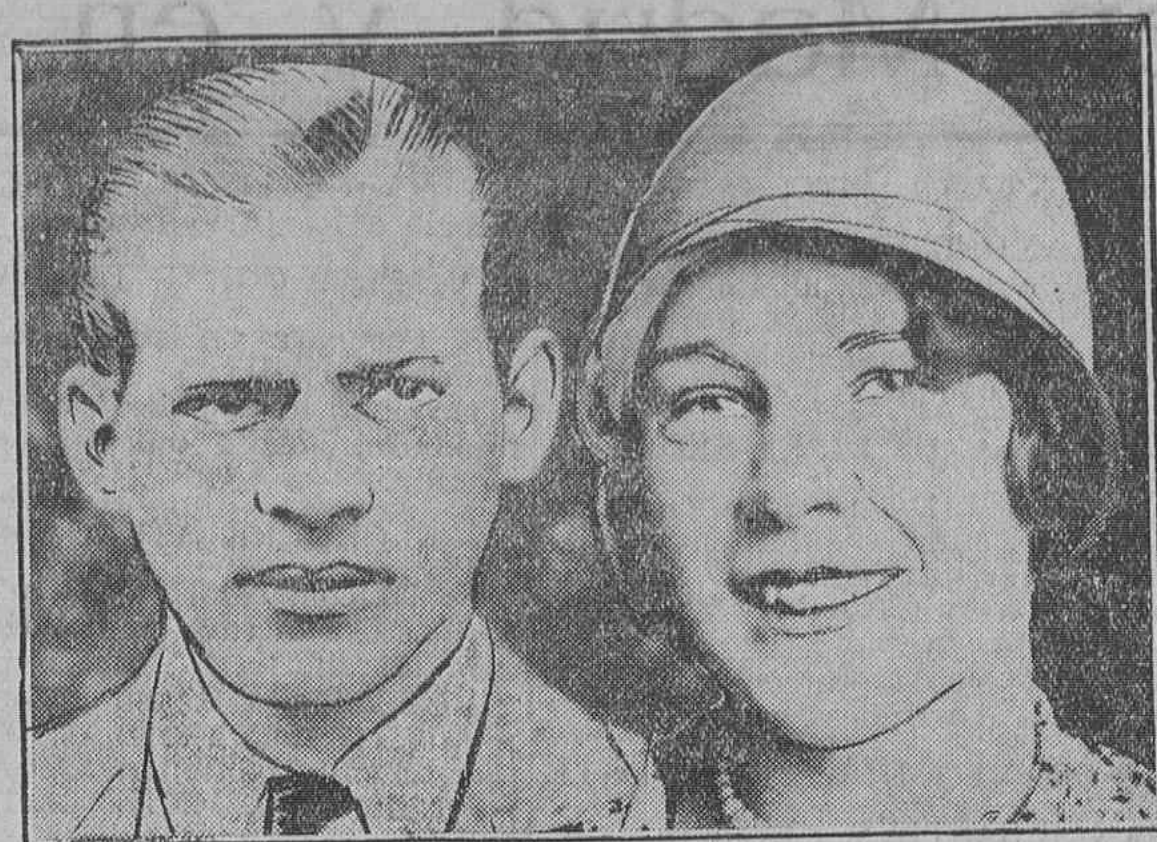
EL MATRIMONIO DE UN HIJO DE CALVINO COOLIDGE John Coolidge, hijo del Presidente de los Estados Unidos, va a contraer matrimonio con la señorita Florencia Trumbull, hija del gobernador del Estado de Connecticut.

¡Quién no querrá tomar parte en esa manifestación de un pueblo fuerte, sano, que resurge con la lozanía de la juventud, con el ansia de todos los progresos y perfeccionamientos y que cuenta, además, con el pingüe patrimonio de las hermosas tradiciones y de las glorias imperecederas que canta su nobilísima Historia! En ese acto tendrán lugar preferente las madres españolas, que ofrecerán el más preciado de los dones: su júbilo por la terminación de aquel horrendo martirio de Marruecos, que tanto tiempo sufrieron con valor y resignación admirables. España necesita y quiere que todos los ciudadanos formen en esa grandiosa manifestación que será presenciada por los niños. Ayer contemplabais a nuestra madre Patria con todas las glorias y virtudes que la enaltecen, pero agobiada a fuerza de escarmentos y amargos desengaños por los dolores del infortunio. Hoy la veis caminar esperanzada, en ruta de bellas realidades, hacia los altos fines trazados por la Provincia. No frustréis, españoles, este noble signo. Dejad a vuestros hijos una España digna de su tiempo, bajo el nimbo de sus glorias históricas. Españolas y españoles: por gratitud y confianza, y sobre todo por amor a España y para el prestigio de España, acudid a la manifestación del día 13 de septiembre.