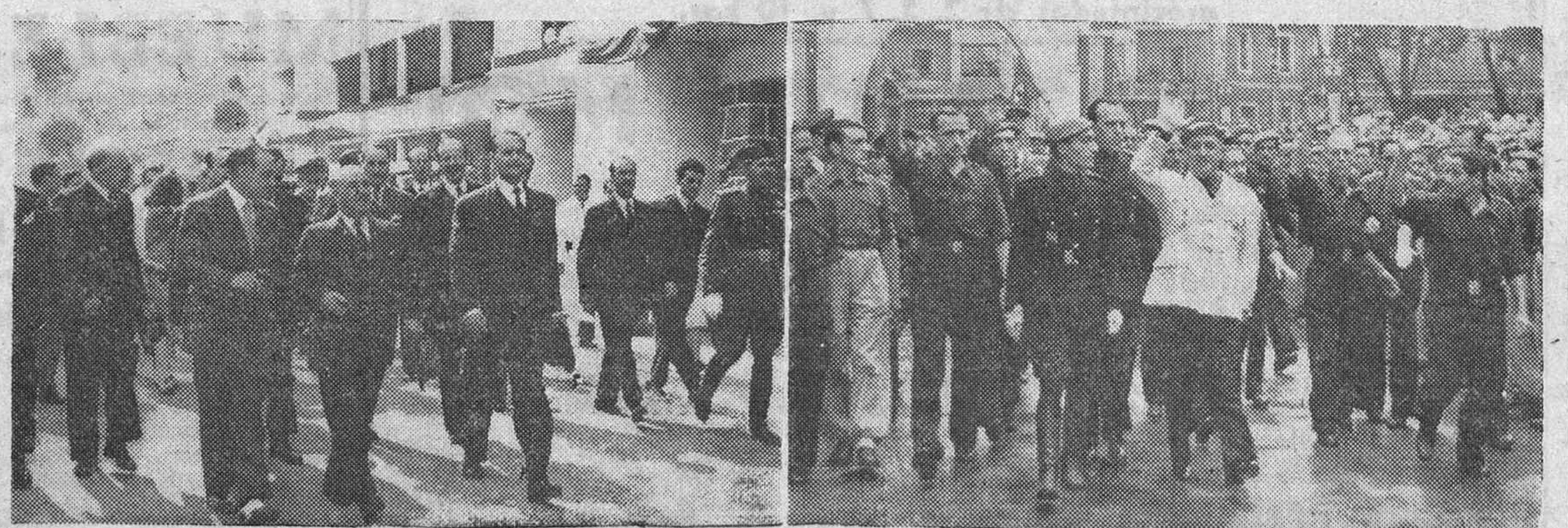
EL GENERALISIMO INAUGURA EL SANATORIO ANTITUBERCULOSO QUE LLEVA SU NOMBRE Y RECIBE LA ADHESION DE LA POBLACION DE BARACALDO A SU PASO POR LAS CALLES DE LA MISMA.