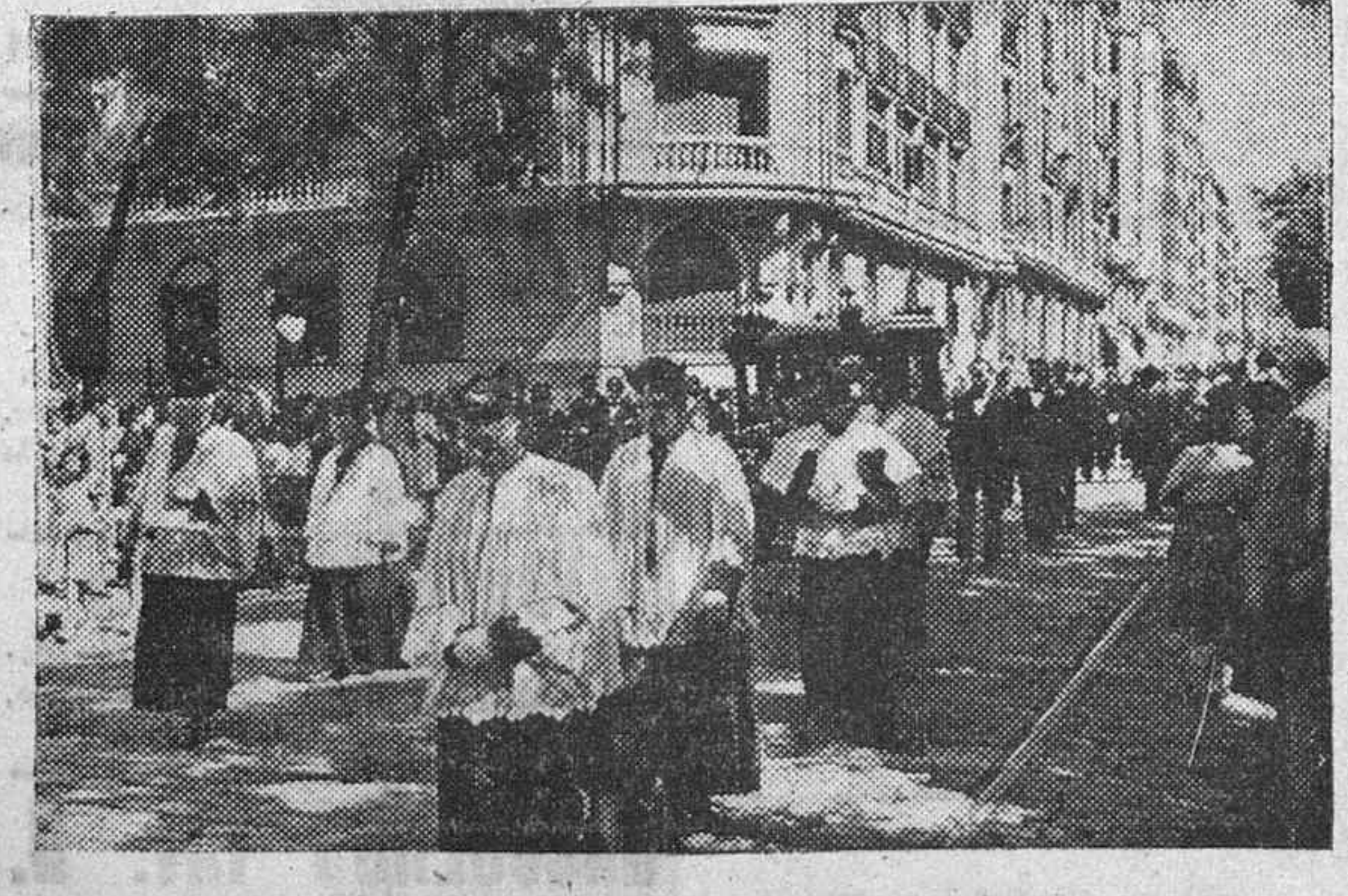
La carroza fúnebre con los restos del señor Alvarez Quintero desfilaba por la calle de Velázquez y un inmenso gentío se agolpó en el trayecto para respetuosamente el afecto al comediógrafo muerto.