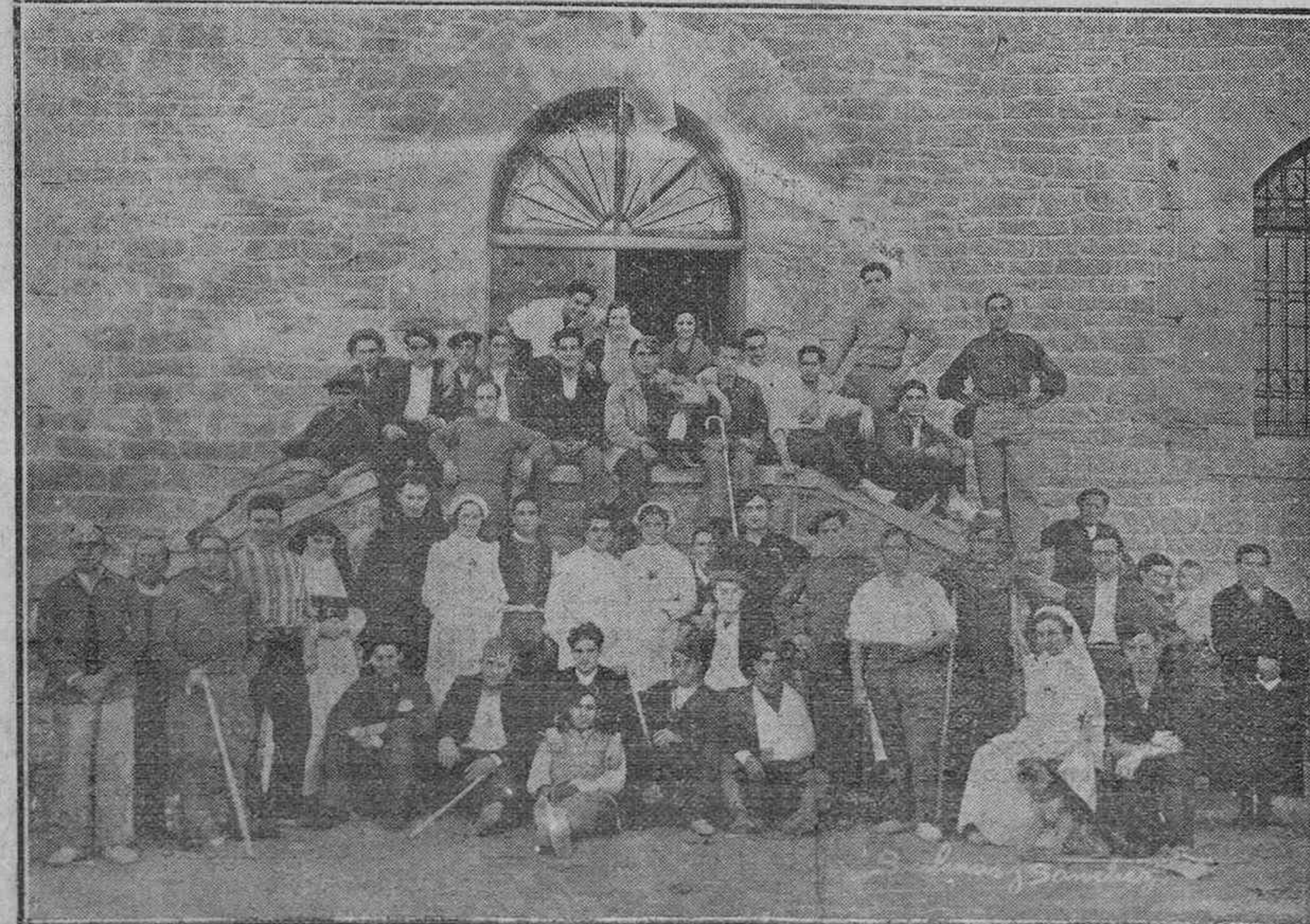
Médicos y practicantes... Religiosos y enfermeras... Voluntarios de la bata blanca y de la roja cruz que habla de caridad... La Legión Blanca, dirigida en Vitoria por doctor tan competente como lo es el señor Agte, presta inmejorables servicios. Al reproducir estas fotografías de Salinas y Sánchez, rendimos homenaje a esa Cruz Roja nuestra cuyos desvelos en su delicada misión deben ser subrayados con elogios bien merecidos.