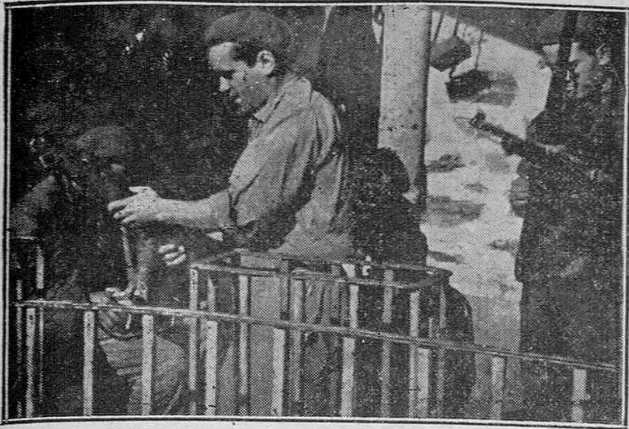
Estampas del frente.— Los requetés limpiando el armamento.