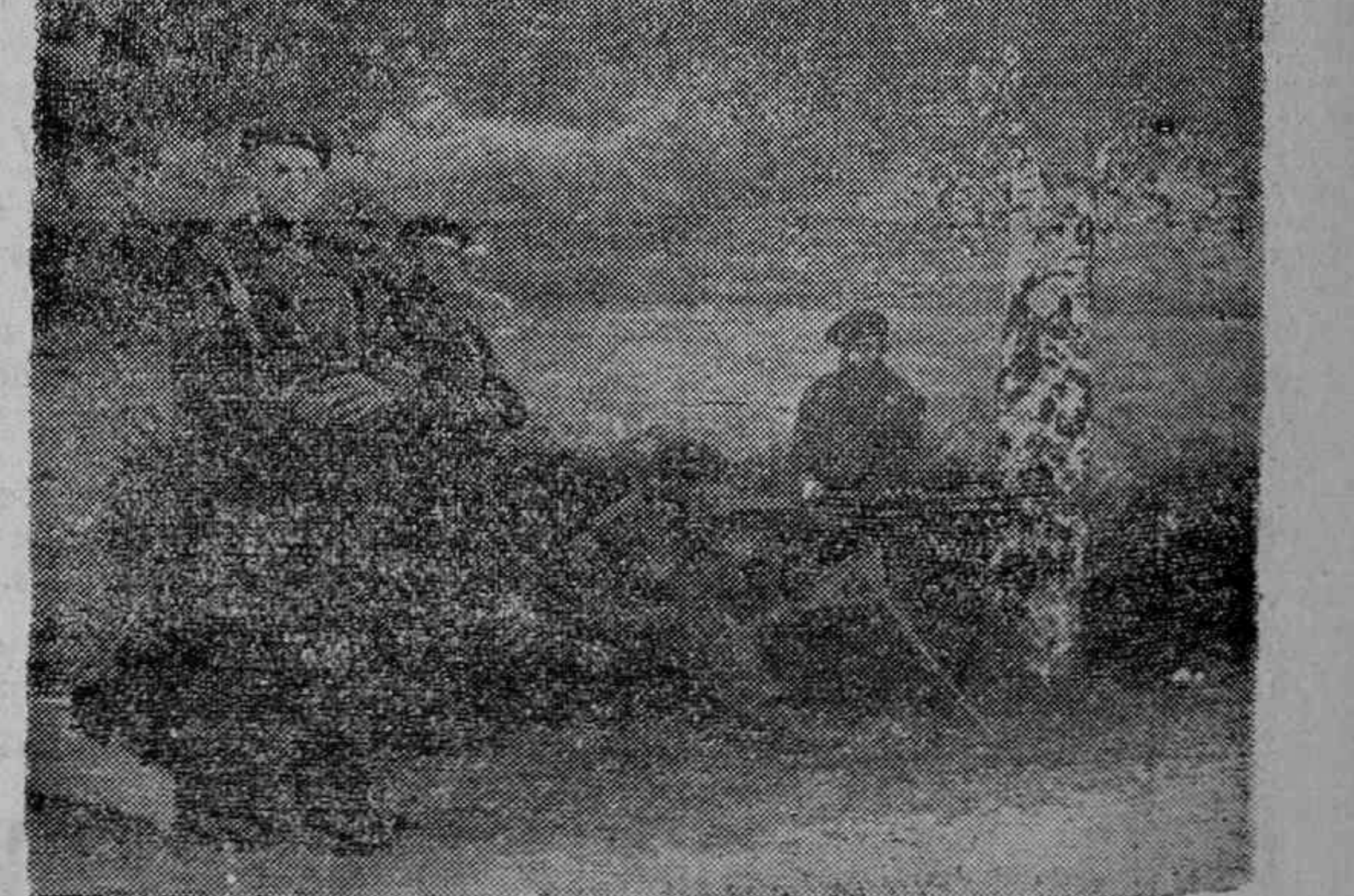
Una ametralladora servida por los guardias civiles de Vitoria