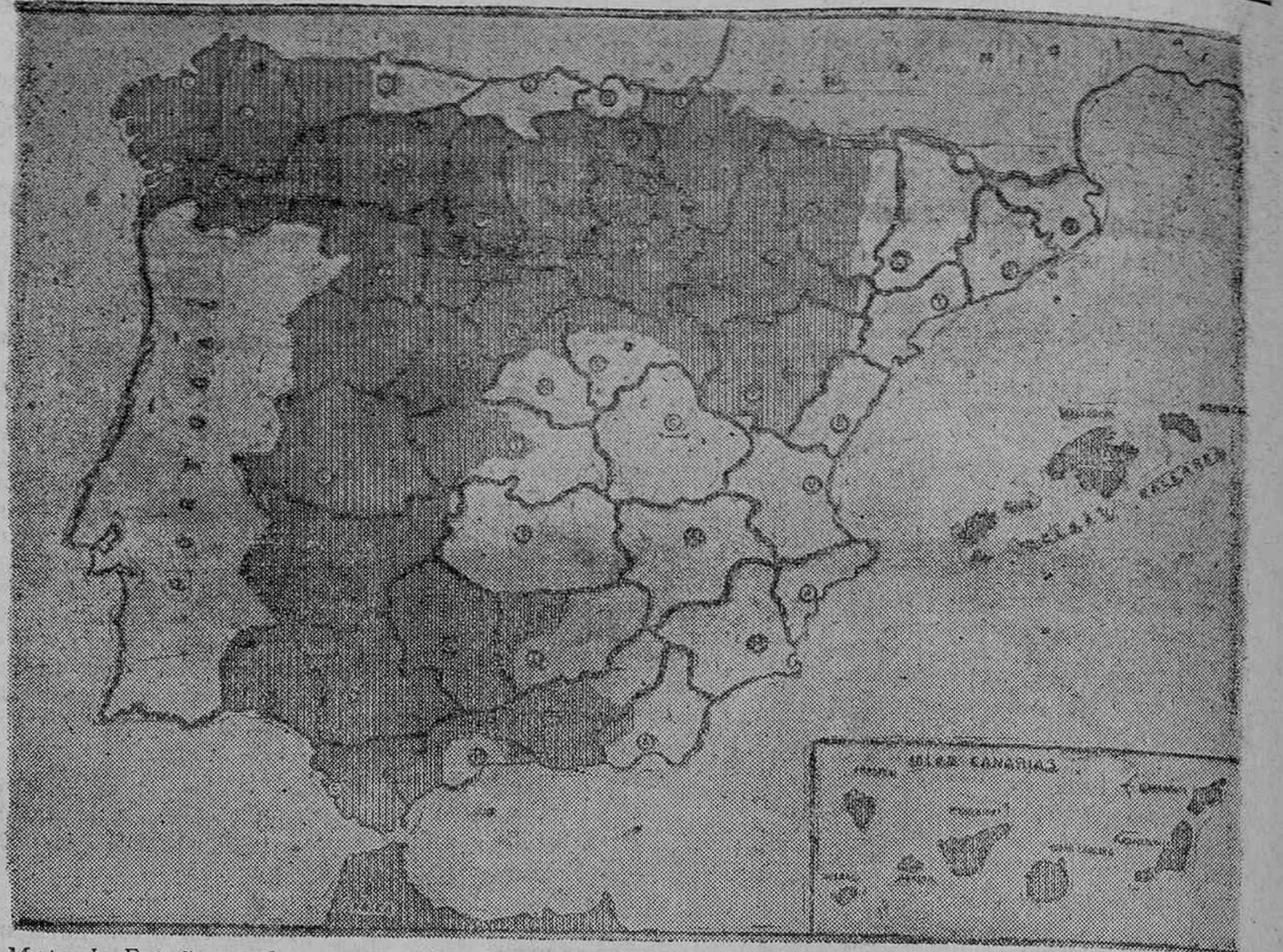
Mapa de España en el que se señala con un rayado vertical la extensa zona del territorio nacional ocupada por las fuerzas que efectúan el movimiento salvador de España

—¡Y el reloj del padre Prior? —Te lo doy si lo quieres, aunque es un recuerdo. Todavía está parado en la hora que me lo dió, Miralo; ¡plata maciza. Se le cayó cuando detuvimos a los frailes, y se le rompió una manecilla. Yo se lo devolvía, pero me lo regaló: "Guárdalo, hijo, guárdalo como recuerdo." Ya habíamos hablado bastante, y quise despedirme de los pistoleros por no oírles estas conversaciones, pero Campón tuvo empeño en que viera su automóvil de líneas aerodinámicas, que había sido de Romanones. Aproveché la ocasión para hacer a Campón unas fotos con su secretario, pero procuré que nunca ya volviera a encontrarme. No es más que un tipo grotesco, pero daba un poco de repugnancia oírle hablar.