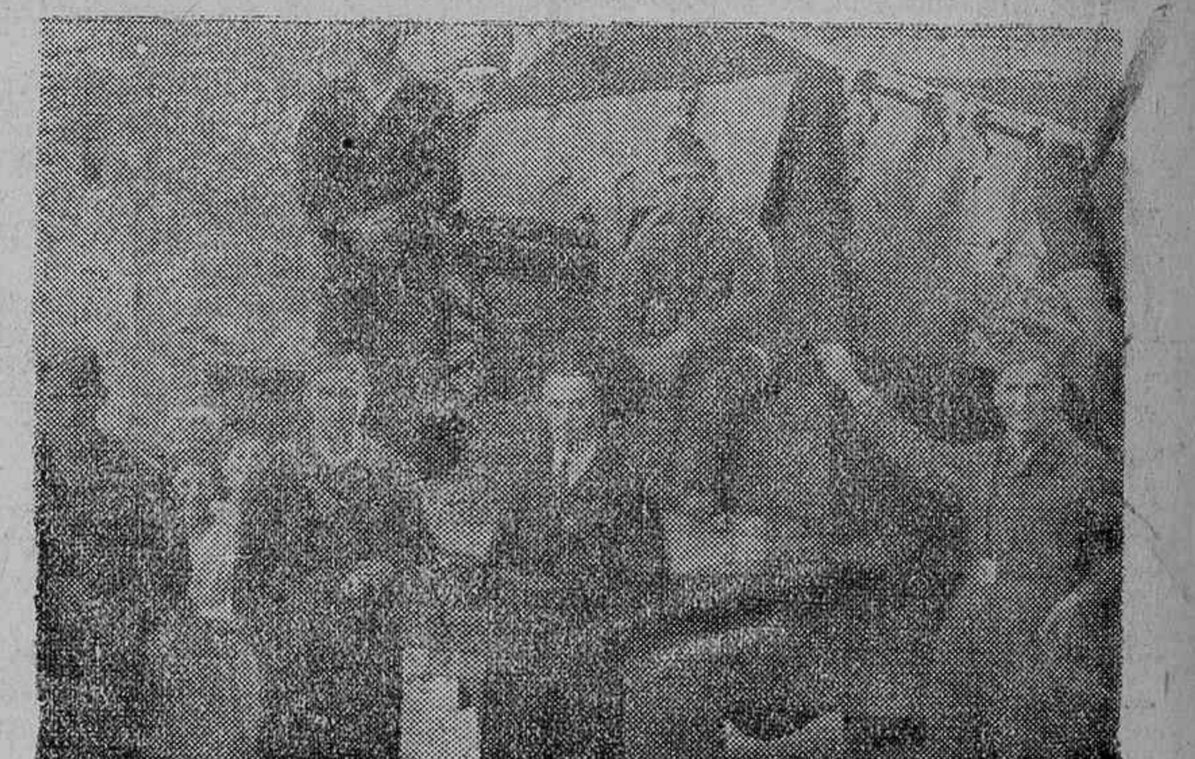
El anticarro servido por artilleros vitorianos en la carretera de Elorrio

Sexto. Las herencias, mandas y legados, funerales, sufragios, capellanías y demás obras pías en sufragio del alma del testador estarán exentas hasta la cantidad de dos mil pesetas. También lo estarán, aunque pasen de esta cifra, siempre que no exceda del 5 por 100 de la herencia total. En los demás casos pagará con sujeción a la tarifa II unida al Reglamento. Estas disposiciones, por lo mismo que afectan a numerosas personas y entidades y vienen a modificar las que regían en los tiempos de laicismo, deben ser muy tenidas en cuenta y por eso contribuimos a su divulgación. Un pobre diablo.