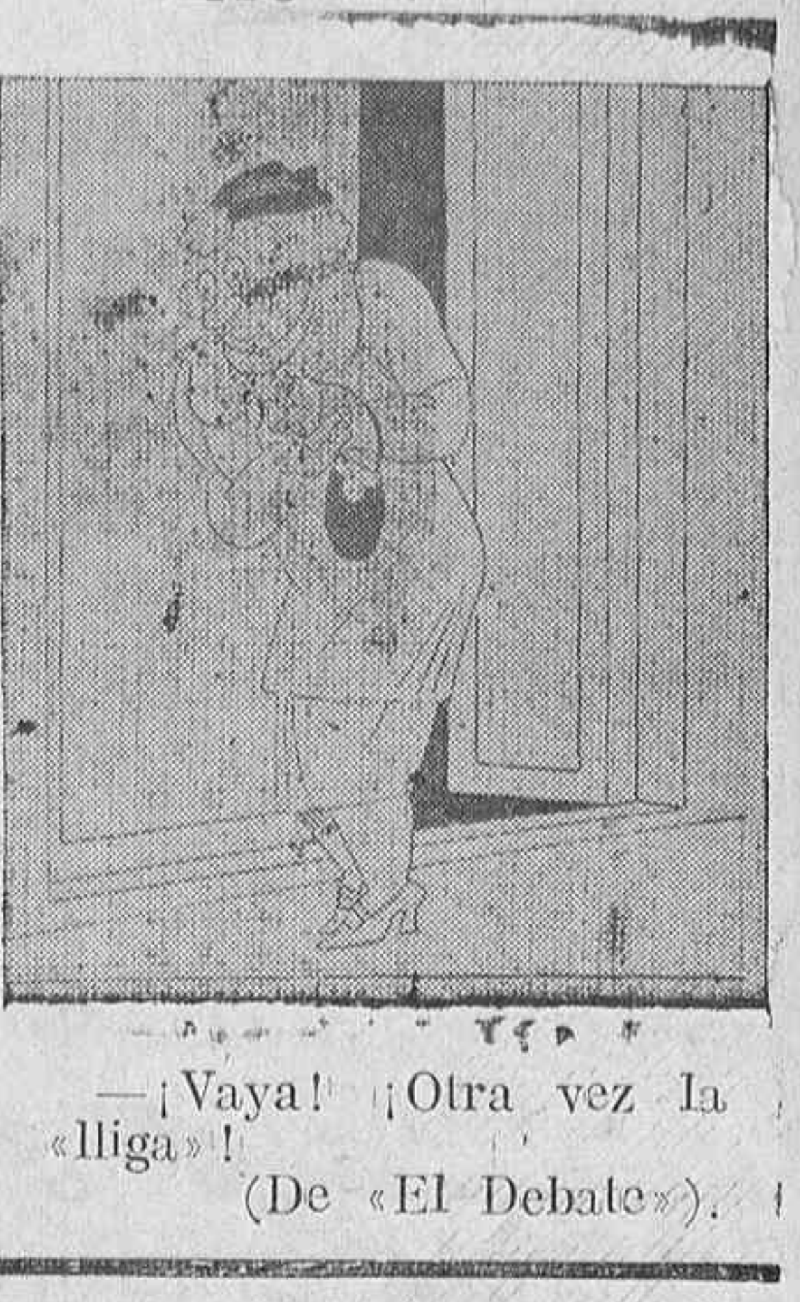
—¡Vaya! ¡Otra vez la «liga»! (De «El Debate»).

La caricatura nacional al día CHISMES MOLESTOS, por K-HITO