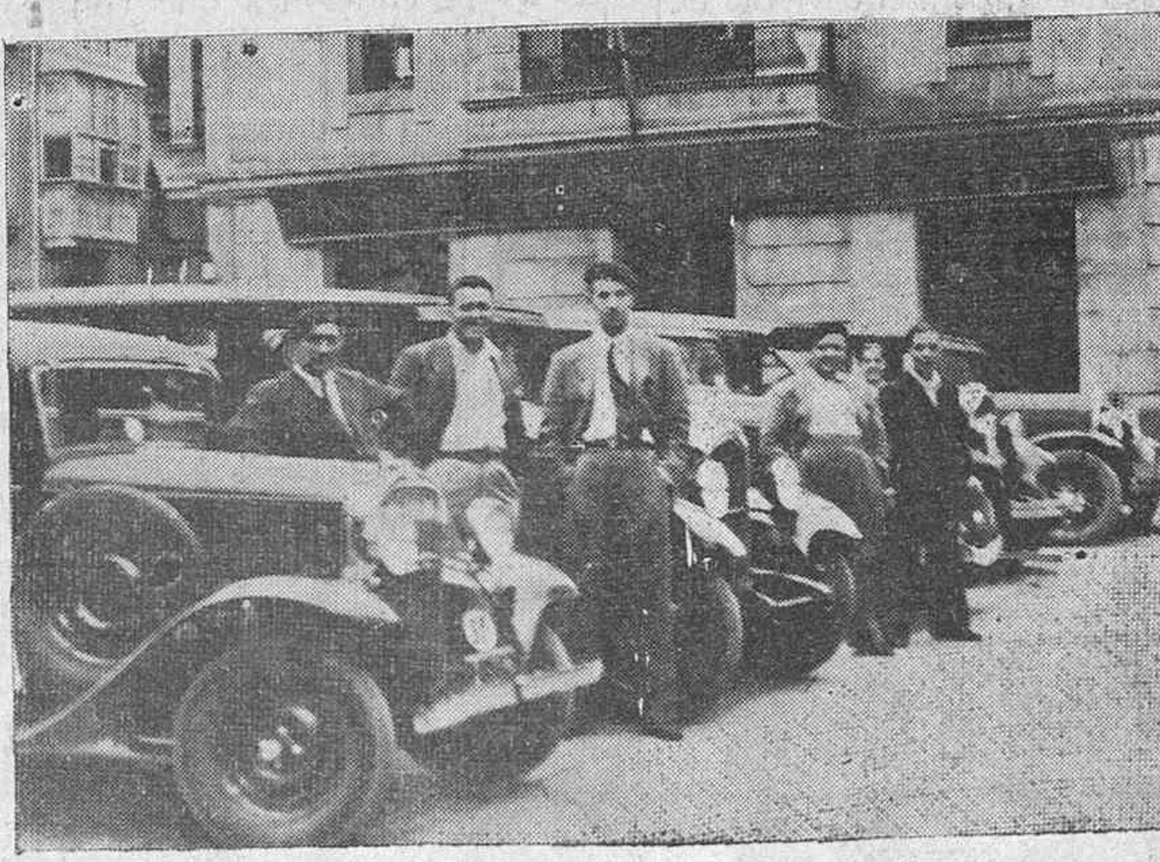
He aquí un grupo de simpáticos taxistas vitorianos, aguardando al cliente que no llega.