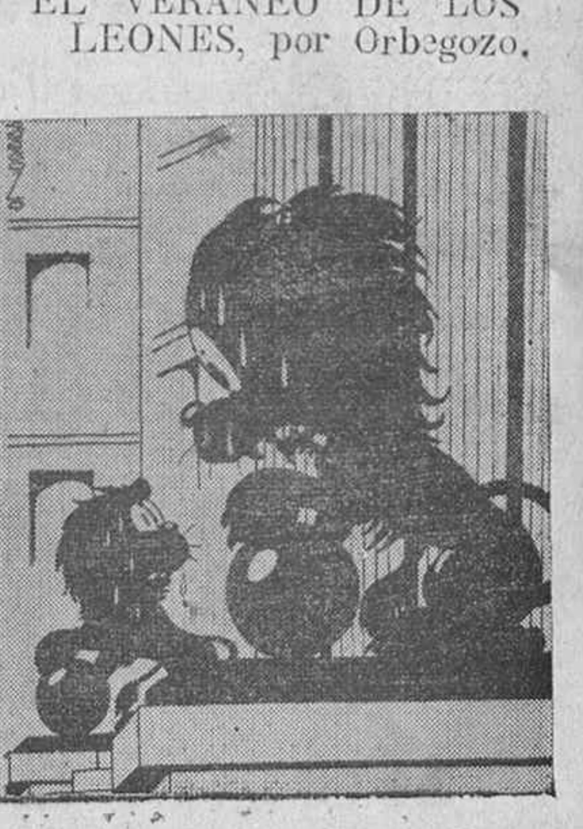
EL VERANO DE LOS LEONES, por Orbezo. —Pues chico, a mí lo mismo me da lo de las vacaciones. Porque para ir a pasar calor al desierto, bien está uno en éste. (De «Ya»).

«El día en que los ricos, y aun los hombres de mediana fortuna, se convencen de que tienen la obligación sagrada de dar buena parte de sus caudales al periódico católico, habrán dado el primer paso para defender con eficacia la sociedad amenazada y sus propios intereses materiales, en gravísimo peligro. Sin dinero no hay Prensa. Sin Prensa quedáis a merced de un enemigo cruel que sólo sueña en desposeeros de todo y en haceros víctimas de su odio implacable.»