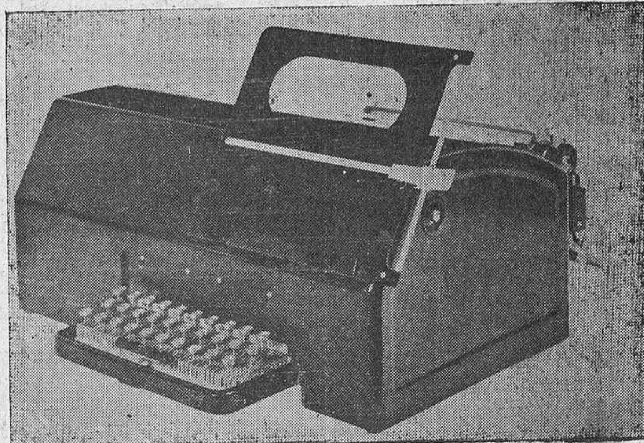
Un aspecto parcial del Teletipo que muy pronto funcionará en PENSAMIENTO ALAVES.

En marcha ya nuestro Taller de Fotografado, que nos permite publicar a diario varias fotografías de la actualidad local, nacional y