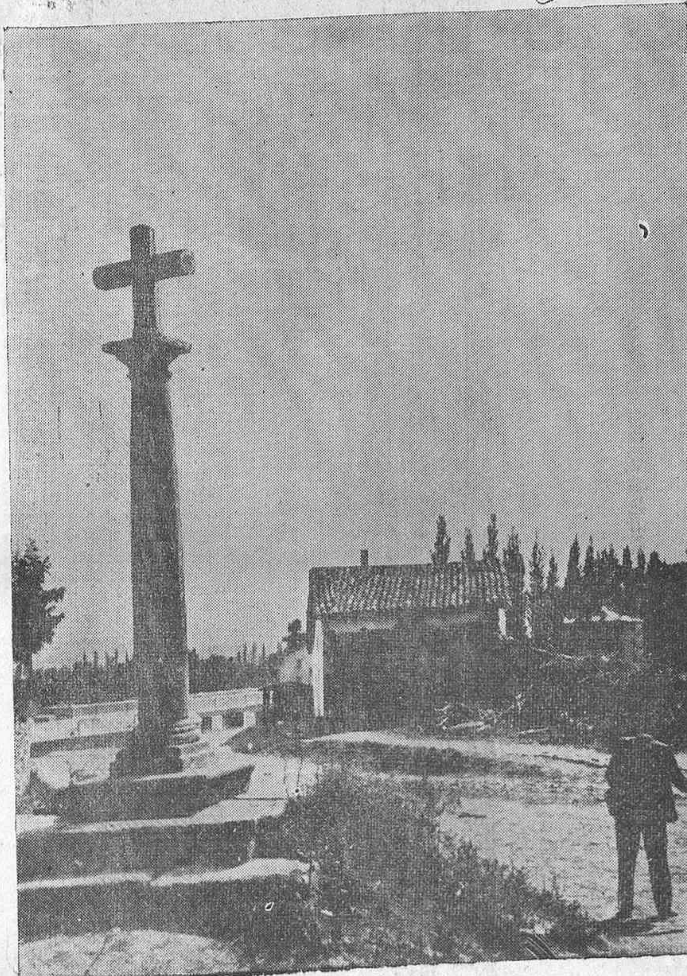
Vetusta Cruz de piedra, existente en Gamarra.