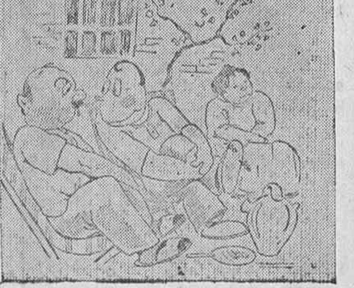
TOMANDO EL FRESCO, por «Esme». —Oye, ese señor Royo Villanova que tantas cosas nos «pedricaba» de Azahar, ¿no será éste, verdad? —¡Qué!, aquél era sólo «deputao», y éste es «tooo» un «menistro»! (De «El Siglo Futuro»).