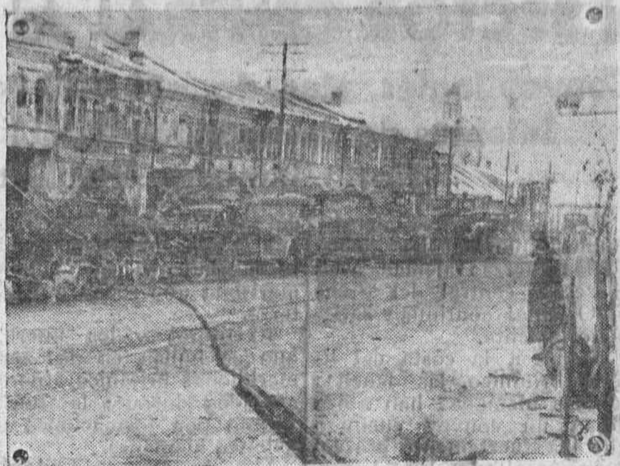
Del avance sobre Moscú. La ciudad de Viasma, que después de violentos combates fue conquistada por las fuerzas alemanas, ha sido dejada ya muy atrás por las vanguardias que avanzan sobre Moscú. Ahora grandes columnas de refuerzo pasan constantemente por la ciudad hacia las primeras líneas.

Se justifica la Ordenanza dictada en que la depuración que había adquirido categoría de remedio necesario e inaplazable para que la Comunidad Política mantuviera la dignidad y confianza de que debe estar asistida, es ahora más urgente y precisa, en que por consecuencia de una guerra internacional se ve Falange Española Tradicionalista y de las JONS en trance de rendir su máxima tarea oponiendo su esfuerzo, no sólo a todo cuanto signifique signo exterior contrario a nuestros designios, sino también en todo cuanto de la conflagración exterior derive en obstáculo para la existencia y desarrollo del Movimiento Nacional Sindicalista. — (Cifra).