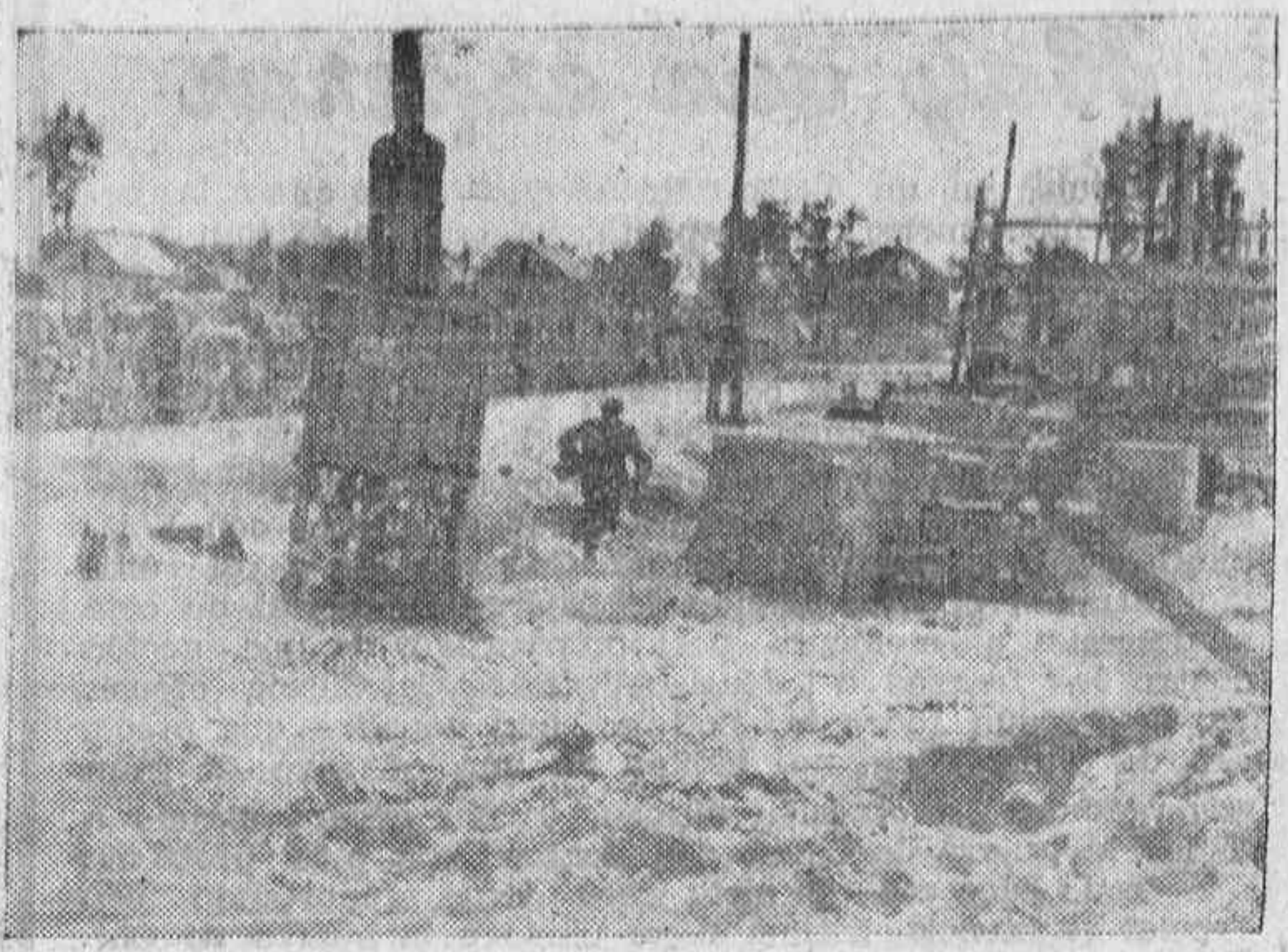
Del avance sobre Moscú.—A pesar de la fuerte oposición de la artillería enemiga, tropas de asalto alemanas toman casa por casa una ciudad rusa.

Anunció además el secretario de la Comisaría de Abastecimientos que la Comisaría tiene en estudio el establecimiento de cartillas individuales y un régimen de comida en restaurantes y tabernas por sistema de cupones. Sobre el problema de la leche, dijo también el señor Leyva que esperaba se le encontrara una solución para normalizar el mercado.—Cifra.