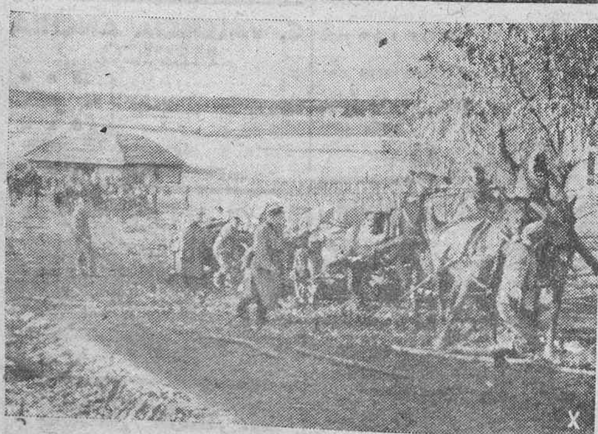
El mal estado del terreno en muchos lugares de Rusia, obliga al soldado y al caballo a hacer su máximo esfuerzo para proseguir el avance. La foto nos muestra un carro de municionamiento pasando por un a región inundada del sur.