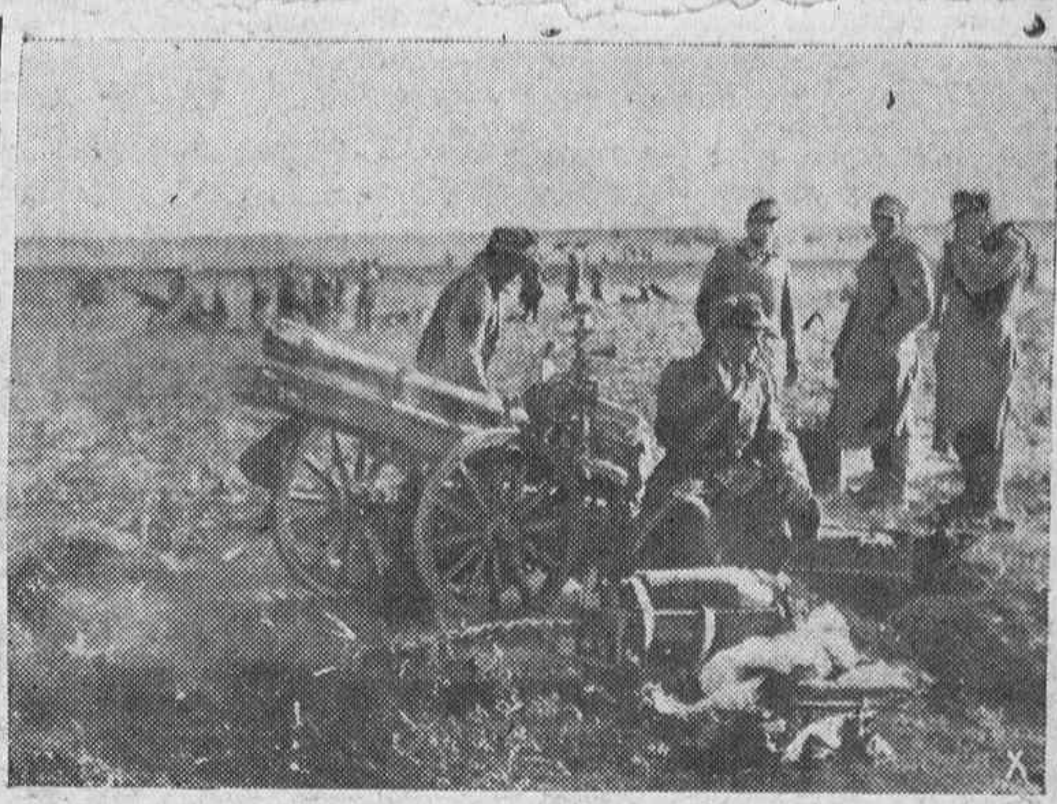
ARTILLERIA LIGERA ALEMANA DE MONTAÑA, CERCA DE CRIMEA