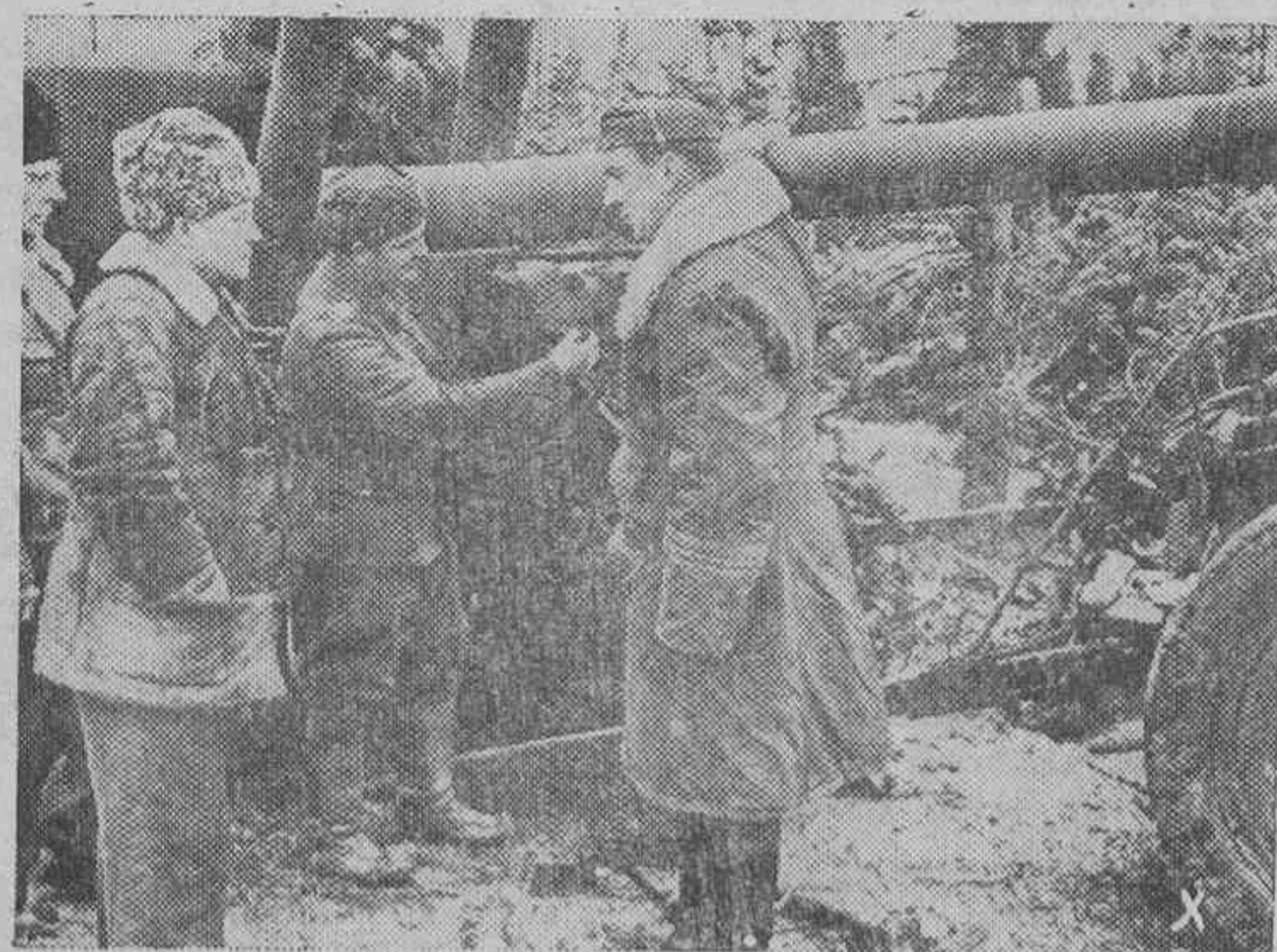
Un jefe finlandés examinando un cañón capturado por sus tropas a los soviets.

Berlín.—Actualmente trabajan en Alemania un total de unos dos millones y medio de obreros extranjeros. El primer puesto por el número corresponde a los polacos con más de un millón de obreros siguiendo los italianos con 300.000, los holandeses con 96.000, los serbios con 78.000, los franceses con 63.000, los croatas con 56.000, los eslovacos con 54.000 y los húngaros con 31.000.—(C. E.)