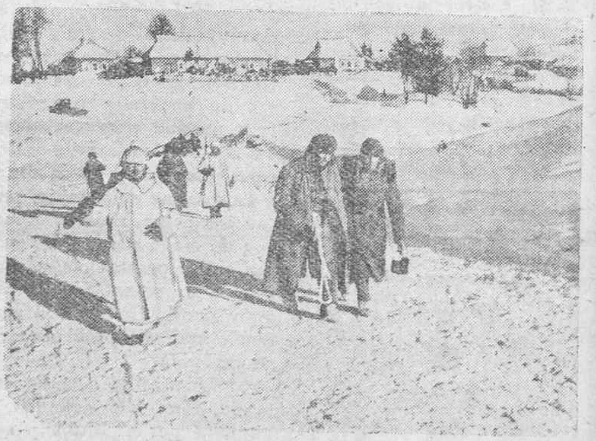
Algunos de los bolcheviques capturados en un intento enemigo de ocupar la aldea que se ve al fondo;

narios en activo pertenecientes a los Cuerpos de ingenieros industriales y de profesores mercantiles al servicio de la Hacienda pública, afectos a la inspección de los tributos no podrán ejercer la profesión mercantil por sí ni por otro sin desempeñar los indicados cargos en las empresas o entidades sujetas a tributación al Estado por contribución industrial o de utilidades ni ser socios de compañías en que el capital social no esté representado por acciones.