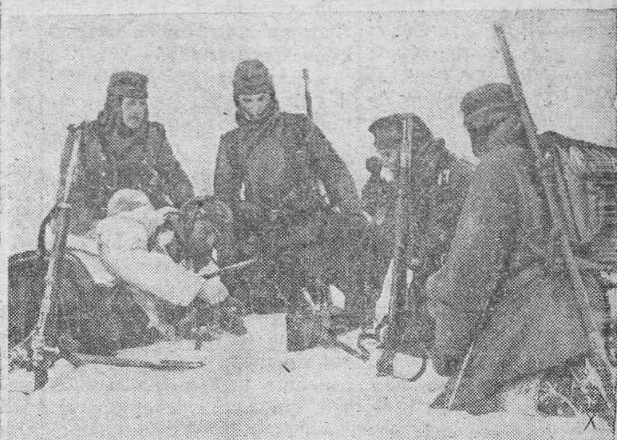
La guerra moderna que lleva consigo una perfecta coordinación entre las distintas operaciones, necesita una compleja red de comunicaciones telefónicas y telegráficas. En la foto vemos una patrulla alemana que realizada su misión se lo comunica al mando superior desde el puesto transmisor más próximo.

Lectores; Haced vuestras compras y solicitad los servicios de los anunciantes de este periódico