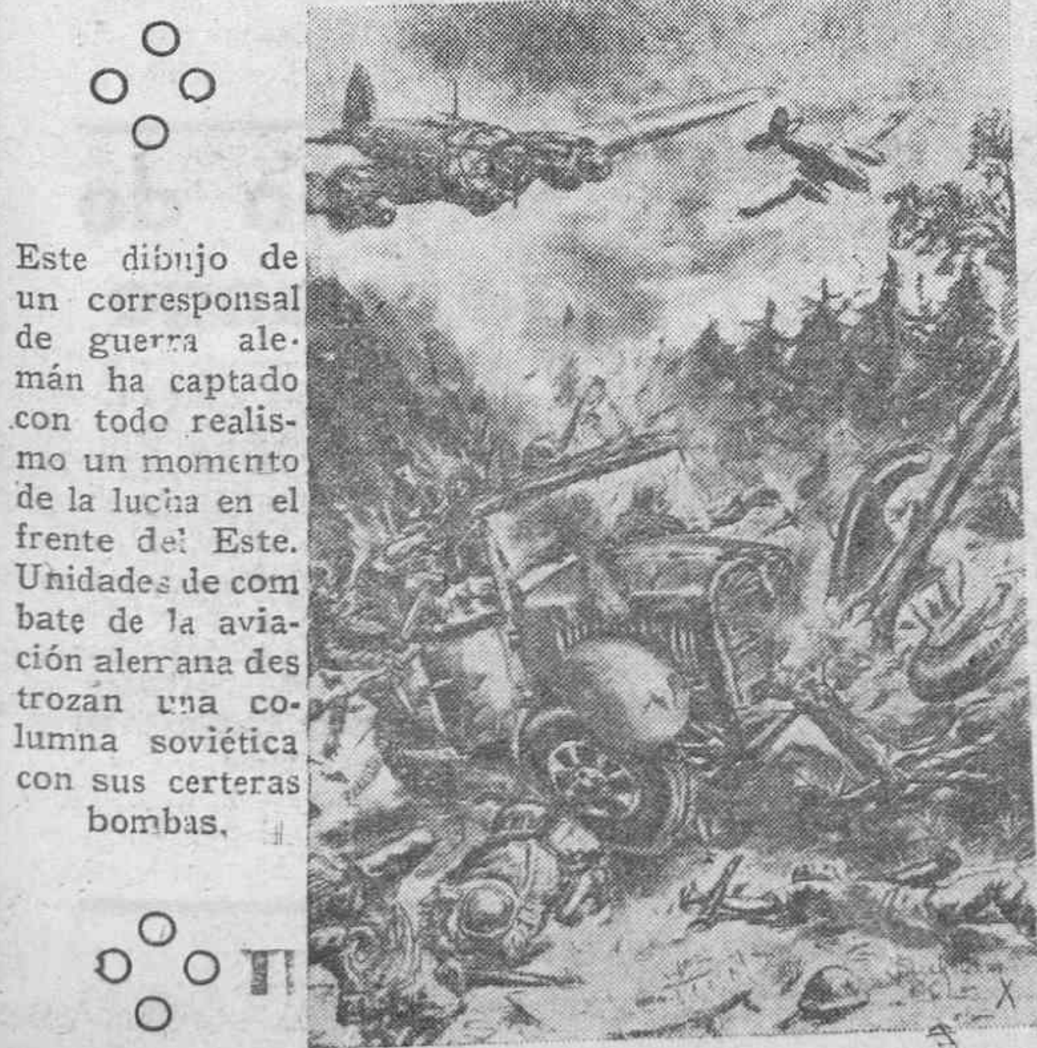
Este dibujo de un corresponsal de guerra alemán ha captado con todo realismo un momento de la lucha en el frente del Este. Unidades de combate de la aviación alerrana des trozan una columna soviética con sus certeras bombas.

Máxima, 26 grados en Alicante. Mínima, un grado en Purgos.