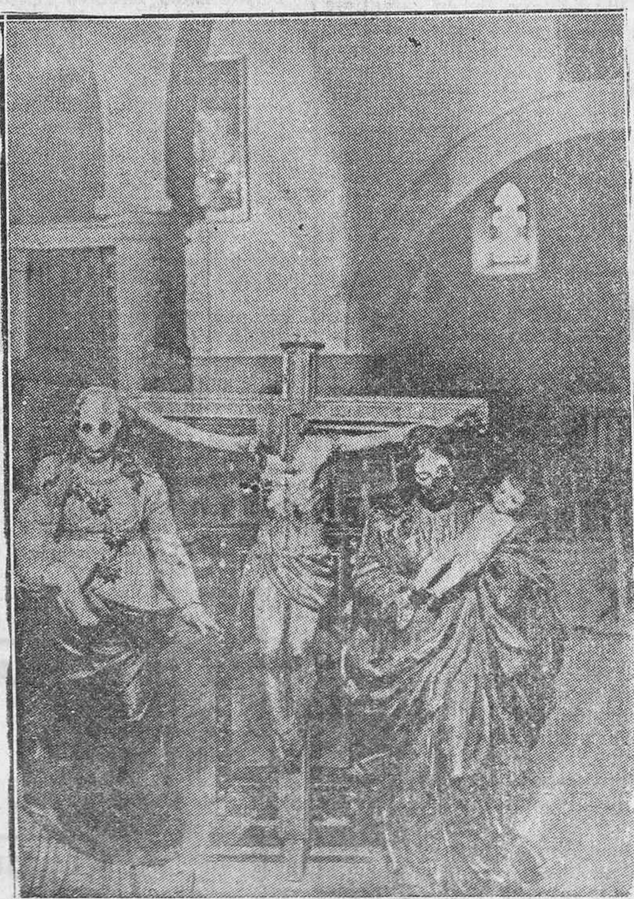
Calera y Chozas (Toledo).—Imágenes destrozadas por los marxistas en la Iglesia Parroquial

tales de provincias de los siguientes puntos: Olivenza, Villaverde, Aguilar del Río, Alhama, Cervera, Tordesillas, Murillo de Cuence, Calugo, Cimayá, Santo Domingo de la Cruzada, Navajún, Falces, Monjina, Arquedas, Baltanás, Villagarciá, Usurbil, Fitero, Zumaya, Dicastillo, Calatayud, Bruniel, Montenegro, Arnedo, Alfaro, Casera, Puente de la Reina, El Cala, etc. Del resto de las milicias Renovación y JAP también se recibieron numerosos telegramas de acatamiento y obediencia y fervorosa adhesión.