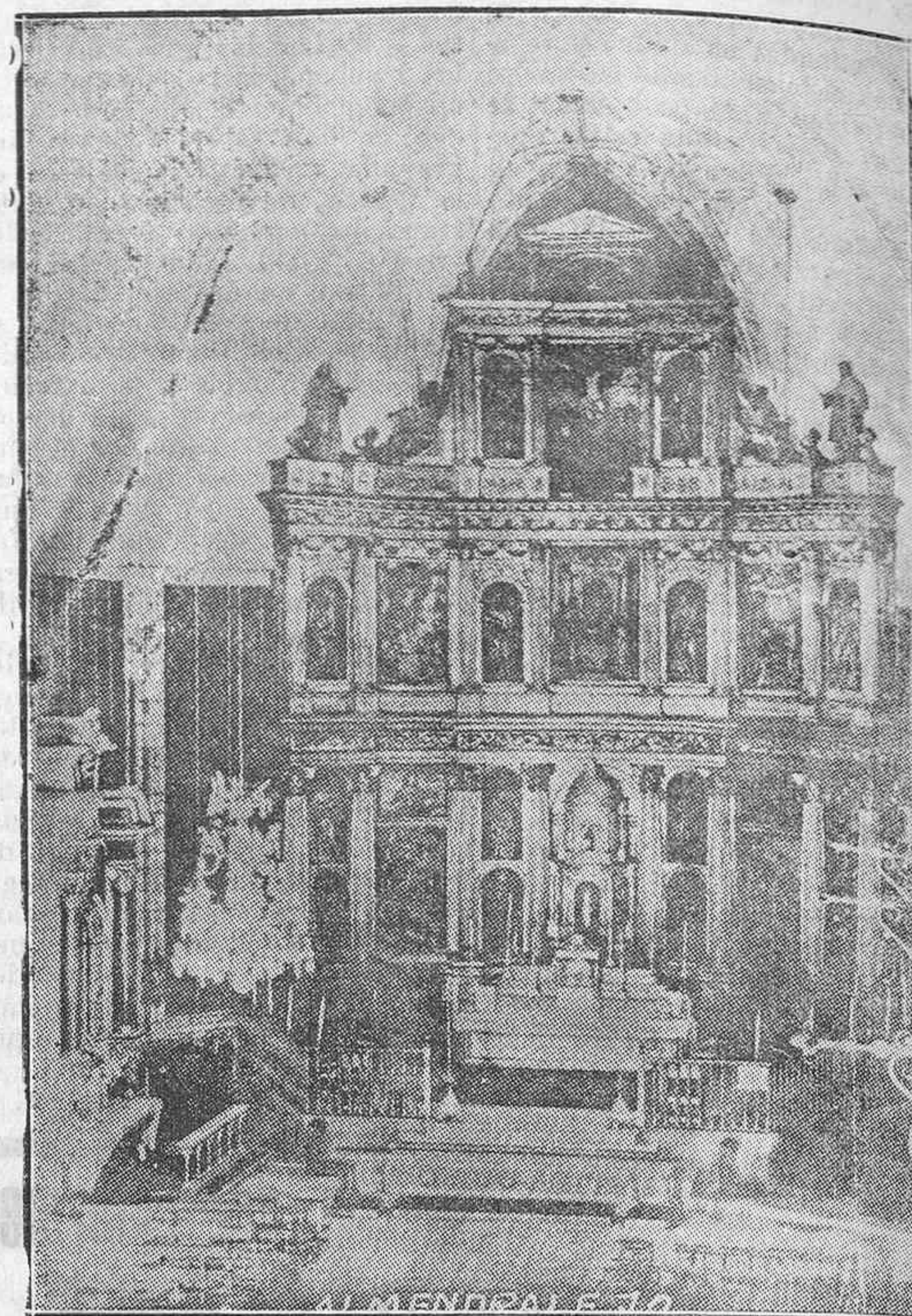
Almendralejo (Badajoz).—Magnífico altar mayor de la Parroquia de la Purificación, en plazado en el ábside de la misma, antes de su incendio por los rojos.

De Requetés se han recibido telegramas, además de las capi-