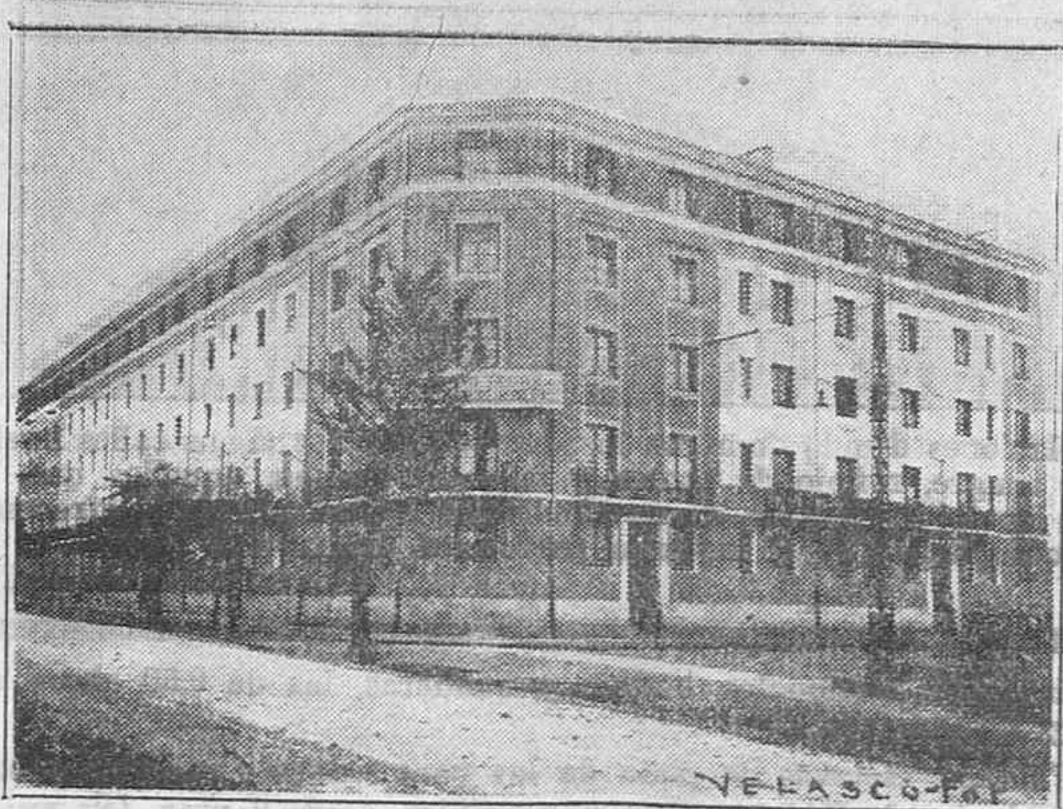
Protección a las clases populares.

Se ruega a todos los individuos pertenecientes a este Requeté Auxiliar, se provean de dos fotografías cada uno, que deberán presentar en las Oficinas de dicho Cuerpo a fin de facilitarles el carnet de identidad.