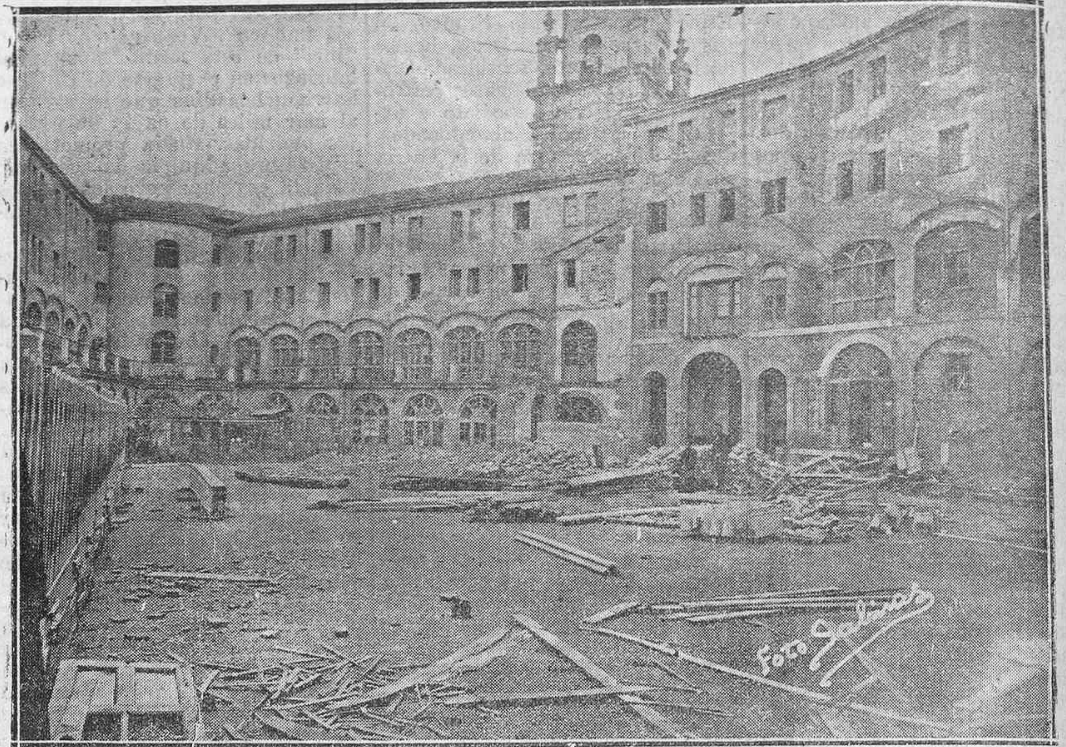
El fotografiado reproduce la amplia perspectiva del gran patio de las viviendas del Seminario que por iniciativa de la Caja de Ahorros Municipal se construyen en esta zona obrera y que constituye un verdadero pulmón, por el que respiran aire puro las nuevas construcciones.

Un paseo por esos rincones vitorianos, en los que la ciudad duerme en calma y soledad, nos sitúa en la plazoleta, donde nuestra Antigua Colegiata yergue su robusta arquitectura como gigante vigia de la población. Regresamos del campo un tanto fortalecidos y animosos y hemos escogido el camino solitario, donde cada casa y cada piedra nos traen recuerdos de la vida pasada, que a nosotros nos sueñan como nunca llena de armonías. La sobria fachada del "Seminario de Aguirre", nos hace reparar en este edificio que también tuvo su historia ya que fué hace dos siglos, sede de la gloriosa "Sociedad Vascongada", que puso por encima de muchos pueblos su acción cultural y educativa en las bellas formas.