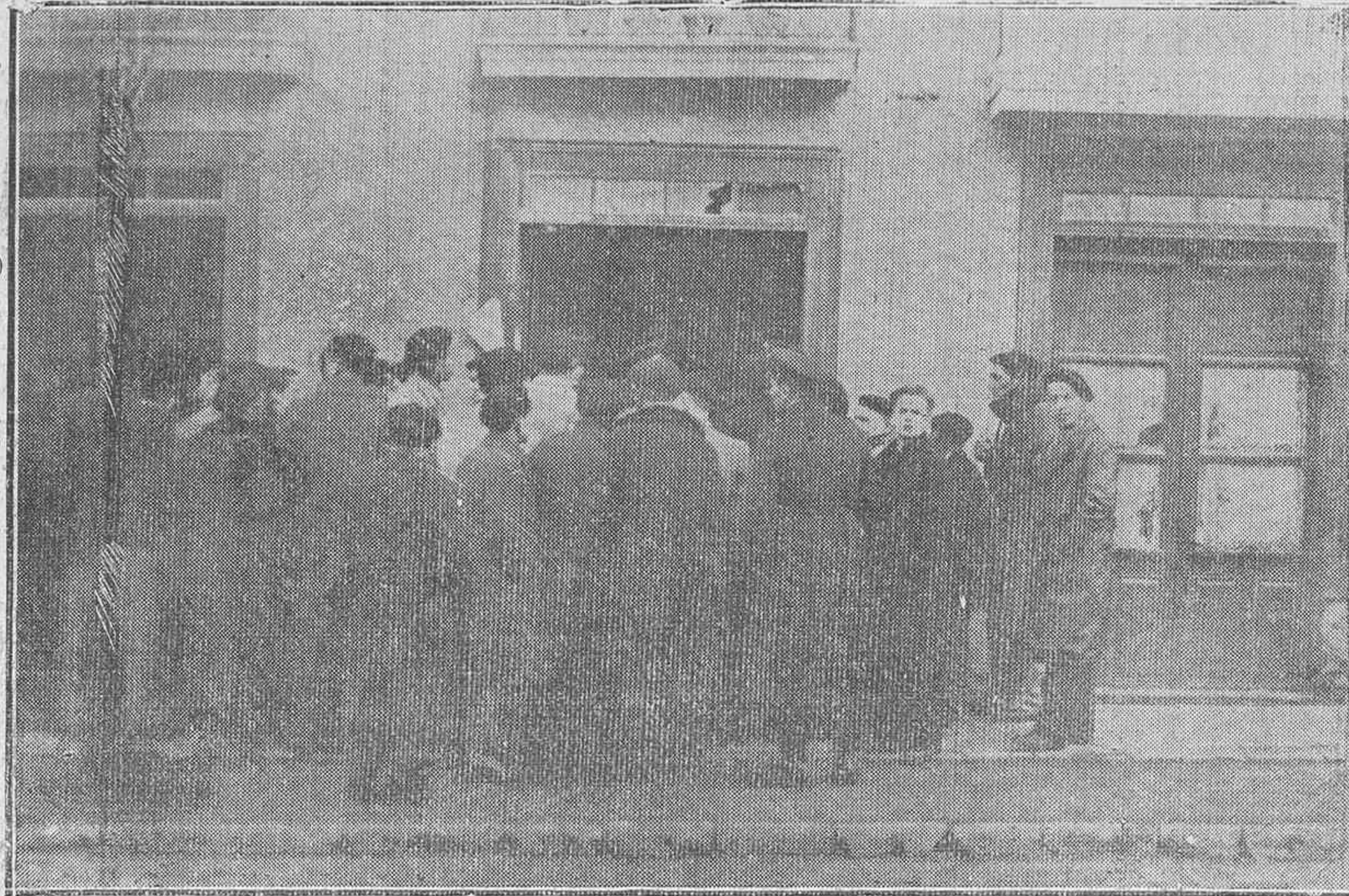
UN PEQUEÑO INCIDENTE EN LA CALLE DE RIOJA

Advertimos a nuestros lectores que por estar intervenidas las líneas telegráficas, no ha funcionado hoy nuestro Teletipo, fallando así un servicio informativo que teníamos organizado y que hubiera sido interesantísimo.