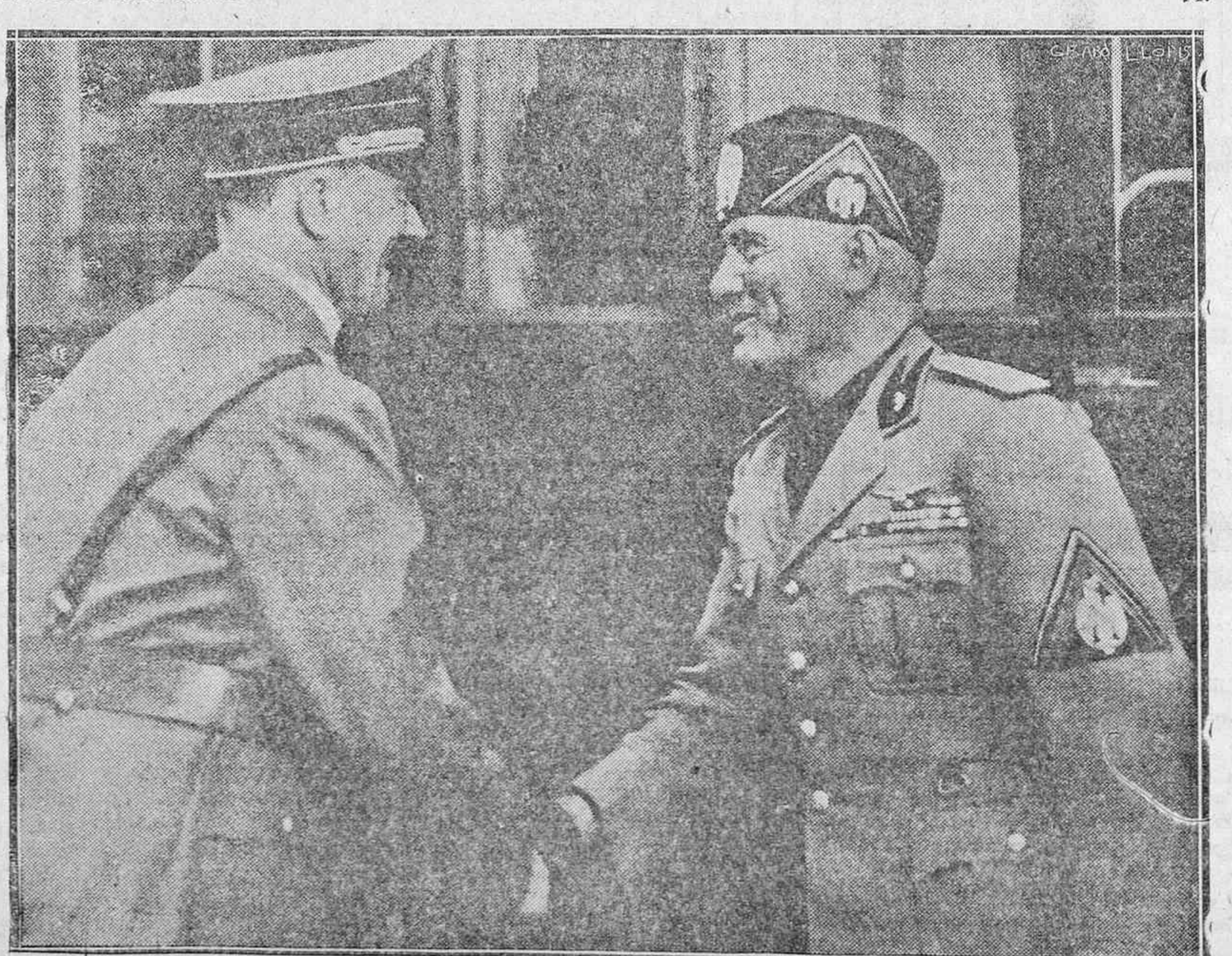
El gesto de generosidad y de buena voluntad demostrado por los dos grandes hombres de Alemania y de Italia ha conmovido al mundo, siendo aplaudidos incluso por los países más "democráticos".

Lisboa, 28.—Ayer empezaron los trabajos de la reunión anual del Consejo Nacional de la Juventud Católica Femenina, a la que asistió el Cardenal Patriarca de Lisboa, y que trató especialmente del tema familiar.