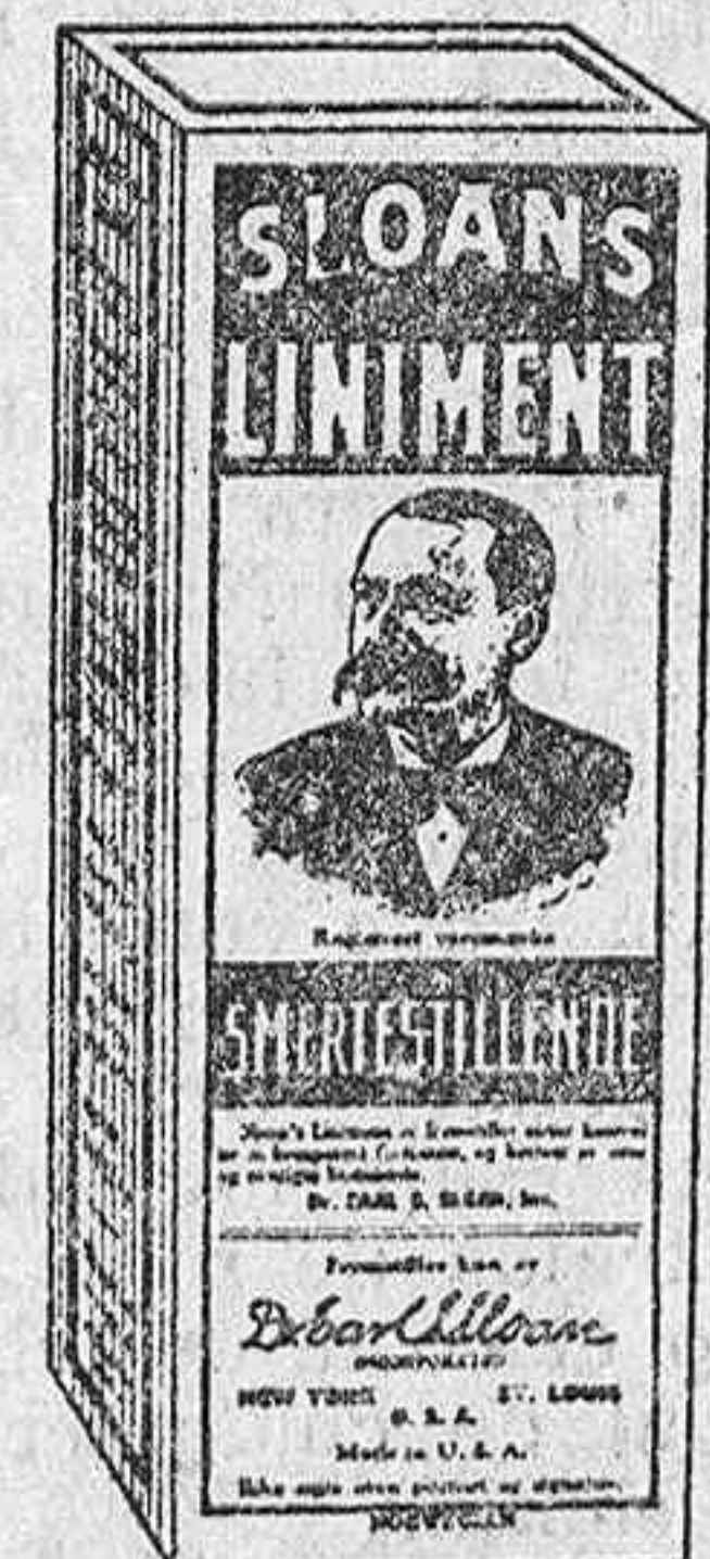
Paquete de venta en Noruega