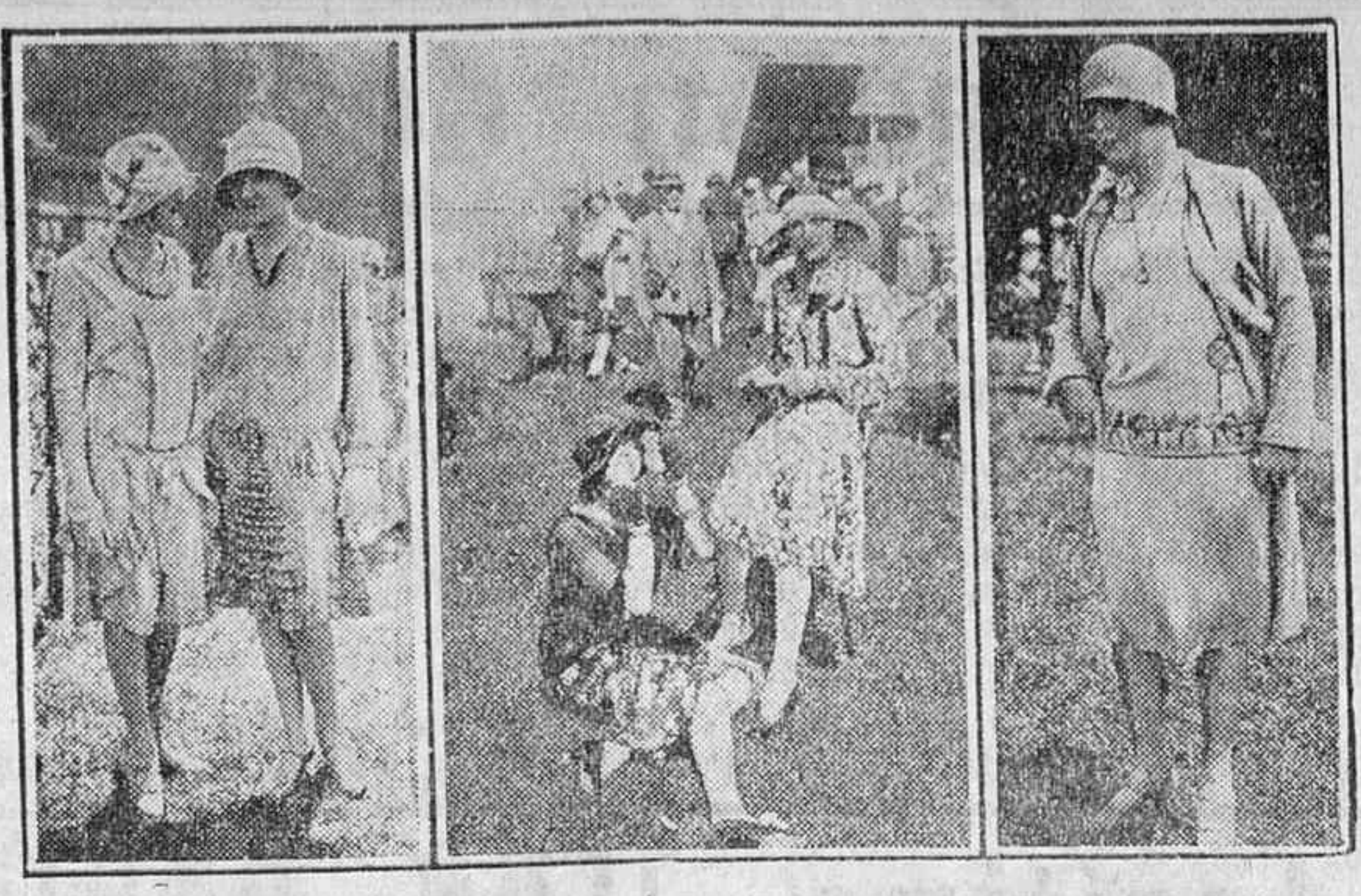
TRES MODELOS DE LA MODA FEMENINA. QUE HAN LLAMADO LA ATENCION EN LAS CARRERAS DE CHANTILLY