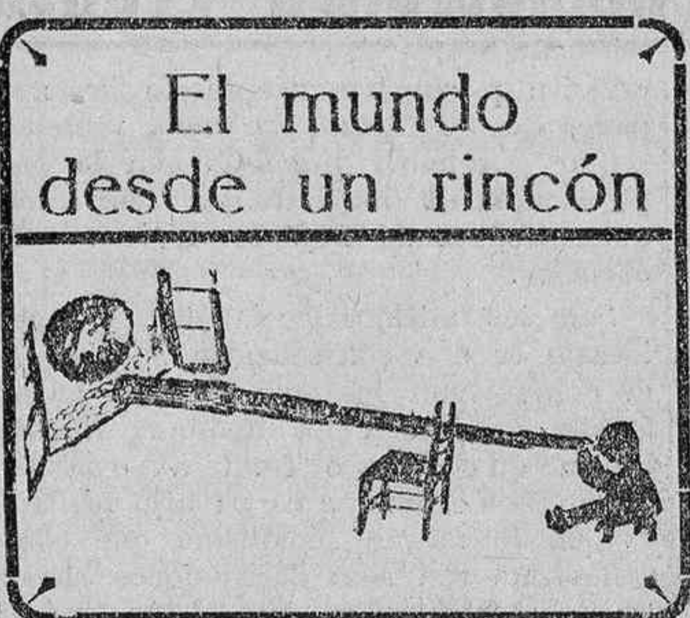
El mundo desde un rincón