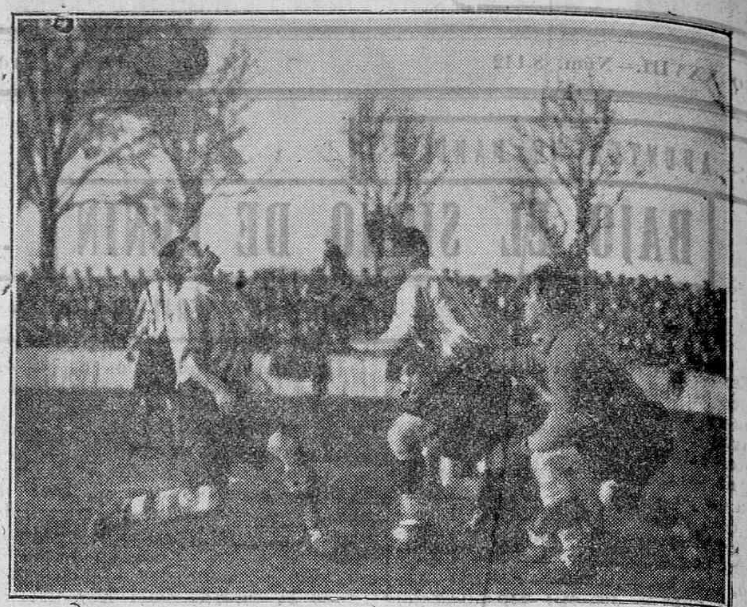
UN MALABARISMO DE QUINCOCES.

Después de lo que llevamos escrito poco hemos de agregar. El Deportivo ganó por la eficaz defensa que hizo y por que el ataque se mostró más decidido y peligroso que el contrario. Ya hemos dicho lo que hizo el trio defensivo. Antero, un poco más «contemplativo» que de ordinario, intervino menos en juego o por lo menos corrió menos que otras veces; pero estuvo siem-