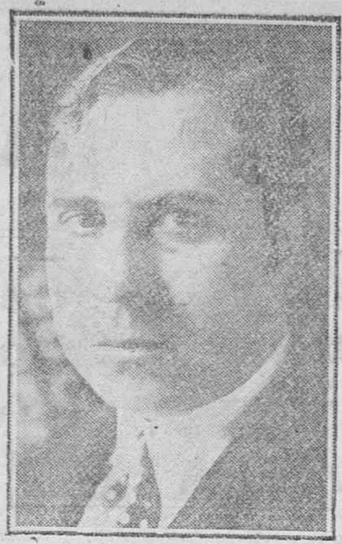
Don Ramón Gómez de la Serna, actualmente en París, donde ha sido muy bien recibido por los elementos literatos.

BEBED SIDRA «EL GAITERO» QUITTA CALLOS «RADICAL» UNICO QUE EXTIRPA TOTALMENTE LA RAIZ. VENTA: FARMACIAS Y DROGUERIAS.