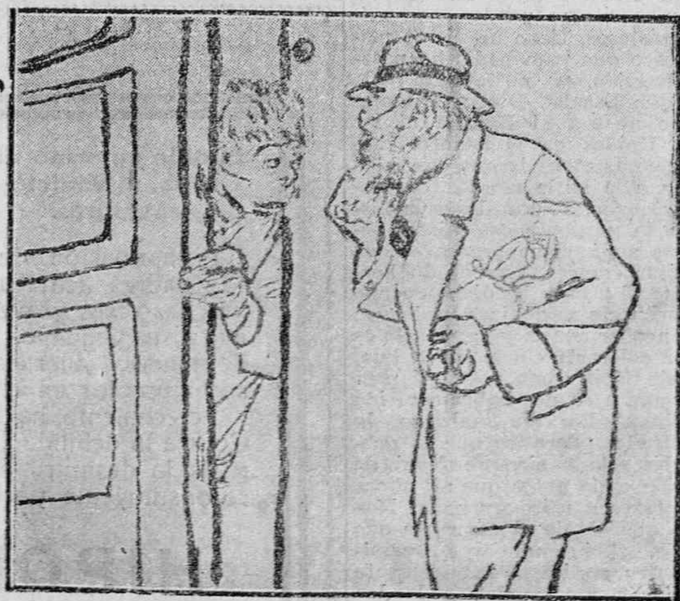
CRUADOS DE CASA GRANDE

Bajan los lobos al llano; y en Narvaia y Salvatierra y en Araya y en Zurbano, dicen: Escopeta en mano y CHOCOLATE DE EZQUERRA.