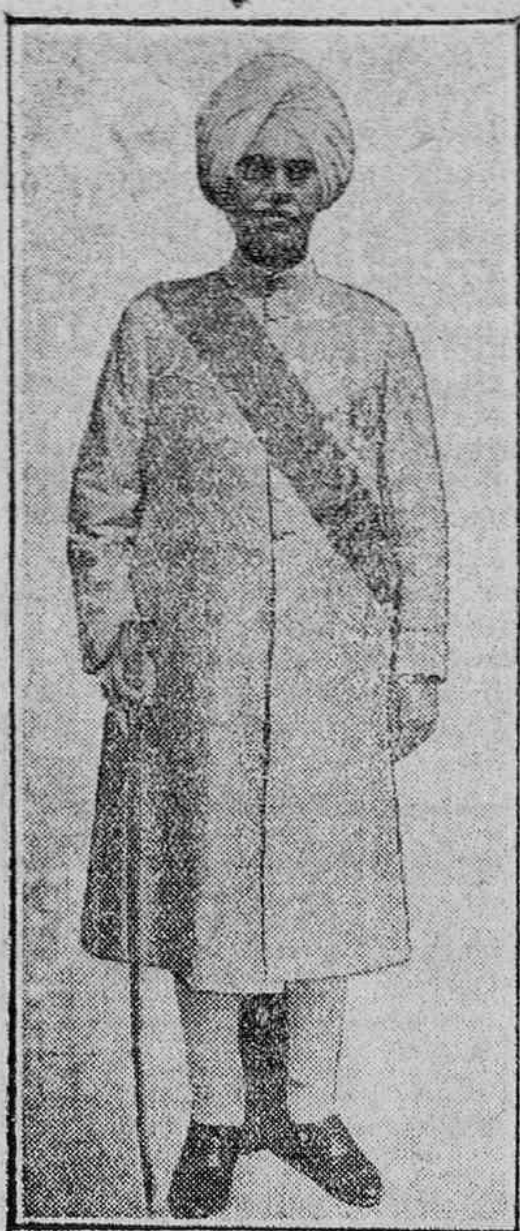
EL SOBERANO DE KAPURKALA

El pugilismo español había marchado hasta ahora viento en popa sin tropezar con la menor dificultad. Todo habían sido éxitos. Todavía no conocíamos el amargor de las derrotas. Y hacíase menester