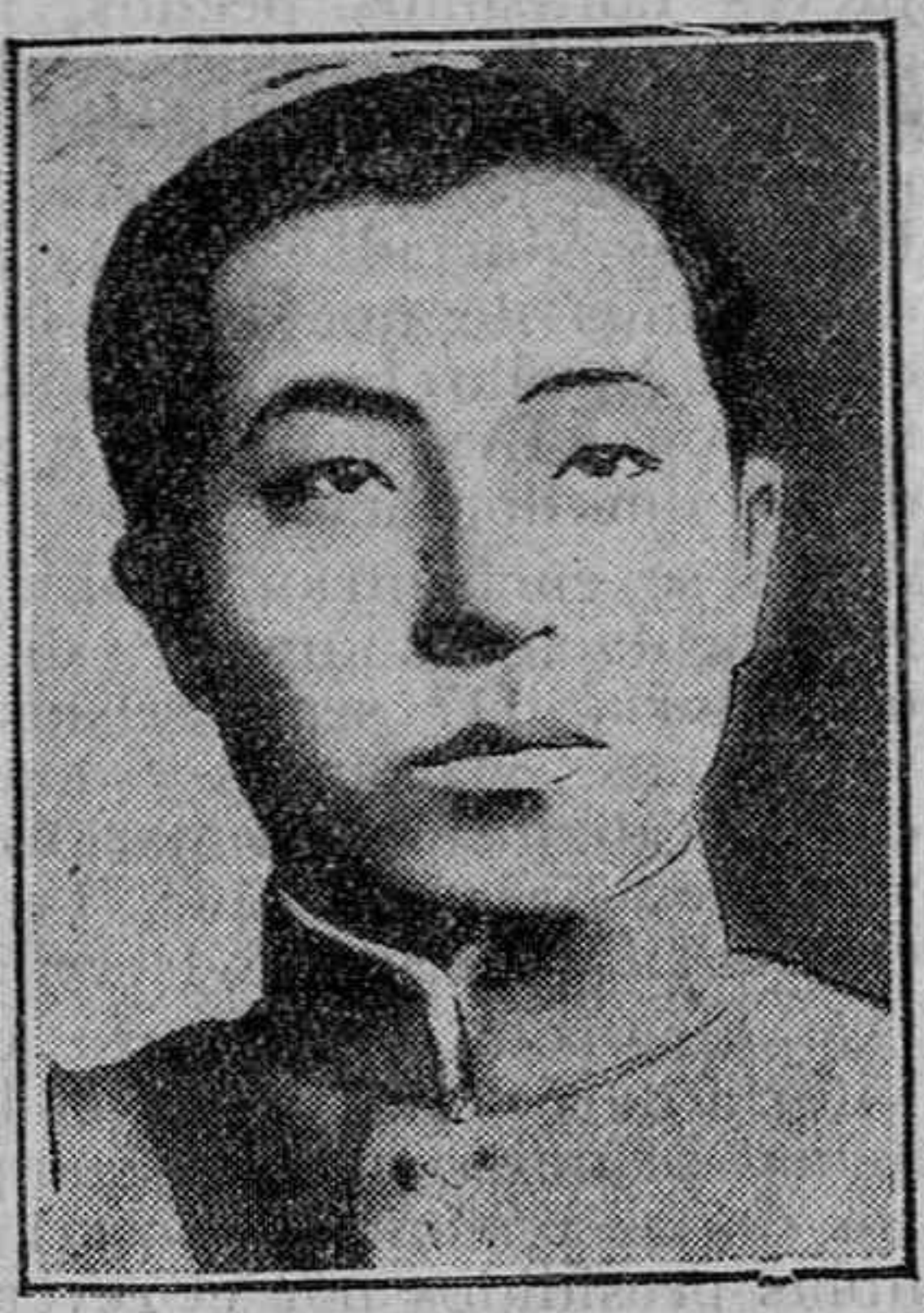
Del conflicto ruso-chino