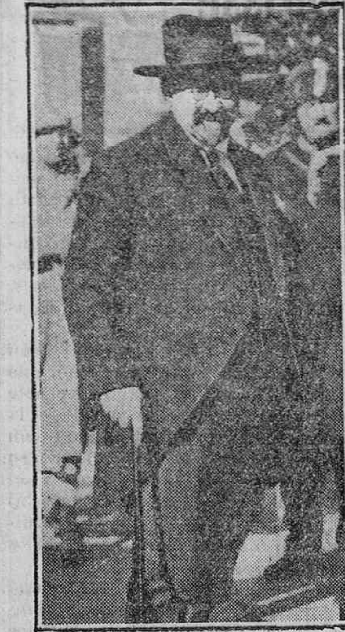
LAS SORPRESAS DE LA S. D. N.

Pero estas pequeñas modificaciones en el régimen interior de la Cámara, no tienen importancia. La cosa verdaderamente trascendental es la relativa a la ocupación de los escaños. El Gobierno ha manifestado que deja en libertad absoluta a todos los asambleístas para