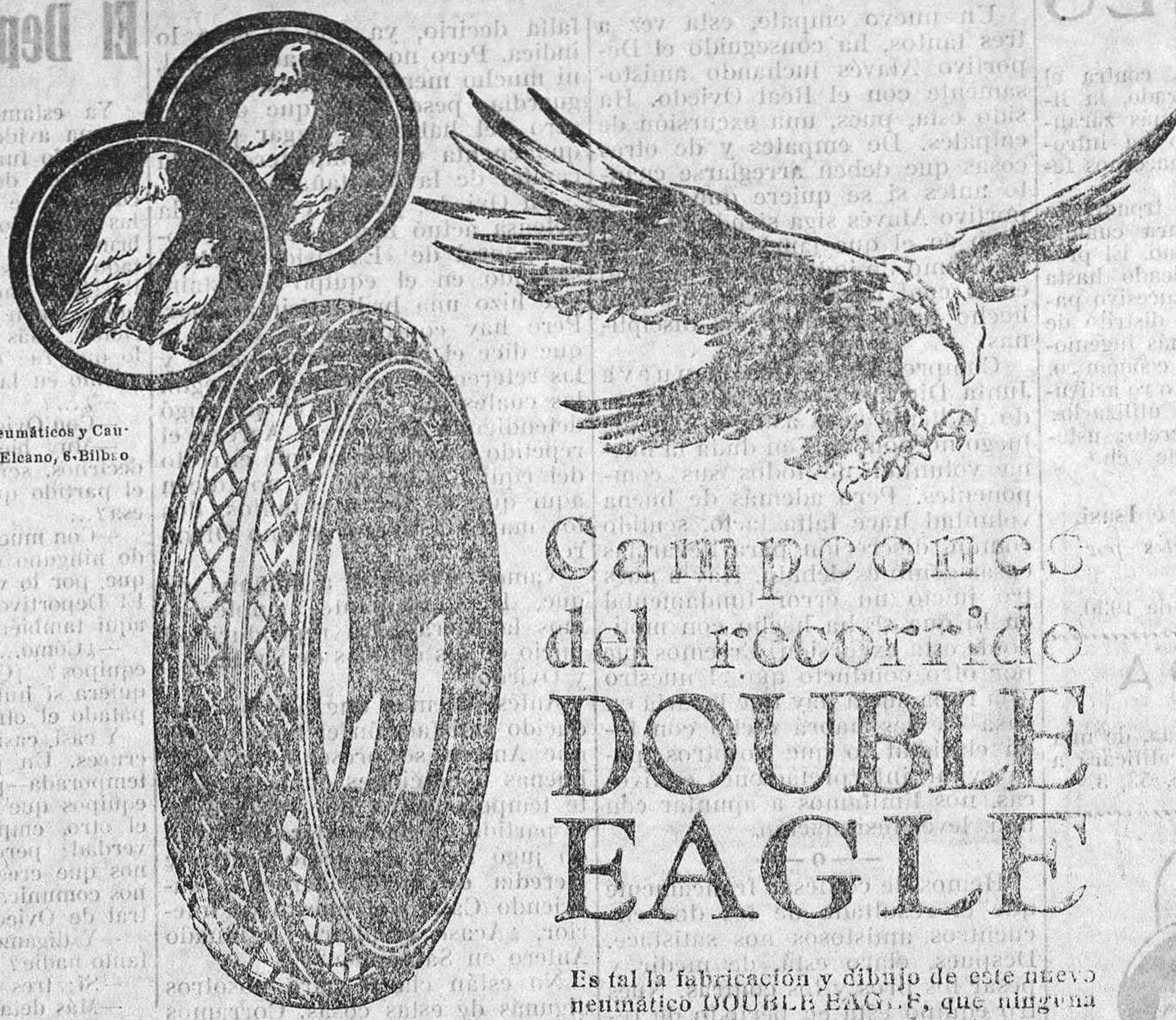
Cía. Española de Neumáticos y Caucho Goodyear S. A. Eicano, 6-Bilbao

Síntomas para conocer en el niño la enfermedad: Tos seca; picazón en la nariz, garganta y ojos; rechinar de dientes; sueño intranquilo; entreabierto los ojos cuando descansa; malas digestiones; mal olor en el alimento e inapetencia.