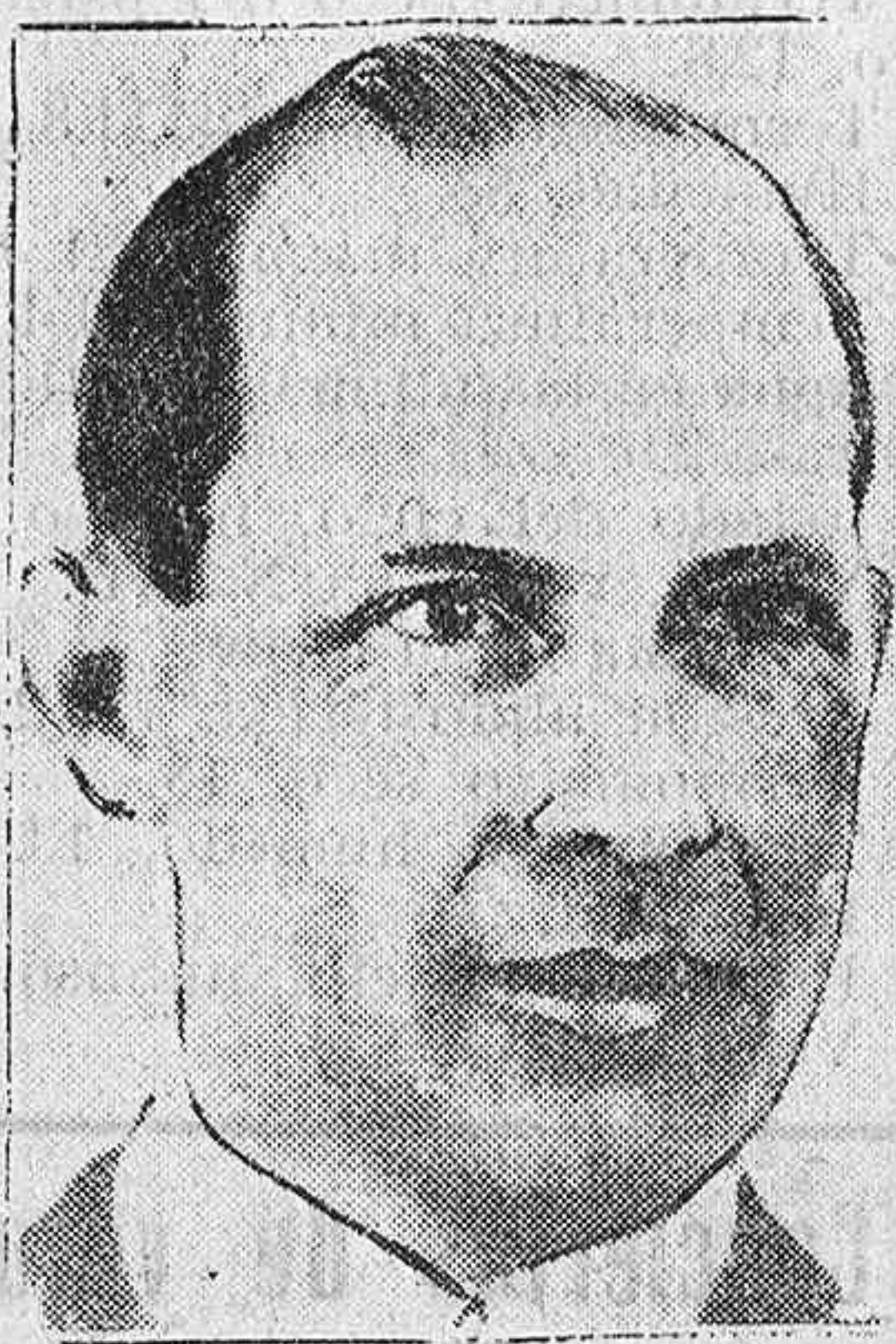
EL EX-REY DE GRECIA