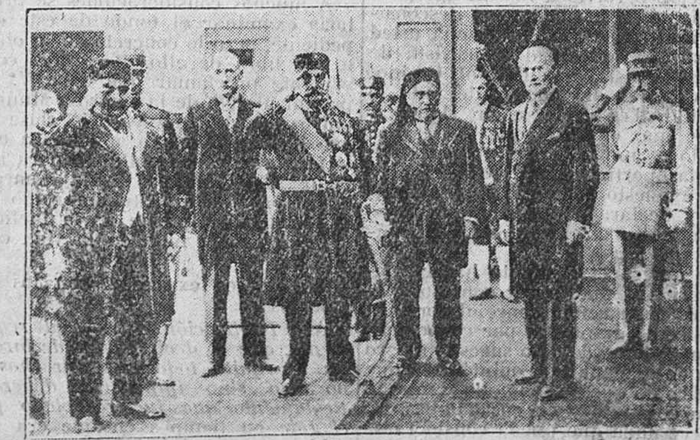
El rey de Túnez, actualmente en París, donde ha asistido a las fiestas del 14 de julio con el Presidente de la República.