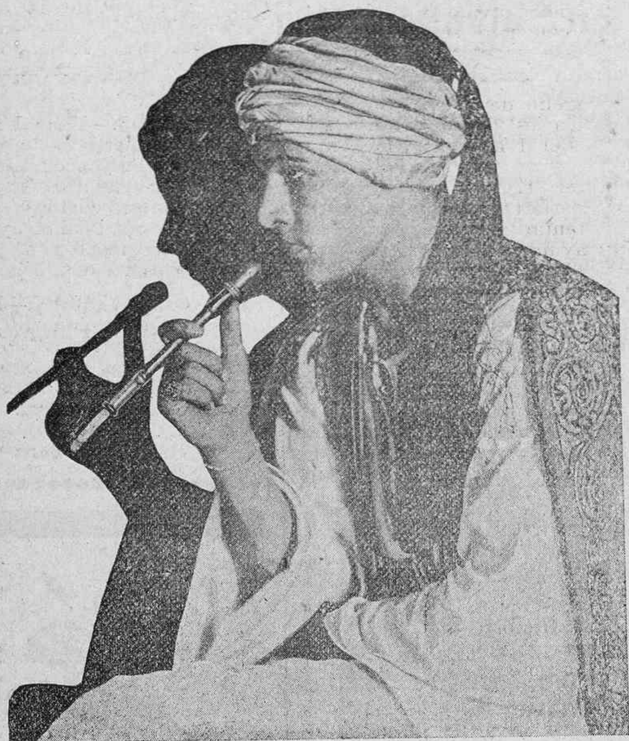
RODOLFO VALENTINO en «El Caid» que mañana se estrena en el «Ideal Cinema».