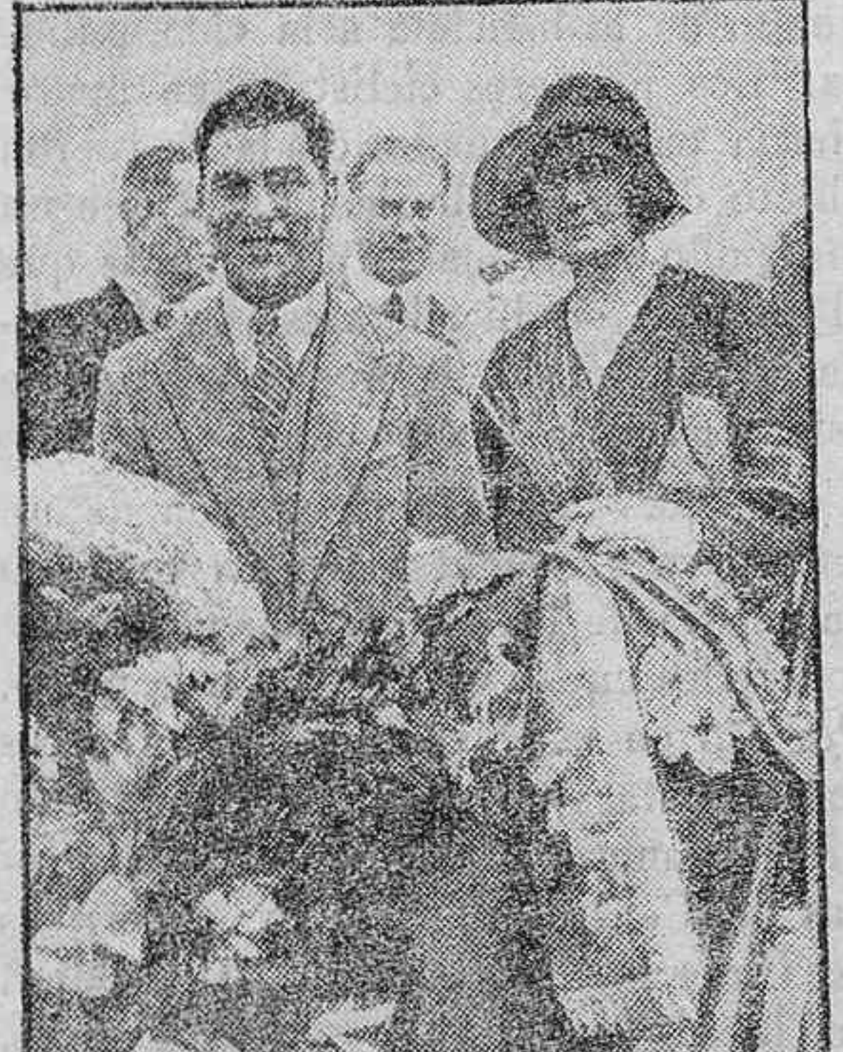
Schmeling, el ex-campeón mundial, que últimamente se ha casado en Berlín con la artista Anny Ondra, y que según se dice piensa retirarse del boxeo.

La artista no ha visto jamás boxear a su esposo, y creía que el boxeo no era más que un deporte como otro cualquiera.