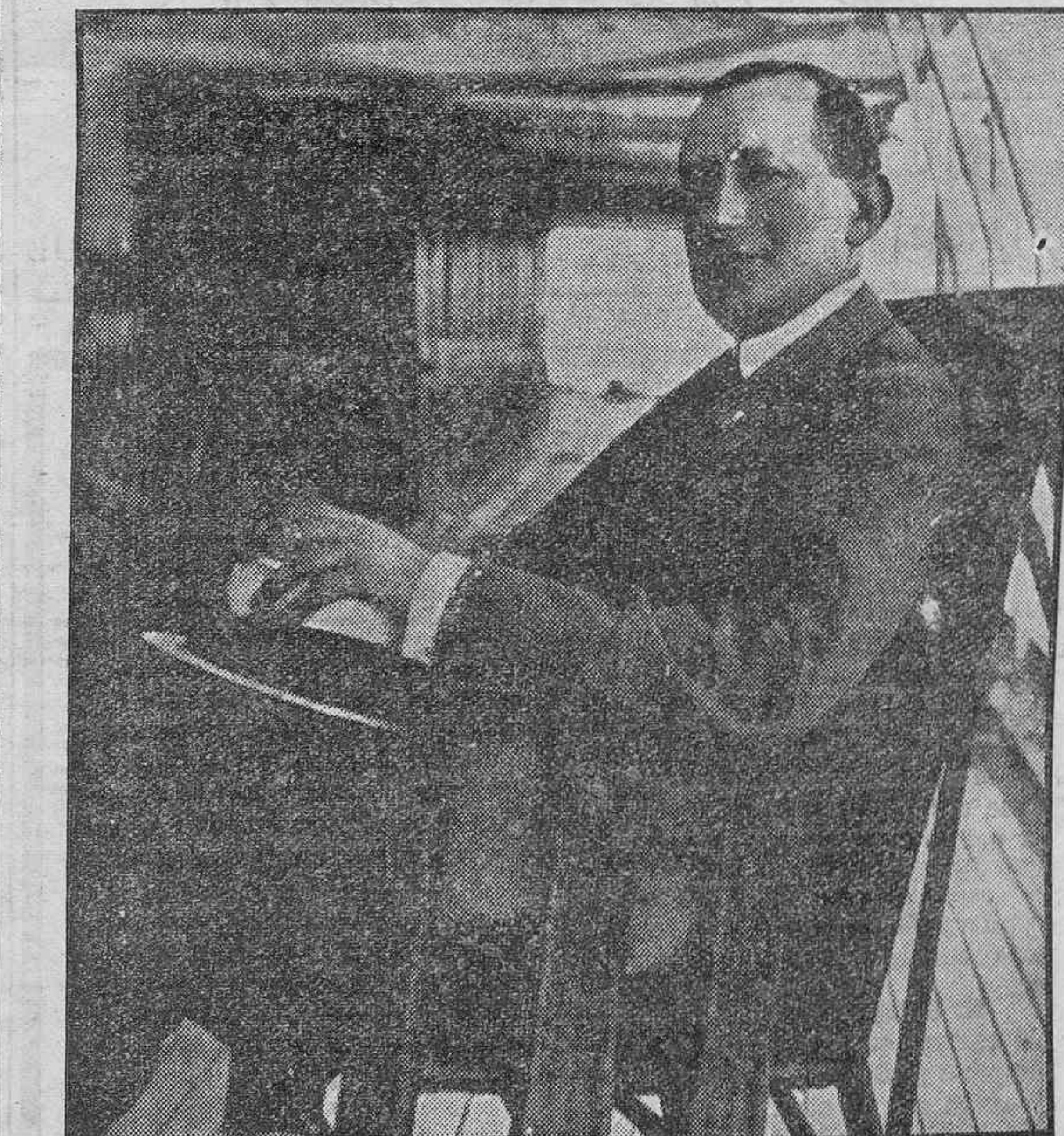
Casto admirable el del insigne Marconi. A su edad avanzada, cuando ha conquistado la gloria y la fortuna, cuando es el hombre del siglo, sigue laborando al servicio de la humanidad, por una irreprimible vocación científica. Acaba de inventar el "ecómetro", aparato que permite conocer las profundidades marinas y que elimina el peligro de los naufragios por embarrancamiento