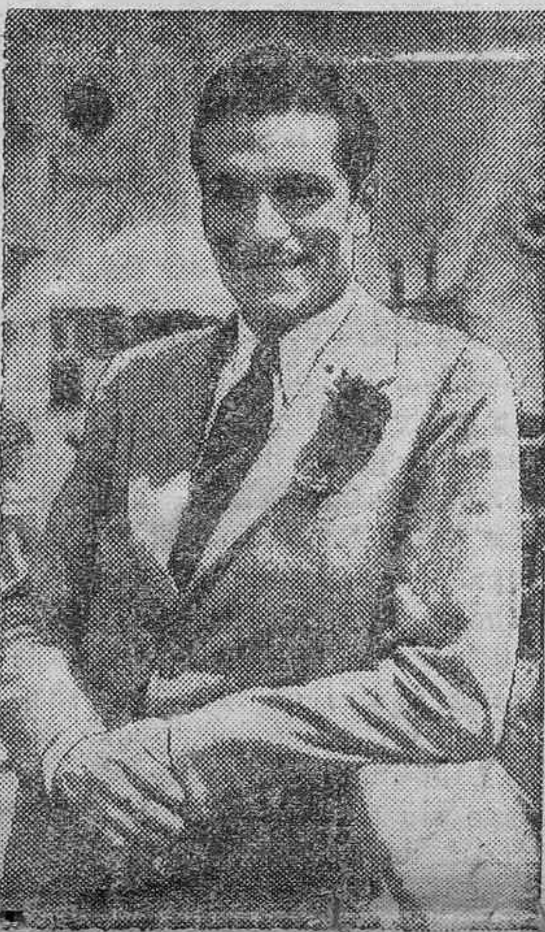
El famoso galán del teatro inglés Laurence Olivier, que en estos días gana actualidad porque ha sido elegido nada menos que por Greta Garbo para que sea su galán en las próximas películas. Por primera vez, Olivier, que es el galán mejor de lengua inglesa, va a trabajar en el "cine".