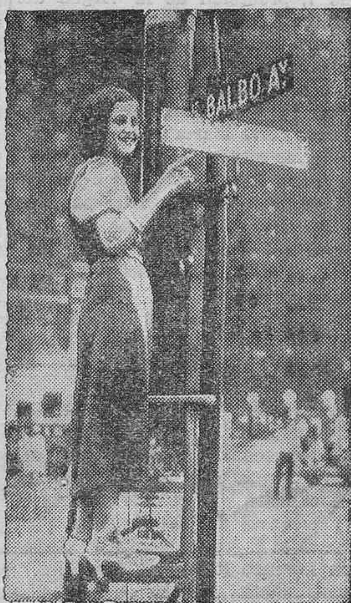
En la ciudad de Chicago se ha rendido un homenaje al ministro italiano del Aire, Italo Balbo, con motivo de su grandioso vuelo en escuadrilla. Ha sido rotulada con el nombre de "Avenida de Balbo", una de las más importantes calles de la ciudad, la número siete.

Sin perjuicio de ampliar el tema en otra oportunidad, sean estas breves líneas un estímulo y una advertencia a los encargados de la obra. Por humanidad y por decorosa imposición de la importancia del país, el edificio para alojar al Tribunal Tutelar de Menores de la Provincia debe salir del retrasado camino del expediente para convertirse en realidad tangible e inmediata.