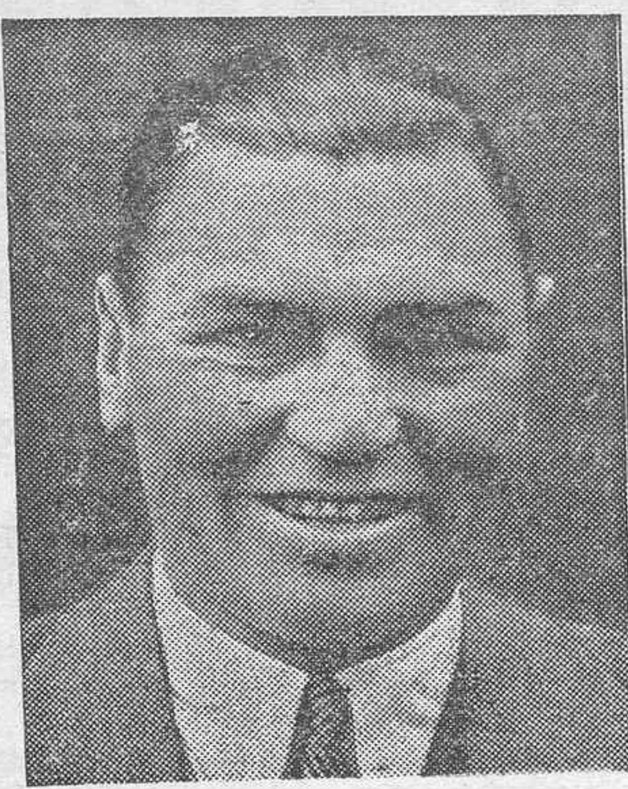
Jack Dempsey, el famoso ex campeón mundial de los pesos pesados...