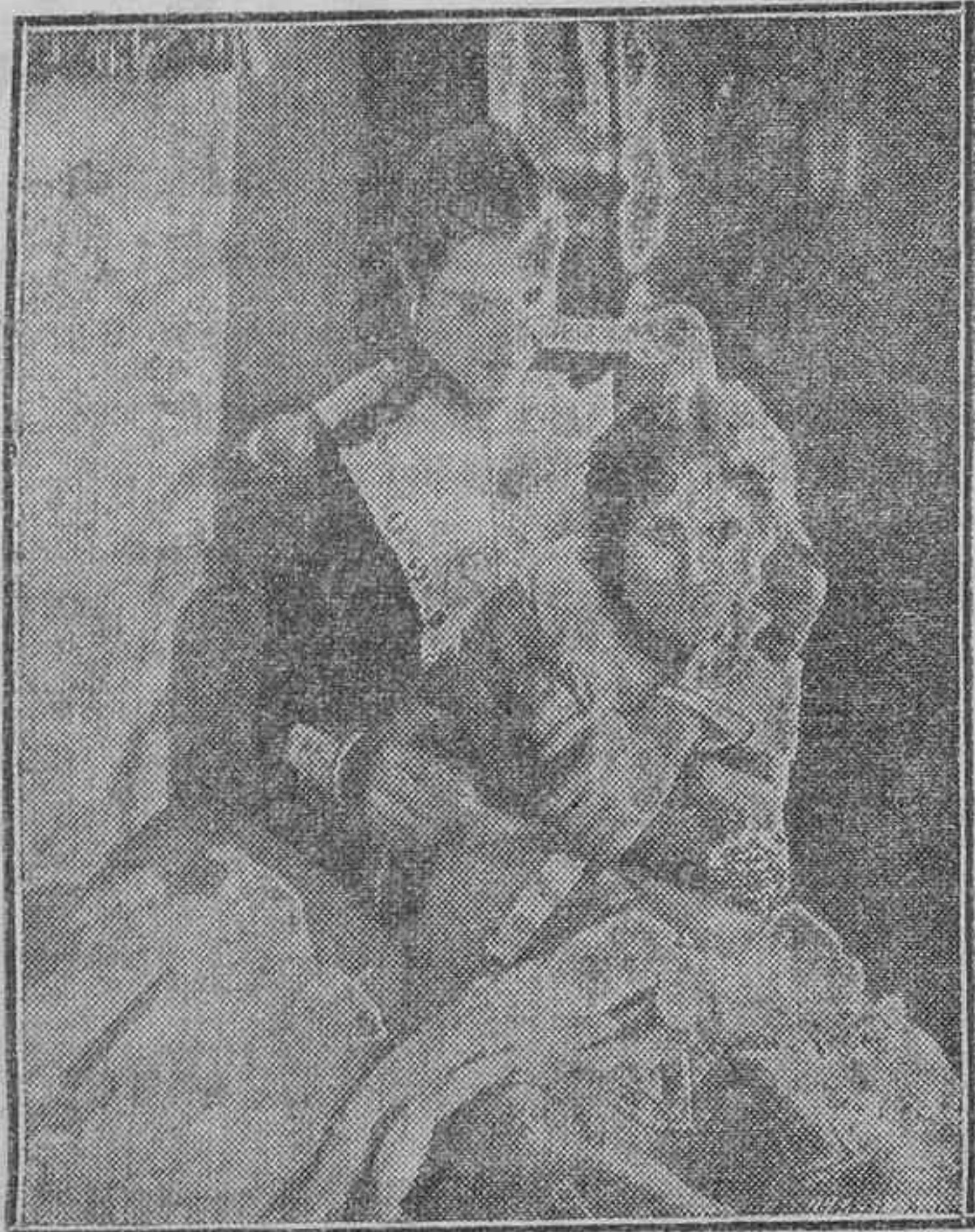
Una escena de «Monsieur Sans Gene»

Mañana, jueves, estreno de "Monsieur Sans Gene" Por Ramón Novarro Unsoberbio "film" sonoro