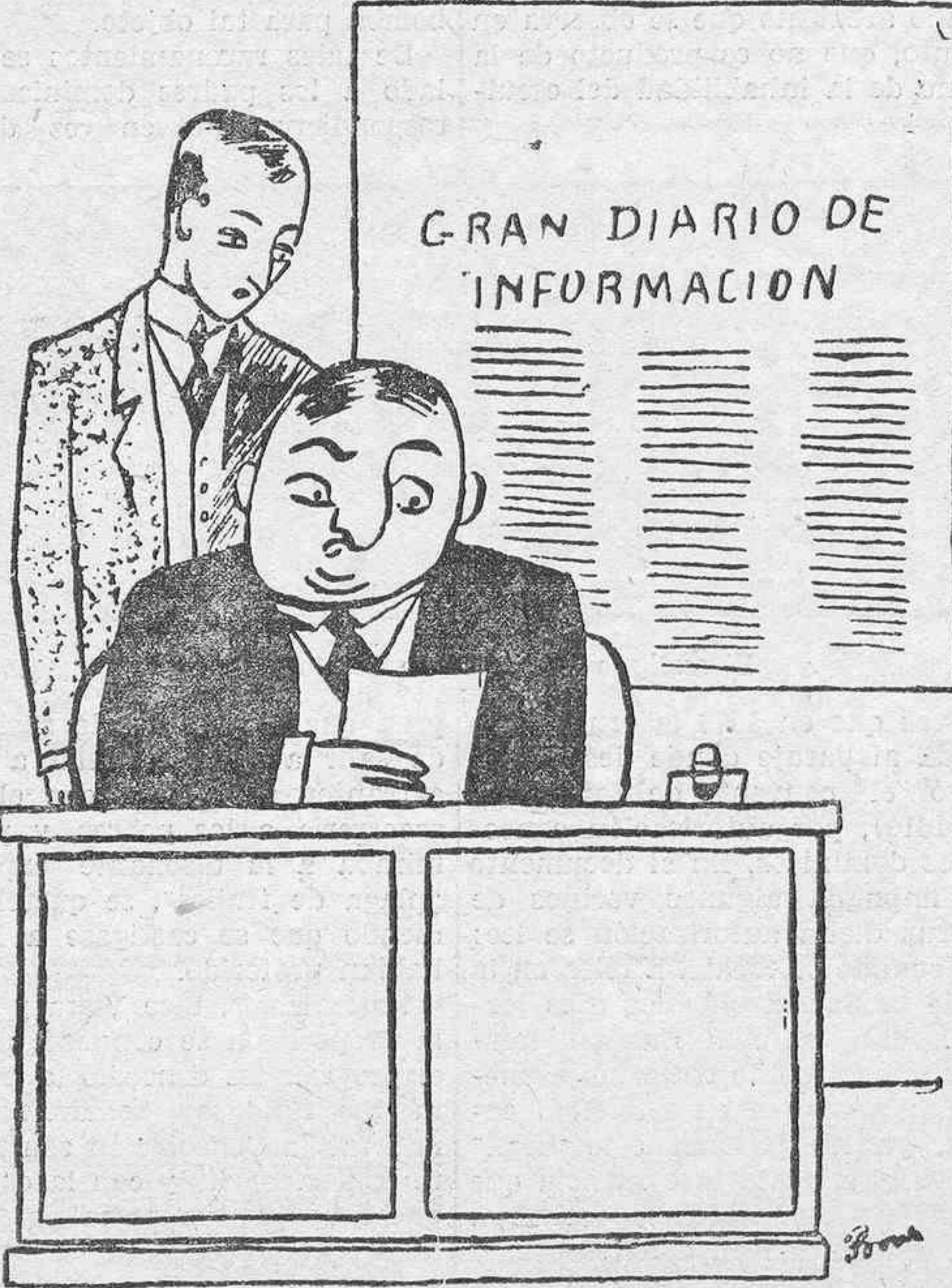
El director.—No entiendo este telegrama de nuestro corresponsal en Tokio. —Yo tampoco. —Suba usted a buscarle. Que baje y nos diga lo que ha querido decir.