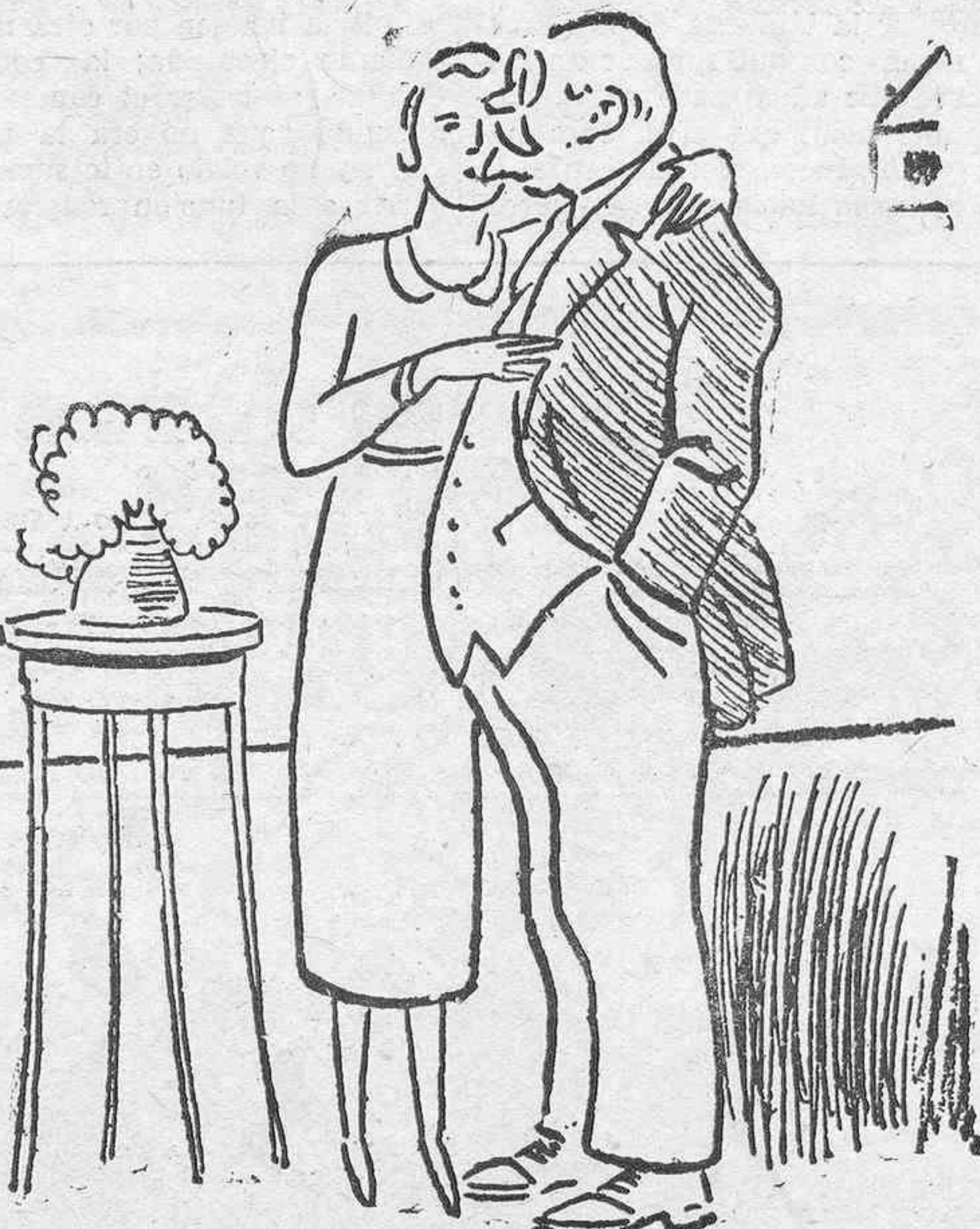
—¡Ver Nápolés y morir, querido! —¡Cuándo quieres marchar?

Agente: L. A. Stroud, Eqnriue Wolfson 32, (Teléfono 561)