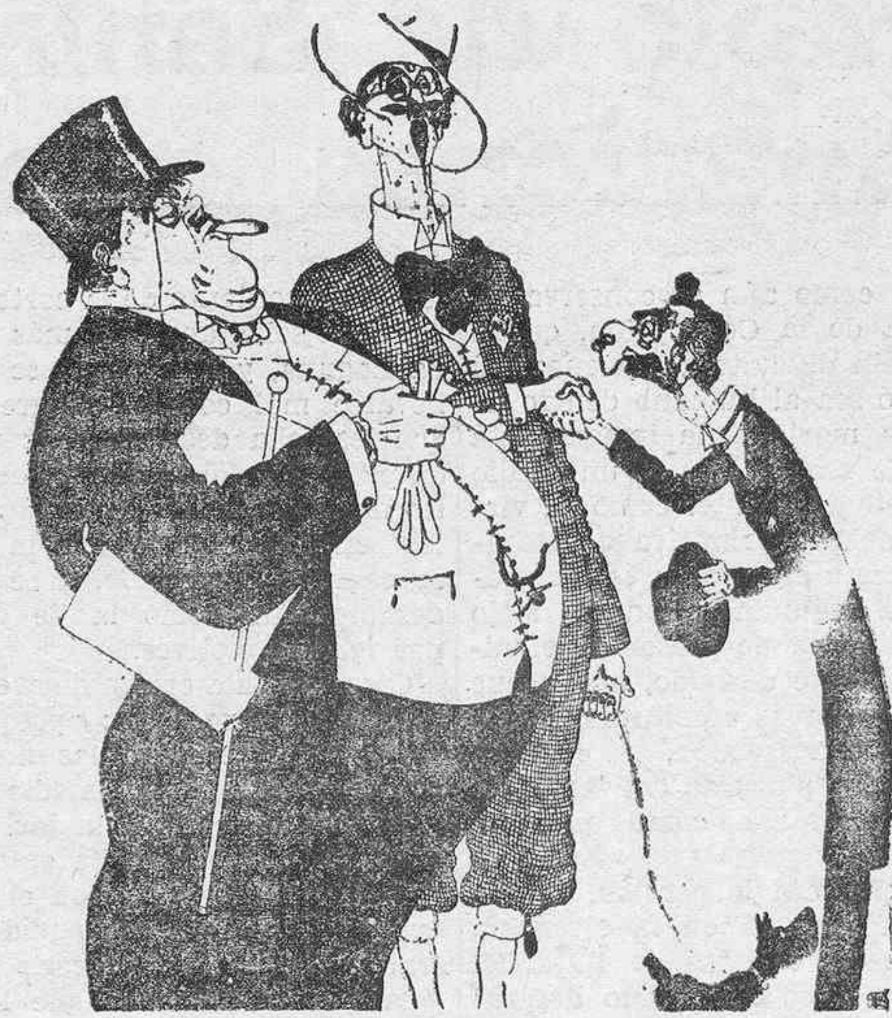
—Ya no se le ve a usted en las conferencias del Desarme. —No tengo tiempo. ¡Estoy tan ocupado en mi fábrica de municiones!