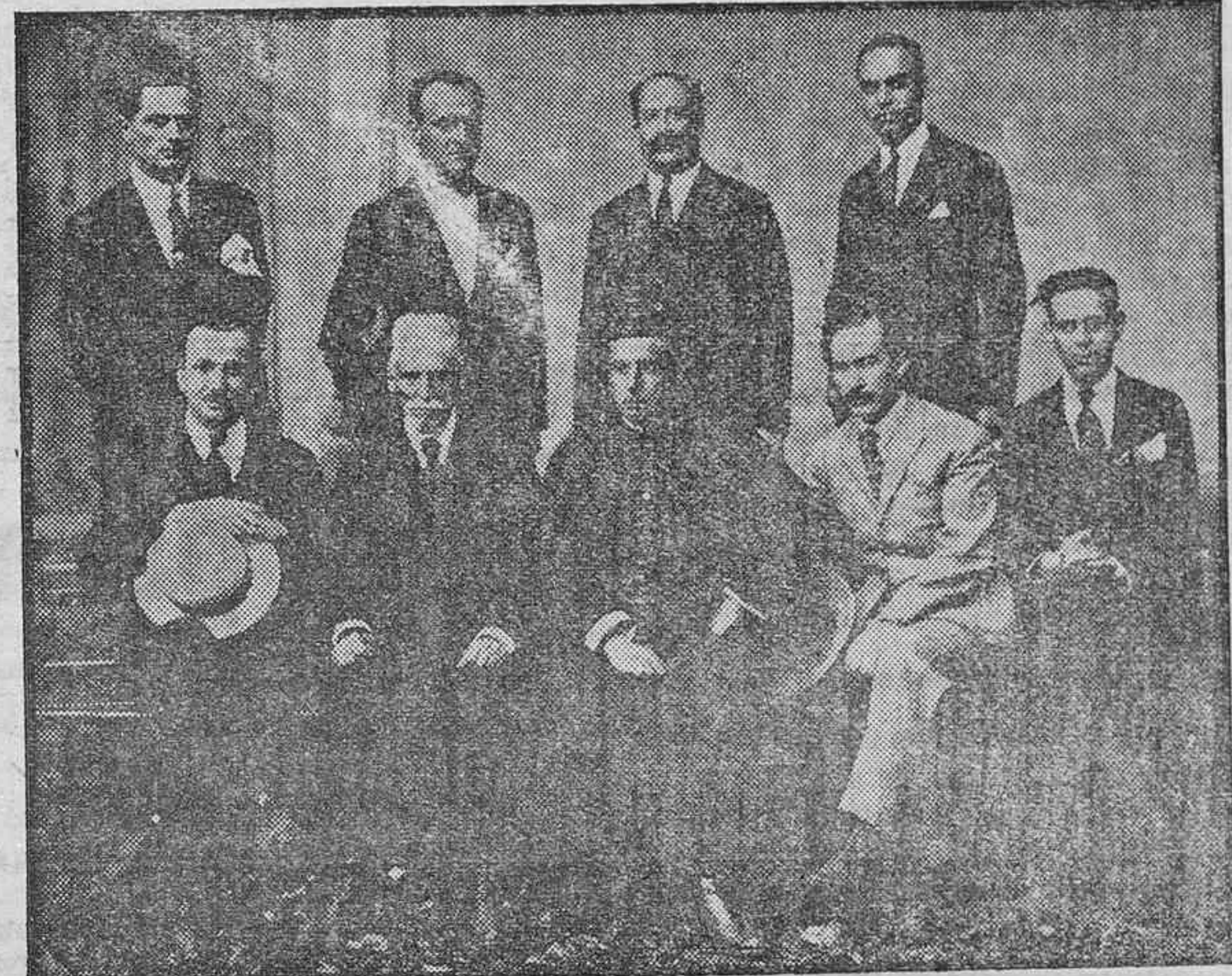
Director y maestros de la escuela graduada de la Villa de la Orotava, con el alcalde, párroco y maestros de Tacoronte, después del almuerzo con que fueron obsequiados por el Municipio de dicha ciudad