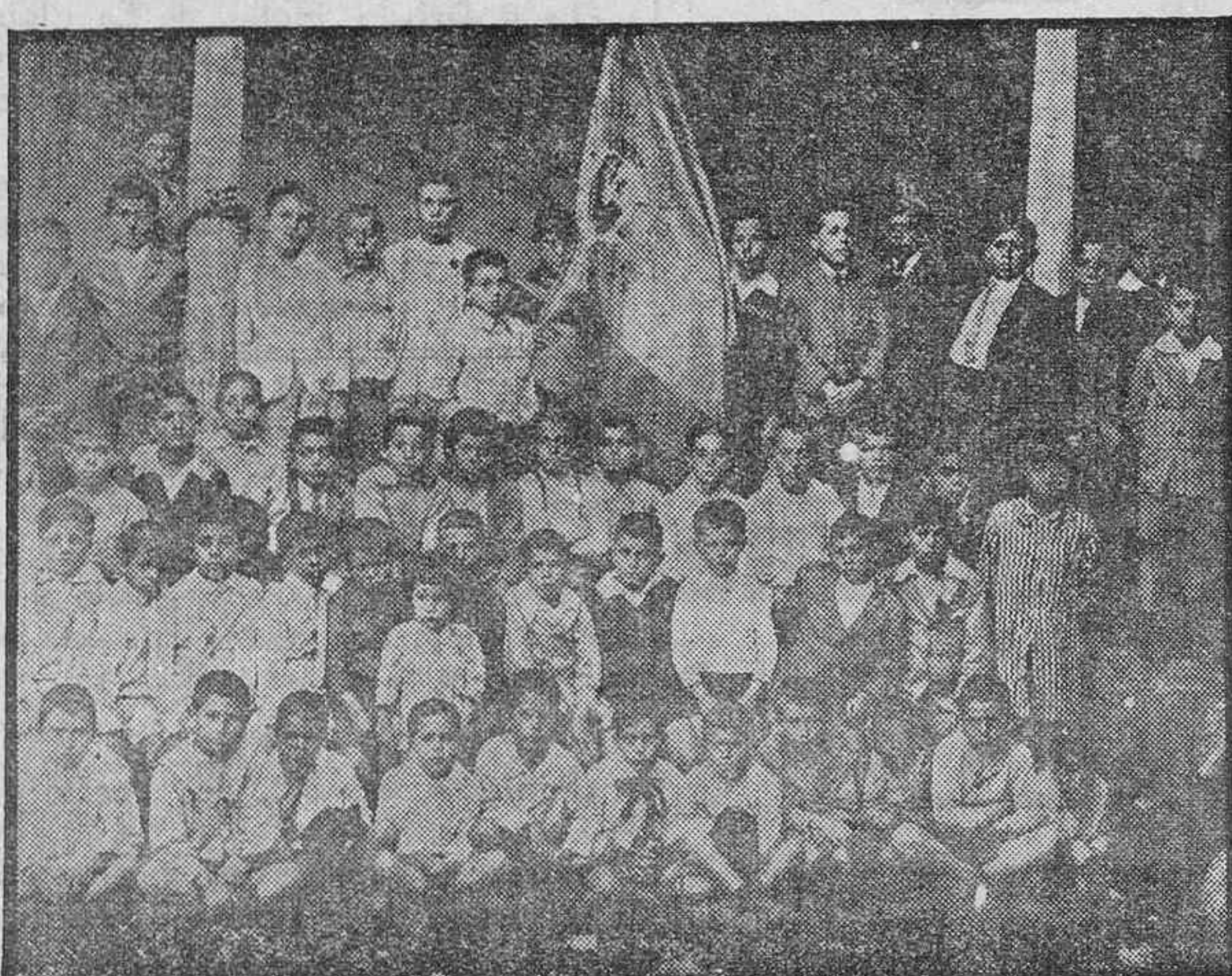
Alumnos de la escuela graduada de niños de la Villa de la Orotava, que realizaron una excursión escolar, el 15 del presente mes, a la ciudad de Tacoronte, acompañados de sus colegas de la misma población

"Lluvias en toda la zona agrícola, que han facilitado las faenas del campo. Ya se ha empezado a sembrar en casi todos los distritos, continuando la descamisación en todo el país, pues se necesita el tiempo más frío antes de mover la cosecha en bruto. Los campos se hallan en buenas condiciones. Hay grandes cantidades de trigo almacenadas al lado de todos los ferrocarriles, y queda todavía existencia para la exportación."