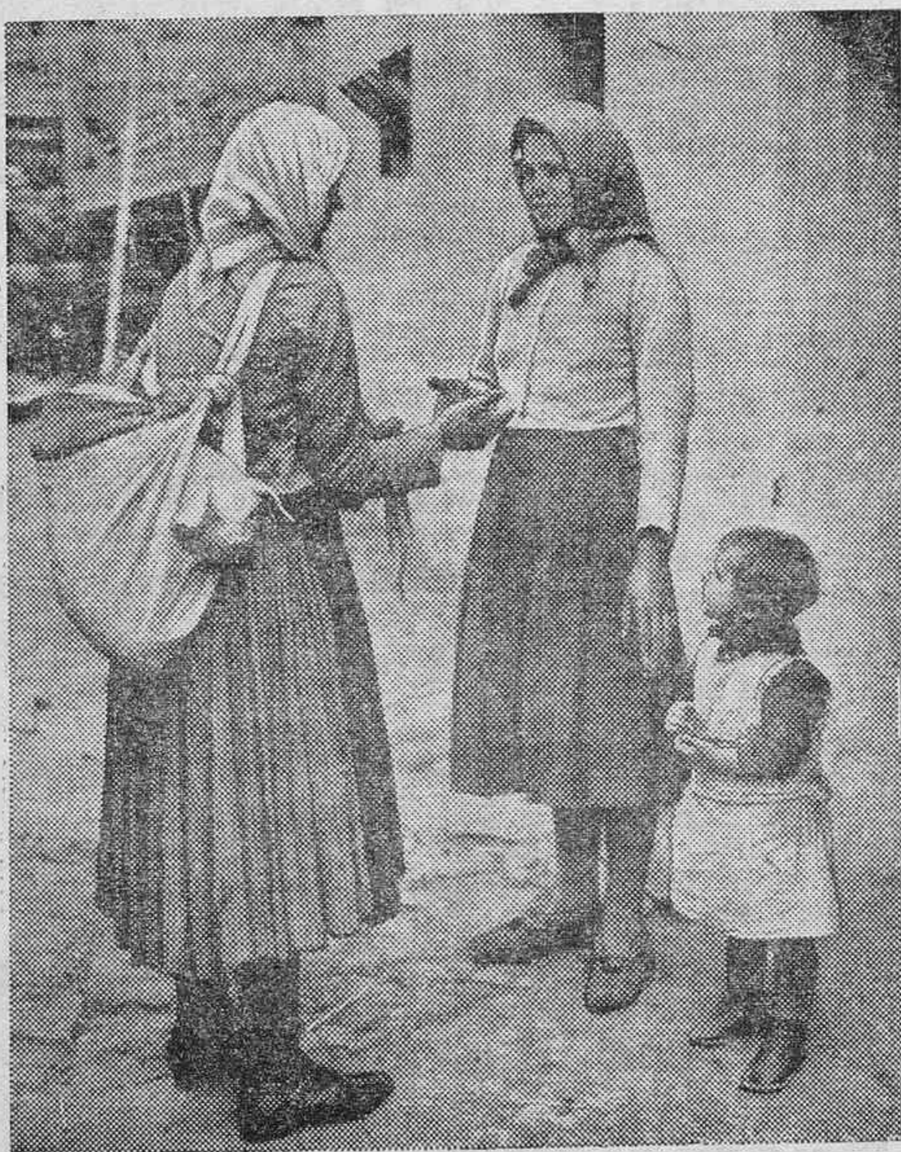
INSTANTANEAS DEL EXTRANJERO.—Campesinas de Checoslovaquia.