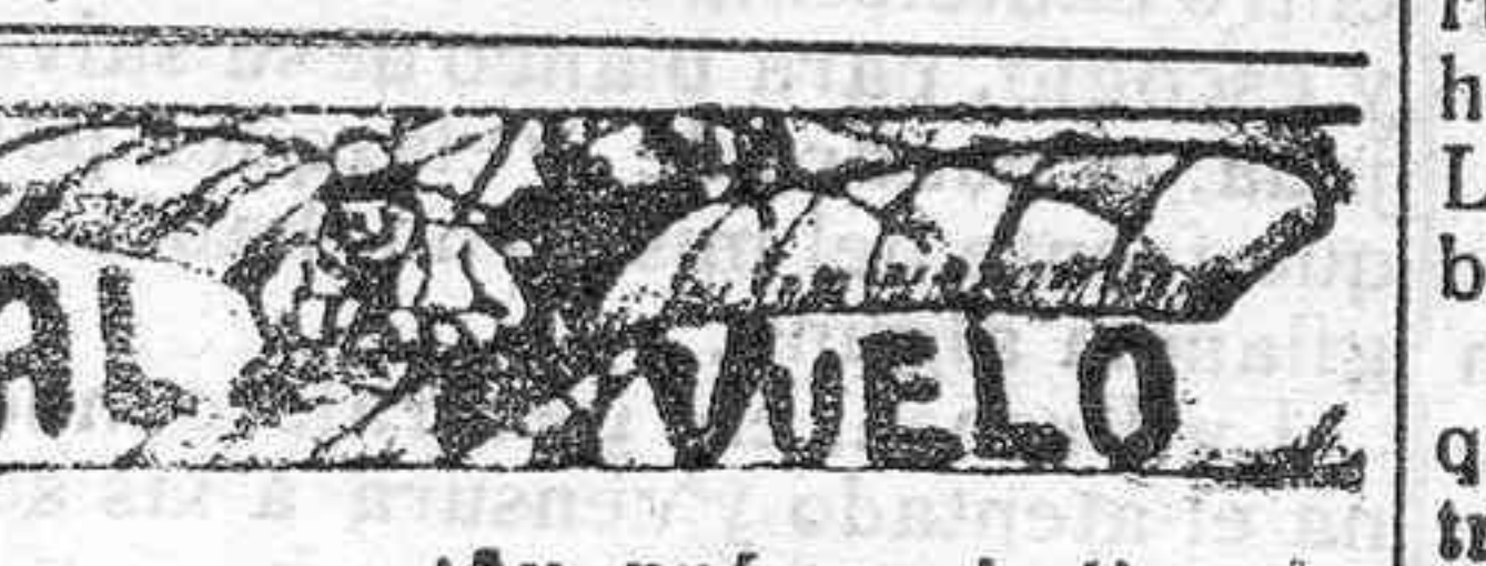
¡Ay, qué gracia tienen!

Se sabe que un núcleo de 5.000 federales, acosados incesantemente por sus enemigos, se han visto precisados á refugiarse en el territorio yanqui, á fin de poner á salvo su libertad ó su vida. Los rebeldes que se hallan en las alrededores de Tampico han cortado las aguas que surten á la ciudad. El estado de la población es lamentabilísimo.—Corresponsal.